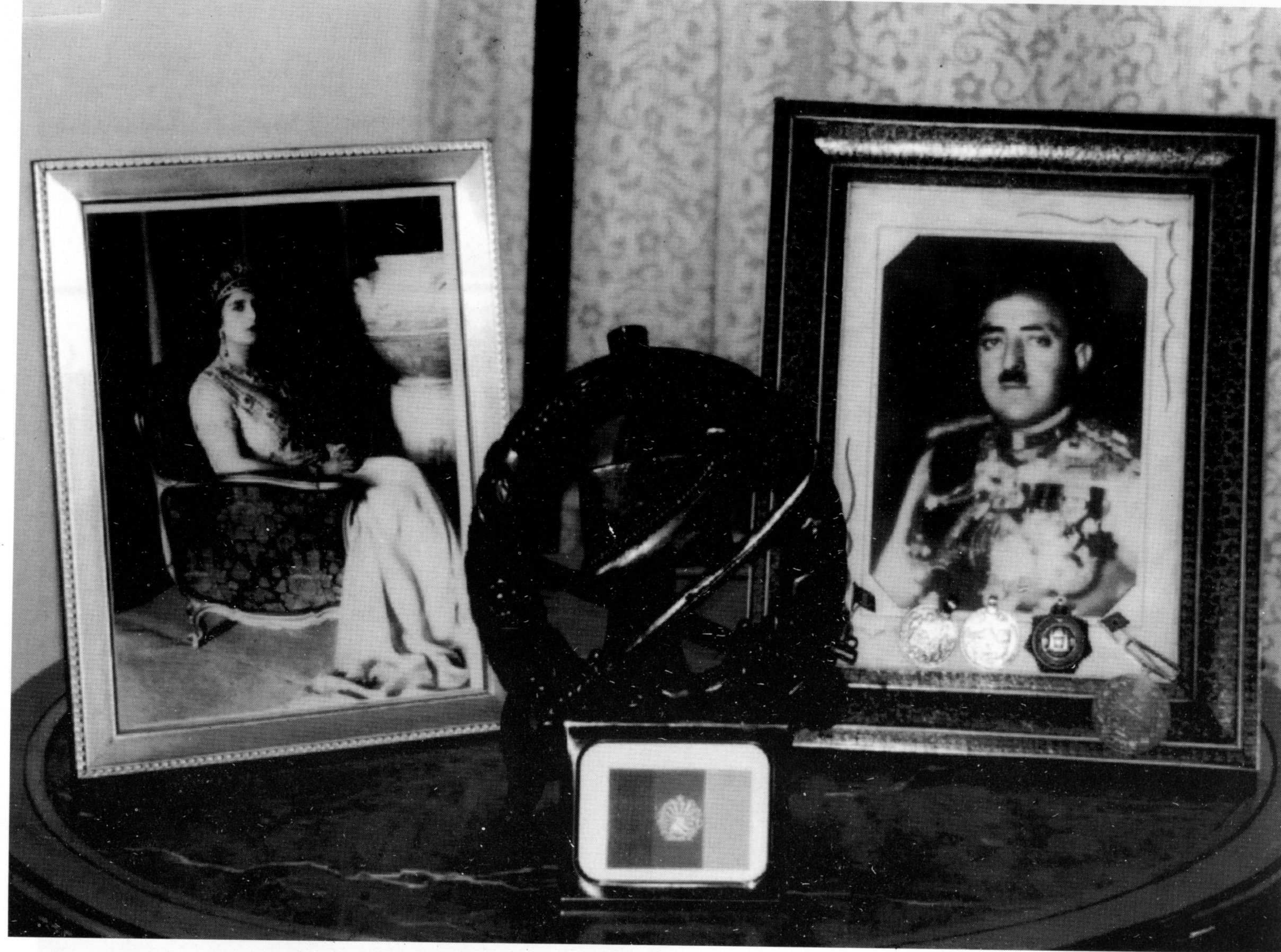
د امیر امان اله خان او ملکه ثریا عکسونه د هغې د زوی د میز پر سر