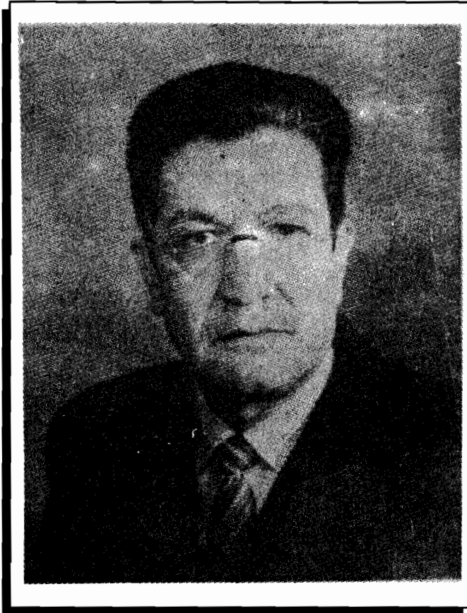
ارواڻباد پوهاند عبدالحي حبيبي