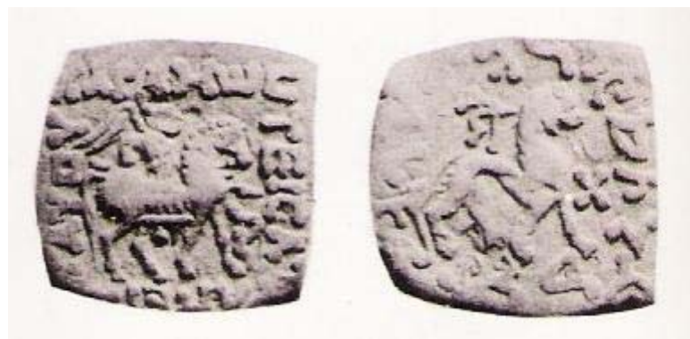
پر سكو باندي د خروشتي الفبې نمونې:

د معاصر افغانستان او هغه ته په ورڅېرمه (خصوصاً لوېديځو) بيلو بيلو سيمو كښي د موندل شوو كتيبو (ليكنو) او سكو له مخي څخه د تاريخ پوهان وايي چې د دغو سيمو د بيلو بيلو ژبو له پاره خروشتي الفبې رواج وه. خروشتي د يو ډول لرغوني الفبې نوم دى نه د يوې ژبې. دلته لاندي د خروشتي الفبې نمونه وگورئ: