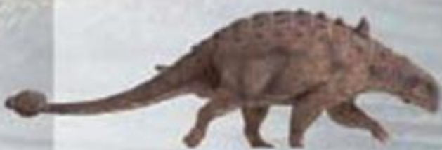
ادمونتونیا څو کتاره زخې (چرې) درلودې.