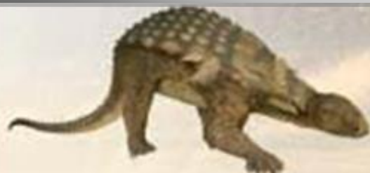
گاستونیا پر شا او لکې باندې زخې (چرې) درلودې.