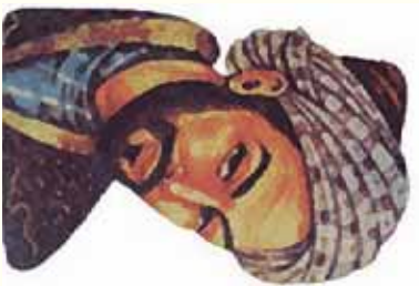
غزلی از: سعدی