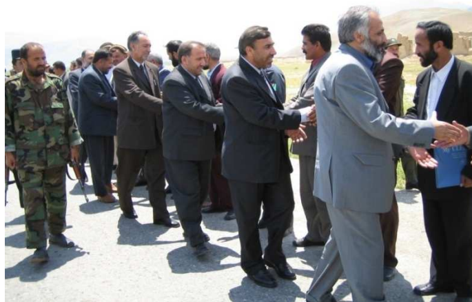
کابل نه شمالی ولایاتو ته سفر: دمخبر اتو وزیر محمد معصوم ستانکزی، شاه محمود میاخیل، محترم عبدالرحمن معقول او محترم انوری د سمنگانو د دولتی چارواکو سره روغې