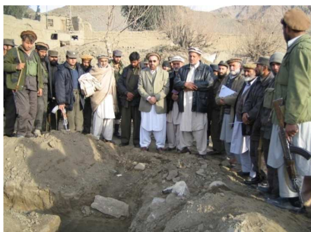
شاه محمود میاخیل د کنړ ولایت د نورگل ولسوالۍ دنوې ودانۍ د بنسټ ډبرې د ایینودلو پر مهال د کنړ ولایت مرستیال حاجی محمد روزی سره