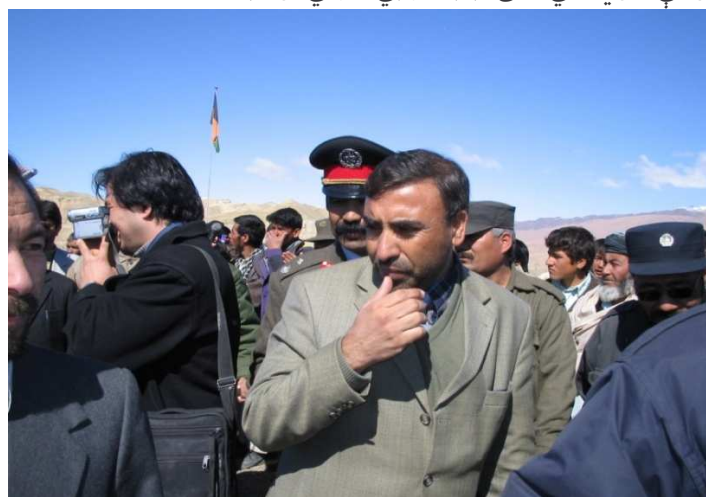
شاه محمود میاخیل په بامیانو کې د قومي مشرانو او د کورنیو چارو وزارت د منسویینو په منځ کې (بامیان)