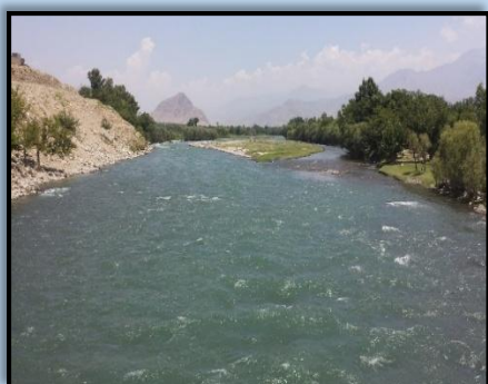
تصویر: از دریای الینگار

لغمان ولايت چې د هندوكش غرونو په څنډ د كابل سيند په څنگ كې موقیعت لری چې د علينگار او عيشنگ سيندونو دی ولايت ته لاربنكلا وربښلی ده