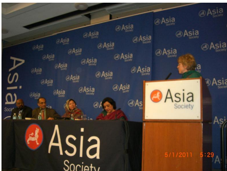
د ایشیاء سوسائیتی مشرہ رچل کوپر د خطاب پر مهال