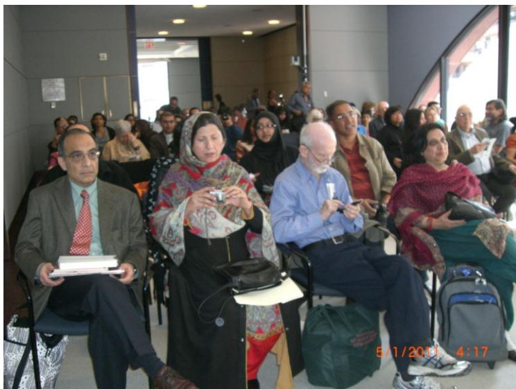
په نیو یارک کې د دستوري پر مهال