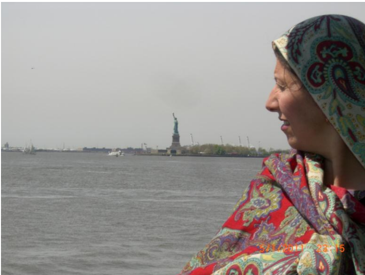
يو بل عکس د سمندر د غاړې