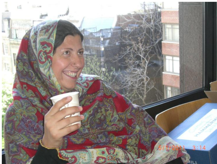
د ایشیاء سوسایټی دفتر