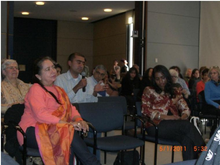
د غونډې نور گډونوال د پوښتنو پر مهال