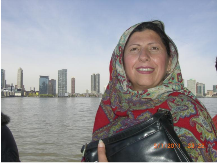
د بلي غاري سيل