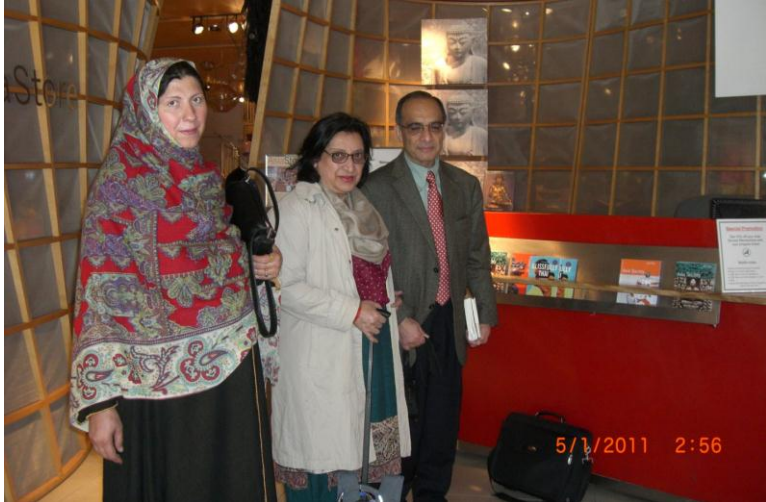
په نیو یارک کي د دستوري نه مخکي