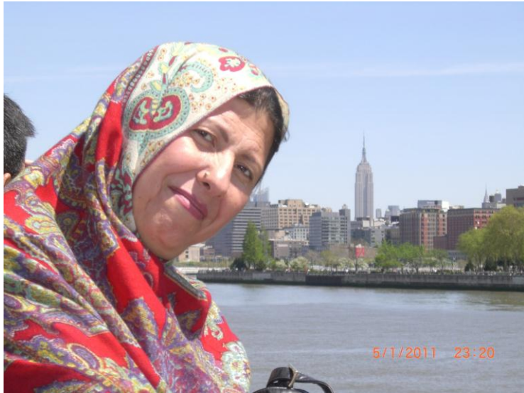
نیو یارک بنار د کشتی سیل او سمندر غاره