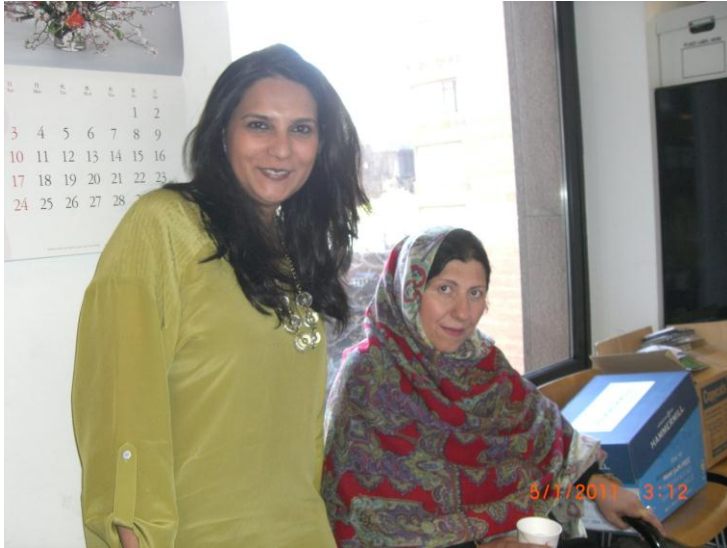
د ایشیاء سوسائیتی نیو یارک په دفتر کې