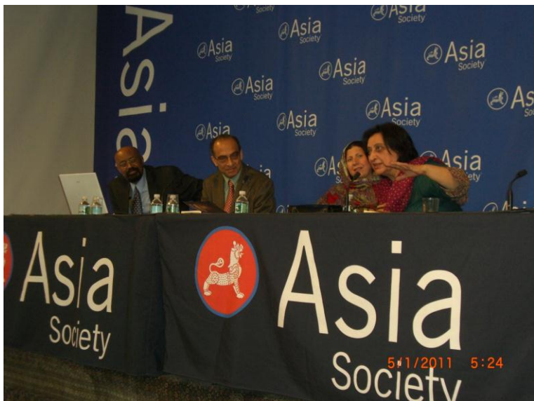
فهمیده ریاض د وینا کولو پر مهال