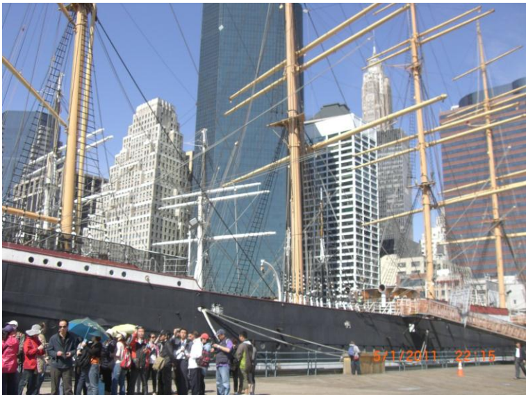
د سمندر د غاړي يو بل عکس