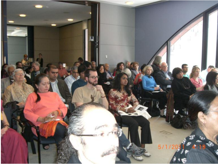
د نیو یارک د دستوري یو بل عکس