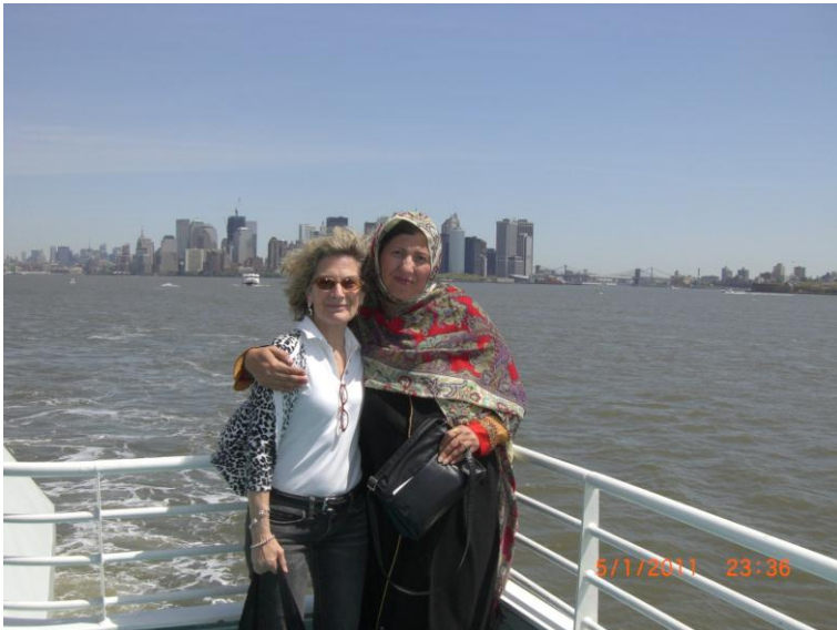
زه او پيني اوجيده