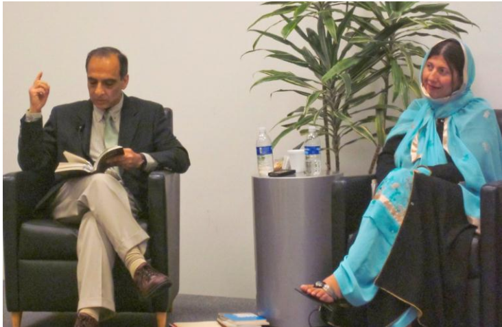
په هوسټن کې د وقاص خواجه سره د یوې مرکې پر مهال