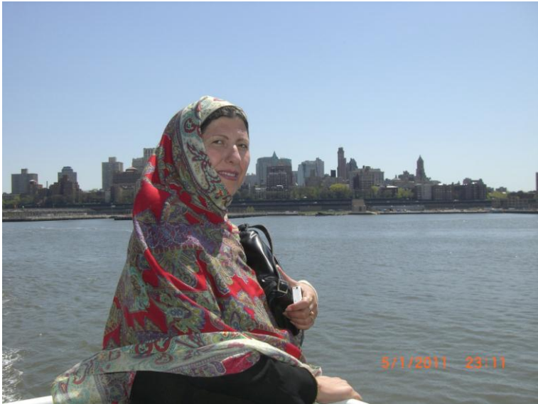
یو بل بنکاره عکس د نیویارک سمندر