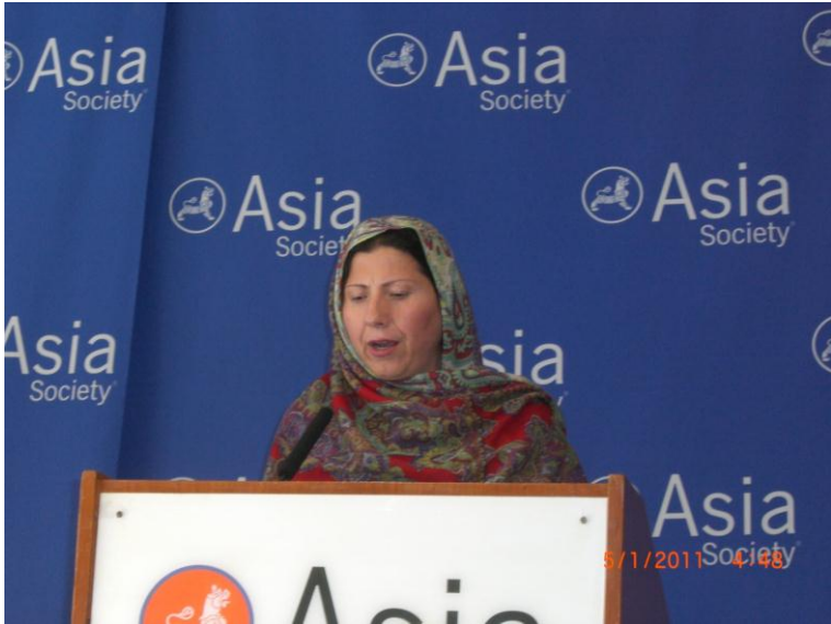
پہ نیو یارک کی غونڈی تہ د وینا پر وخت، حسینہ گل