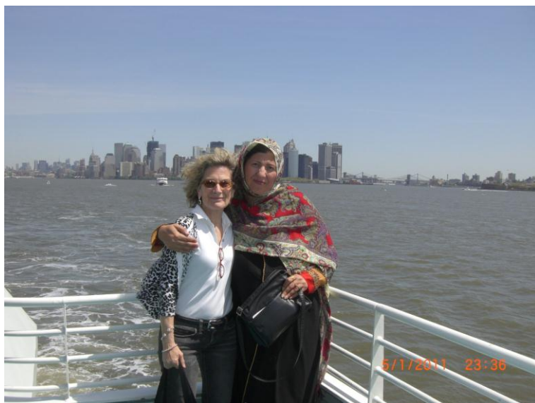
زه او پيني اوجيده