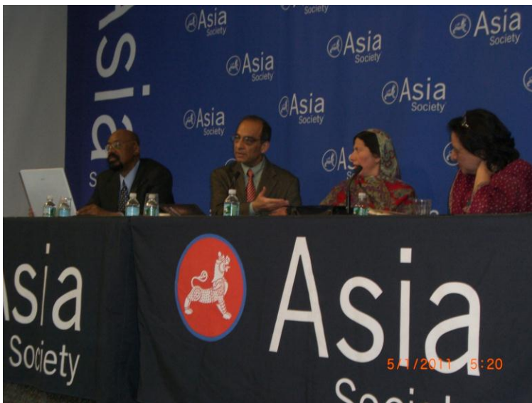
د ایشیاء سوسائیتی یو رابطه کار، وقاص خواجه حسینه گل او فهمیده ریاض