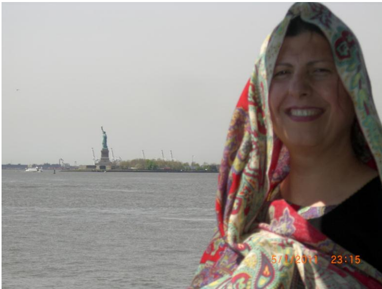
د سمندري هواگانو په ټيل نا ټيل کې