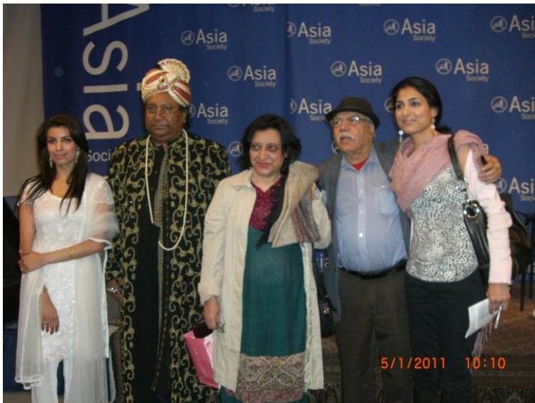
په نیو یارک کې د اردو ژبې له لیکوالو سره