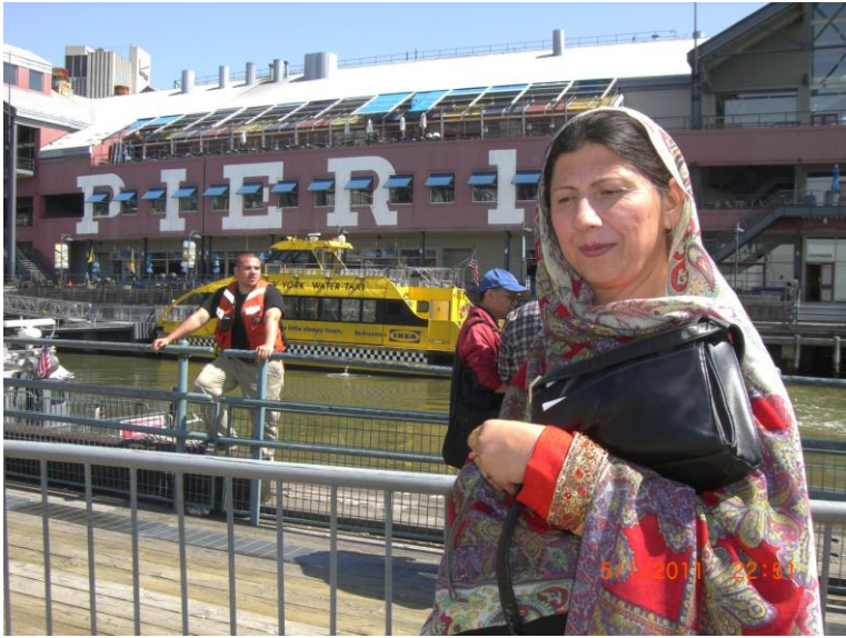
په کشتی کی د ناستی پر وخت یو عکس