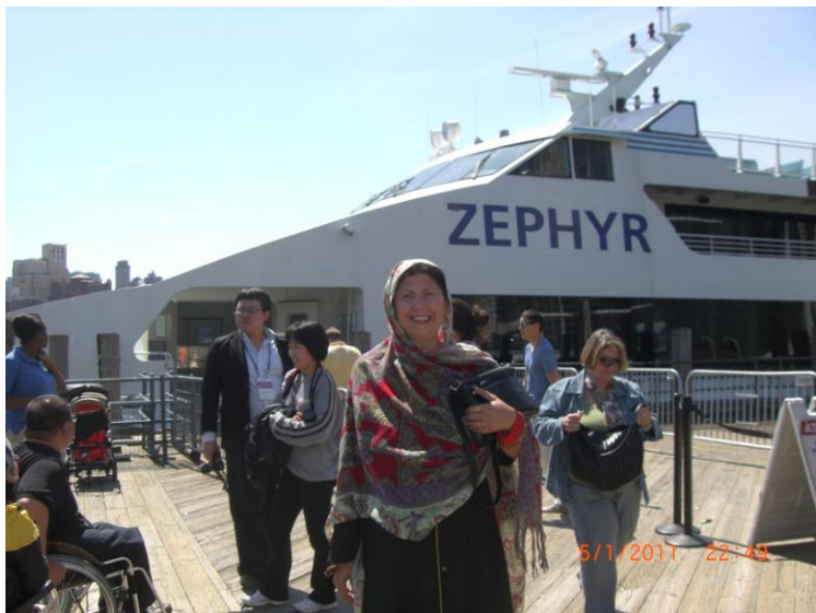
یو بل عکس