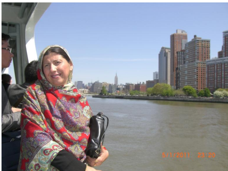
د سمندر چکر د بلی غاری سفر