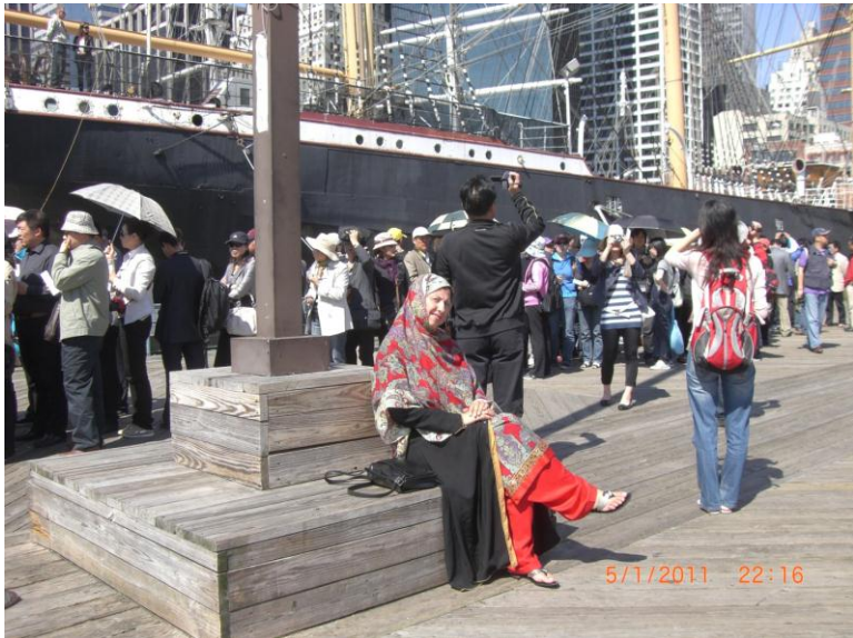
د نيو يارک د سمندر د غاړې يو بل عكس