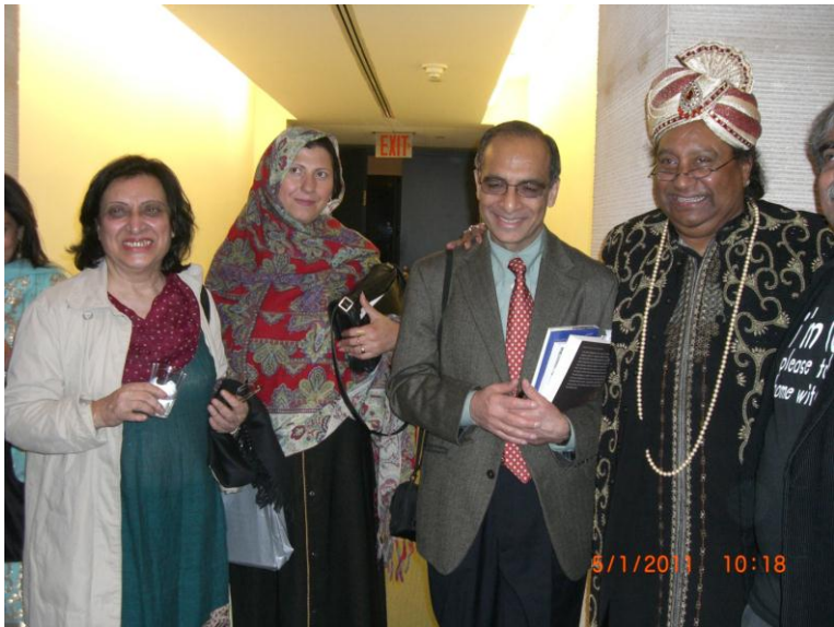
هم ددي وخت يو بل عكس