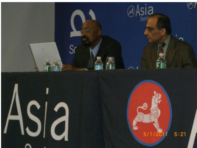
ددي دستوري يو بل عكس