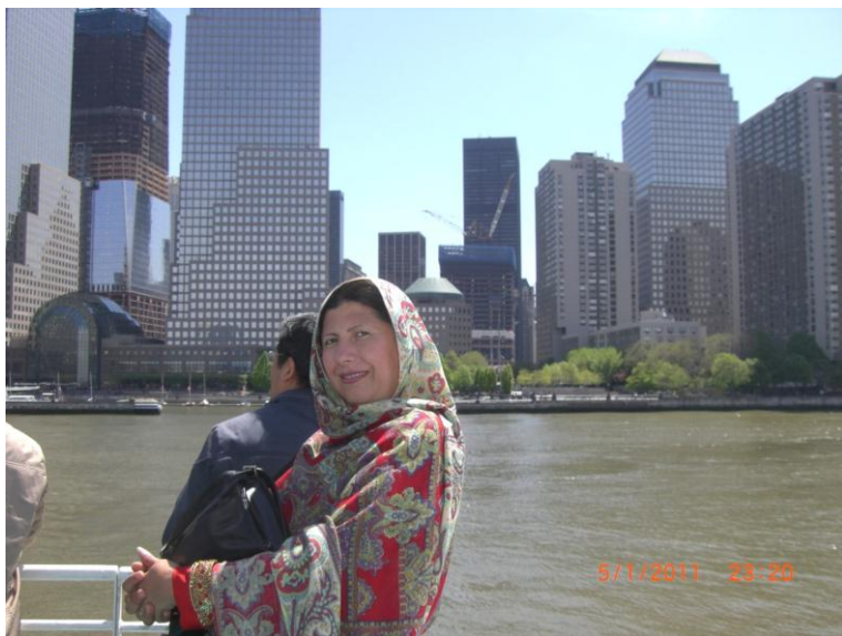
د بنار يو بل منظر د سمندر نه