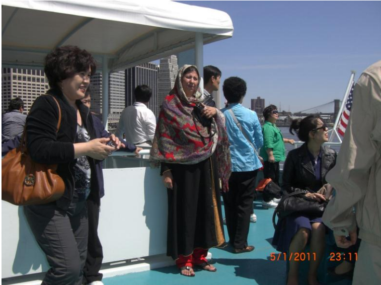
د نیویارک د ښار ننداره د کشتی د اخري منزل نه