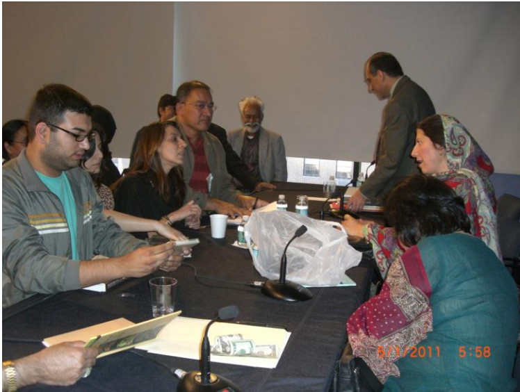
زما د ناول ملکه بی ارزي