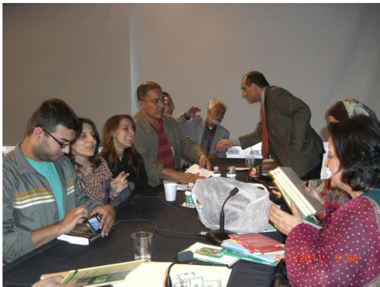
د فهمیده ریاض د کتابونو خرڅېدل