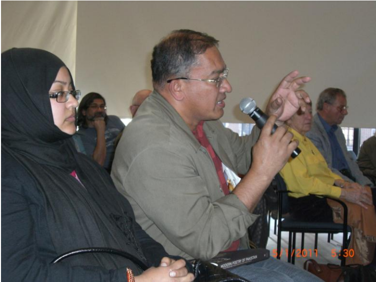
د پوښتنو او ځوابونو پر مهال