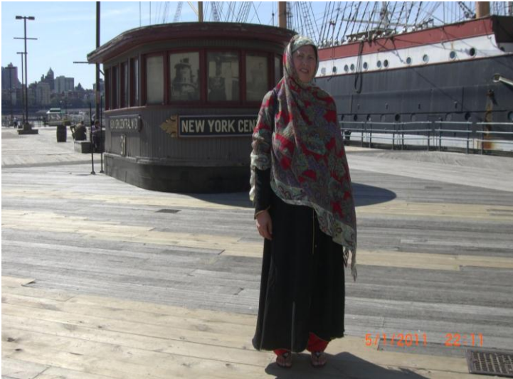
نيو يارک کي د سمندر د سيل پر مهال