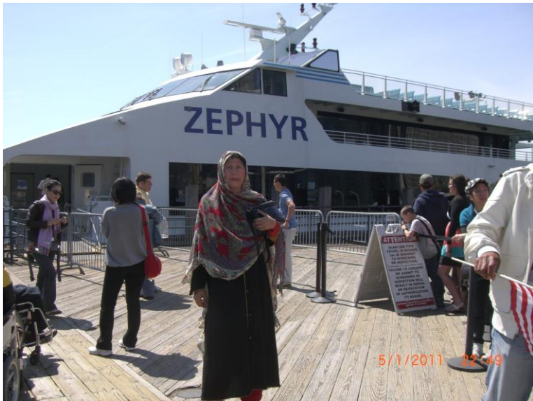
کشتی کی د کیناستو نه وړاندې