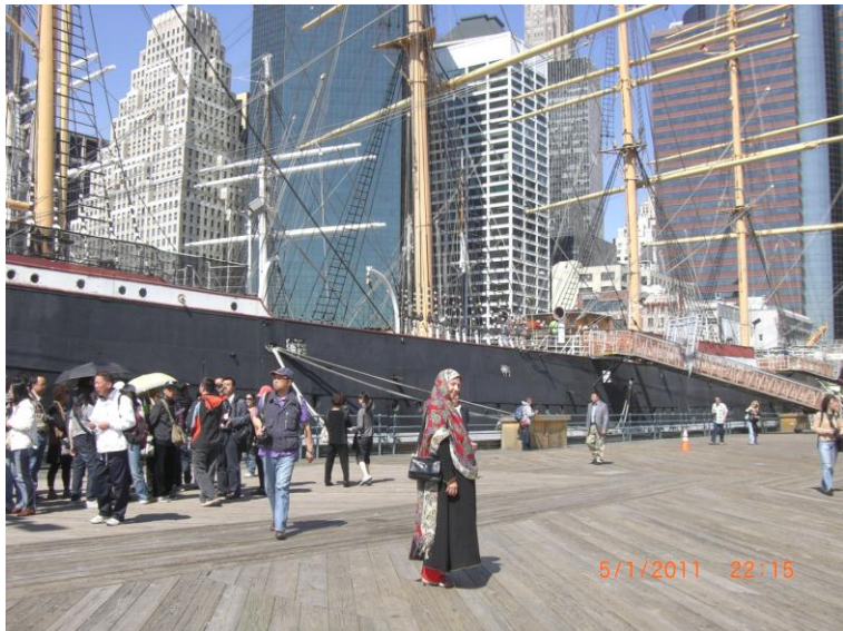
د سمندر د غاړې يو بل عكس