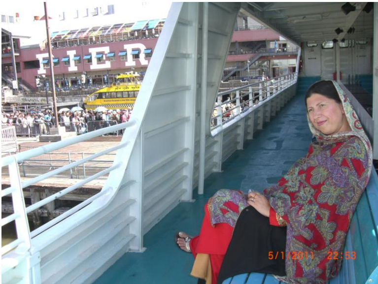
د کبنتی په اخري منزل کی د ناستی پر مهال