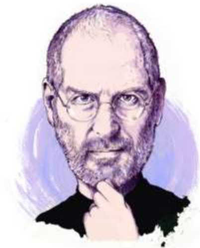
Steve Jobs 1955-2011

نن زه ډېر خوښ یم، چې تاسې د نړۍ په یوه غوره پوهنتون کې درس وایئ او نن مو د فراغت ورځ ده. زه له پوهنتون څخه نه یم فارغ شوی. نن غواړم تاسې ته د خپل ژوند کیسه وکړم، ډېره اوږده نه ده، یوازې درې کیسې دي.