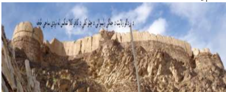
عکاس: محمديسيم رسا د اطلاعاتو او فرهنگ رياست د فرهنگي ميراثونو د ساتنې مدير

وټاکي، دا چې خلک ورته د کافر کلا نوم کاروي بنایي علت يې دا وي چې د اسلامي دين له را تگ څخه وړاندې ودانه شوې وي دا کافر کلا د يوې لويې نظامي اډې بڼه لري چې د لوړې او خطرناکې غونډې پر سر داسې قوي او لوی لوی دېوالونه راتاو شوي په نوموړو دېوالونو کې لوی لوی برجونه د نظامي پوستو په شان ودان شوي دي چې په ليدو يې خلک هېرانېږي.