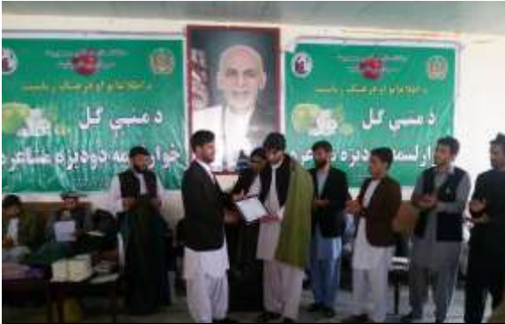
د ملي هدف اونيزي له آر شيف څخه ۱۳۹۴ لمريز کال

د منہي گل دوديزه کلنۍ مشاعرہ د وردگ فرهنگيانو د غوره کلتوري کړنو يوه بله مهمه لاسته راوړنه ده. د منہي گل مشاعرہ له نن څخه څوارلس کاله وړاندې د وردگود چک ولسوالۍ د