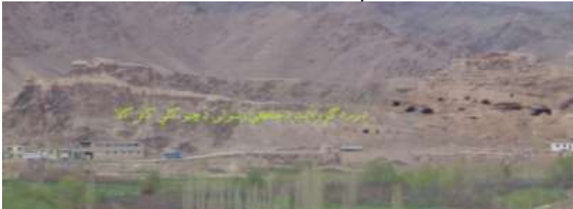
عکاس: محسنسیم رسا د اطلاعاتو او فرهنگ ریاست د فرهنگي میراثونو د ساتنتی مدیر

نوموړې کافر کلا د چتو په کلي کې موقعیت لري له دې امله یې خلک د چتو د کافر کلا په نوم یادوي دا لرغونې کلا د یوې اوږدې او لوړې غونډۍ په سر ودانه شوې ده، د دې کافر کلا جنوب لوري ته د جلگې ولسوالۍ عمومي سړک پروت دی په عمومي توګه د نوموړي کافر کلا درېیو اړخونو ته زرغونه سیمې او باغونه دي یوازې دا غونډۍ د لویدیځ لور ته له لوی غره سره تړلې ده.