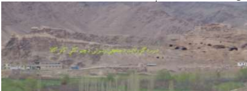
عکاس: محسنسیم رسا د اطلاعاتو او فرهنگ ریاست د فرهنگي میراثونو د ساتنې مدیر

نوموړې کافر کلا د چتو په کلي کې موقعیت لري له دې امله یې خلک د چتو د کافر کلا په نوم یادوي دا لرغونې کلا د یوې اوږدې او لوړې غونډۍ په سر ودانه شوې ده، د دې کافر کلا جنوب لوري ته د جلگې ولسوالۍ عمومي سړک پروت دی په عمومي توګه د نوموړي کافر کلا درېیو اړخونو ته زرغونه سیمې او باغونه دي یوازې دا غونډۍ د لویدیځ لور ته له لوی غره سره تړلې ده.