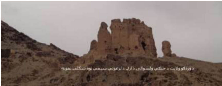
د وردگو ولايت د جلگې ولسوالۍ د ارگ د لرغونې ښارگوټي يوه ښکلې لويه