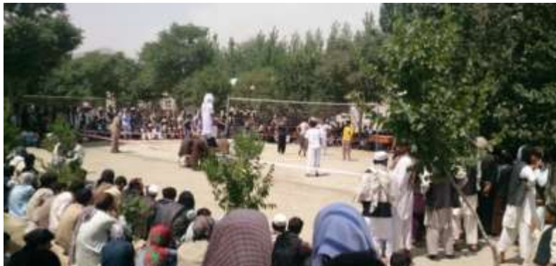
په وردگو کې د والیبال یو انځور

د دواړو ستونو تر منځ یو جال تړي د جال لور والی او ټیټوالی د دوی په خپل لاس کې دې خو د دوو مترو نه یې په پورته هوا کې تړي جال او سپینیز نه وي او د نرمو تارونو څخه جوړیږي.