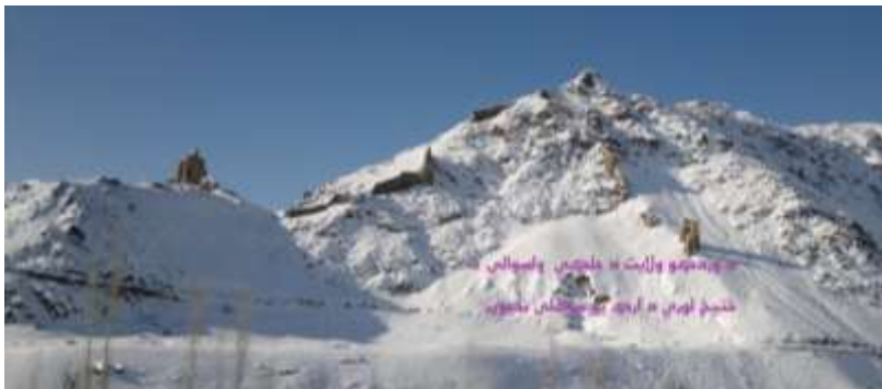
د وردگو ولايت د جلگې ولسوالۍ د کنج لويې د ارگ د ښارگوټي لويه

دا لرغونې ښارگوټي د وردگو ولايت د جلگې ولسوالۍ د کنج د کلي په ساحه کې د عمومي سرک په سر پورت د دې لرغوني ښارگوټي ختيځ ته د موکې کلي، لوېديځ ته يې داډا خېلو کلي، شمال ته يې د لوی غر او دښته او جنوب ته يې د کنج کلي پروت دی.