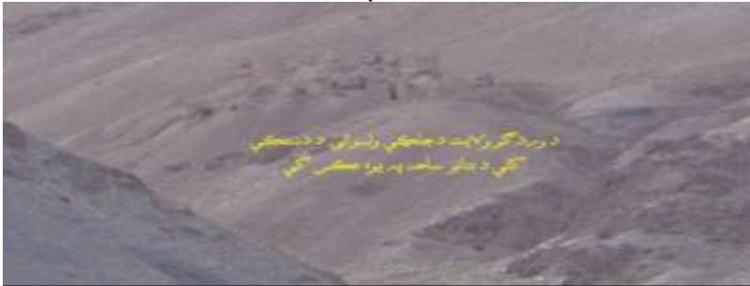
عکاس: محمد نسیم رسا د اطلاعاتو او فرهنگ ریاست د فرهنگي میراثونو د ساتنې مېرمن

نوموړې بۇتان د وردگو ولایت د جلگې ولسوالۍ د دښتکې په کلي کې د عمومي سرک ښي لور ته په ۱۰۰ مترې کې موقعیت لري، د دښتکې بۇتان له ډبرو لرغونو آثارو له ډلې څخه دي او په ځمکه کې تقریباً ۴۰ متر ژور جوړ شوي دي نوموړي بۇتان په ډبر ښکلي ډیزاین او لوړ مهارت سره جوړ شوي د دغو بۇتانو زینې له ډبرو نریو او هوارو ډبرو څخه په پاخه او اساسي توگه جوړې شوي دي په دغه سیمه کې دوه بۇتان جوړ شوي چې یو ته یې لوی او بل ته کوچنی بۇت وايي دغو بۇتانو ته اوس نږدې کورونه هم جوړ شوي دي.