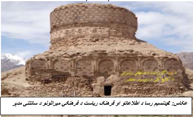
عکاس: محمد نسيم رسا د اطلاعاتو او فرهنگ رياست د فرهنگي ميراثونو د ساتتنې مډېر