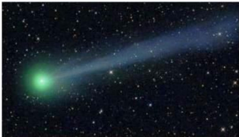
« وَالنَّجْمِ إِذَا هَوَىٰ * مَا ضَلَّ صَاحِبُكُمْ وَمَا غَوَىٰ . » (النجم، ۵۳ / ۱ - ۲)