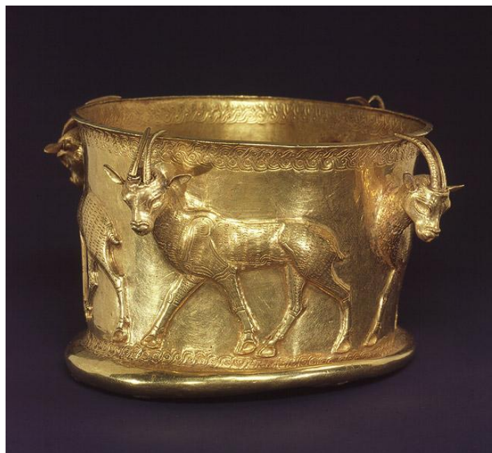
«قدحی زرین مربوط به مارلیک»