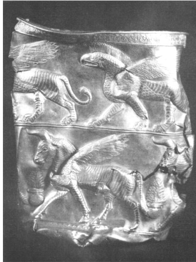
یکی از جام‌های طلایی تقلبی منسوب به چراغعلی‌تپه (با نام ساختگی مارلیک)، رودبار گیلان

دروغین و تاریخ‌سازان و نشریاتی که واقعیت‌ها را فدای جلب توجه مخاطب می‌کنند، می‌سازند و می‌پرورند.