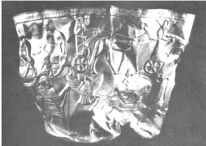
جام طلائی تقلبی منسوب به تپه حسنلو، نقده

نگارنده بر این گمان است که دست مرموزی پشت چنین اخباری خوابیده است. دستی که همچون دست «دوست‌نما» و سفیدشده گرگ در فکر حمله به فرهنگ و تمدن کشوری است که همچون بره‌ای بینوا از مادر به دور افتاده است. و همچنین دست‌های فروشندگان آثار عتیقه قلابی که سعی می‌کنند با همراه کردن عکس اشیای موردنظر خود در دل اینگونه اخبار، بازار بهتری برای خود دست و پا کنند.