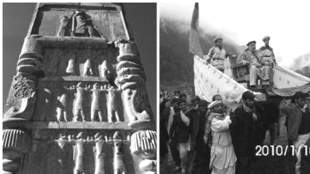
تخت روان والی ولایت نورستان (ننگرهار) در افغانستان بر دوش مردم، روایتی زنده از سنگ‌نگاره‌های هخامنشی تخت جمشید

ظلم و بهره‌کشی از مردم حتی در ظاهر خود نیز تغییری نکرده است. شباهت‌ها بسا در جزئیات حیرت‌انگیزند، چنانکه ظلم در طول تاریخ تفاوت چندانی نکرده است. کلاه، لباس و فرش‌هایی که حاکمان زیر خود انداخته‌اند، و کلاه، دستار و دامن مردمی که در هر دو تصویر حامل تخت هستند.