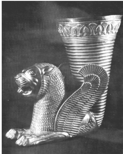
ساغر/ ریتون قلبی منسوب به خشیارشا و عصر هخامنشی (آرم فعلی بانک پاسارگاد)

مفیدی برای خود تبدیل کنند. گسترش چنین شیوه‌ای می‌تواند به مرور زمان آسیب‌هایی جدی به آیین و فرهنگ ایرانی وارد کند.