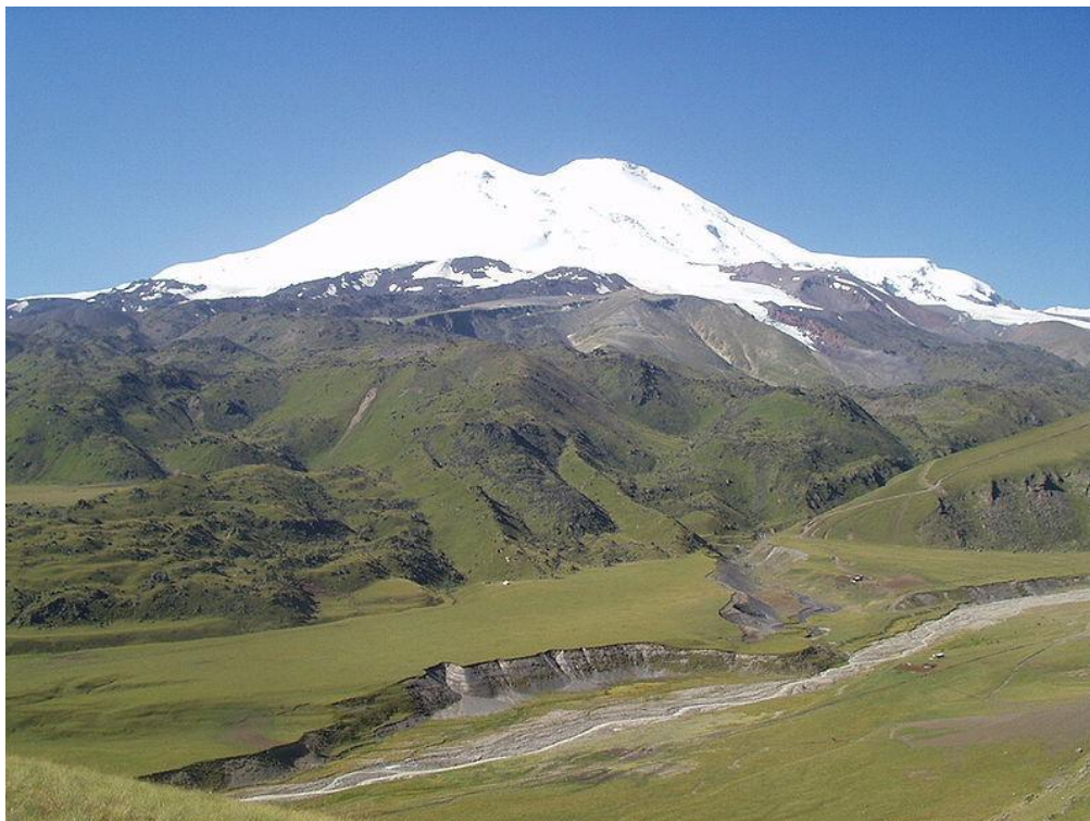
تصویر ۵. کوه البروس