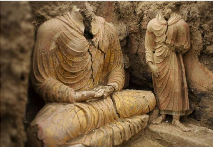
د افغانستان په لوگر ولایت کې د مس عینک په کیندنې کې موندل شوي د بده لرغونې خاورینې مجسمې