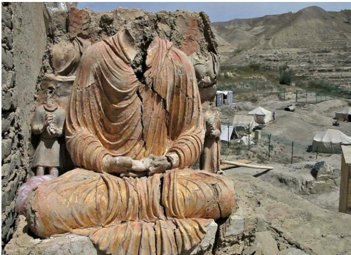
د افغانستان په لوگر ولایت کې د مس عینک په کیندنې کې موندل شوي د بده لرغونې خاورینه مجسمه