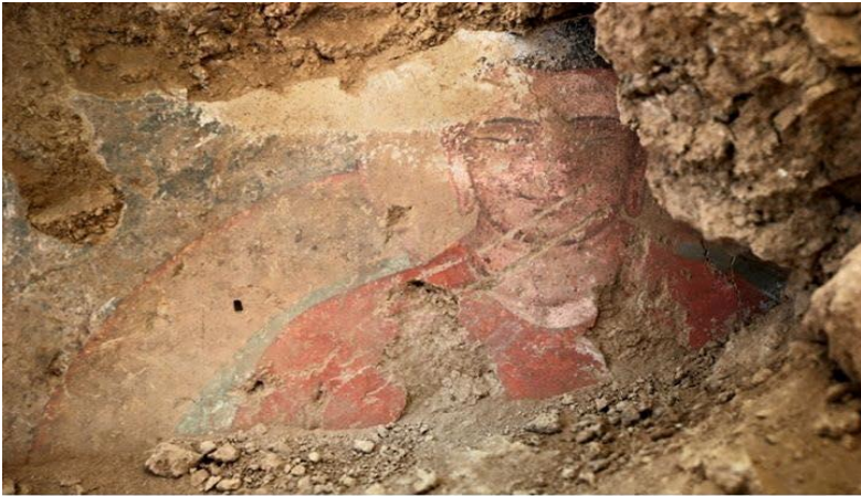
په افغانستان کې موندل شوی یو رنگین بودهي عکس