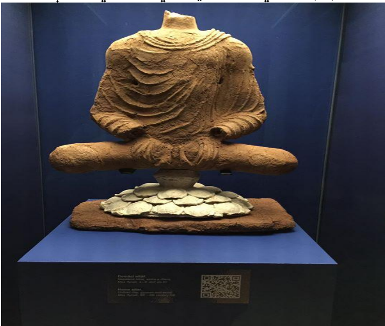
په کابل میوزیم کې پروت په لوګر کېني موندل شوي بودهي مجسمه