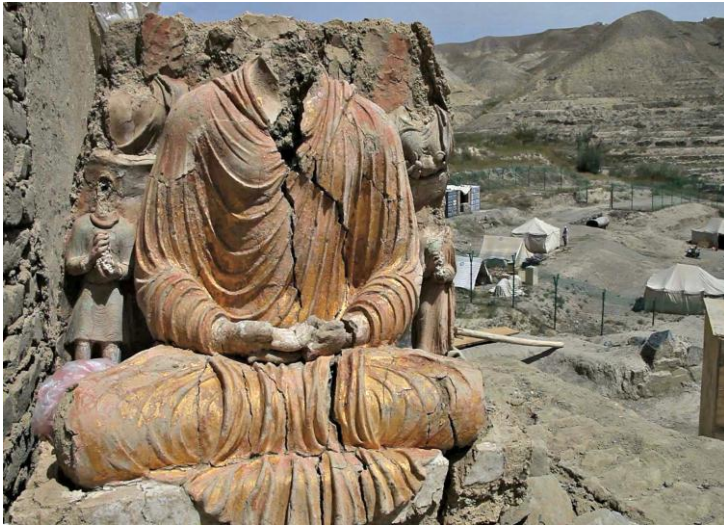
د افغانستان په لوگر ولایت کې د مس عینک په کیندنې کې موندل شوي د بده لرغونې خاورینه مجسمه