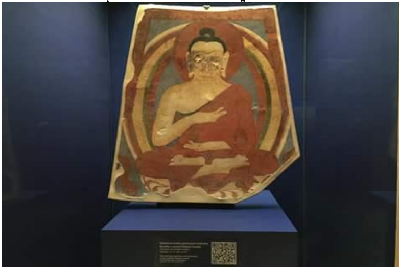
په کابل میوزیم کې پروت په لوگر کې موندل شوی رنگین بودهي عکس