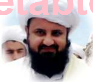
فیسبوک غلام حضرت غلام