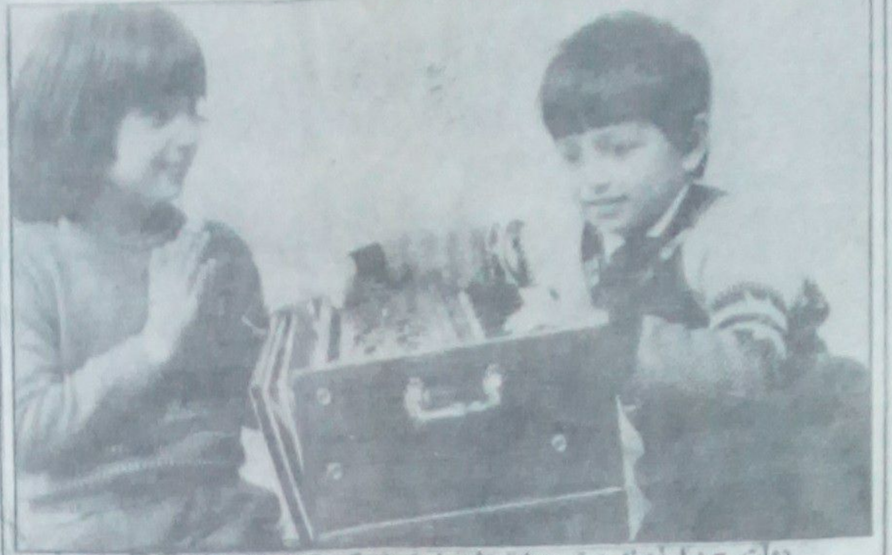
دولت چ.دا زمینه پیشرو برای رشد استفاده کرد کلمه میا ساخته است. دو عکس: اطفال کودکان وزیر اعلی خان عکاسی بابا خان

(گستره مهر) نام فلمی است پیرامون ن صلا منته منی که از سوی اداره فلسفای هنری و مستند تهیه گردیده و شام ۵ حوت از طریق تلویزیون نمایش گردید. این فلم که تقریبا از مقطع آغاز میشود و پیشتر پین پیشی آن بر فلش یک حساس (رجست بگفتند) استوار است. یک روال نا ظفی و انگیزنده دارد که همه فلم در محور قرار دادن شخصیت مرکزی فلم هویت میباید. با آنکه پیا م فلم در رابطه با امر مصالحه از زشتی های فراوانی دارد و لسی بر جودیت کا سنی های در فلم گستره مهر را اند کسی