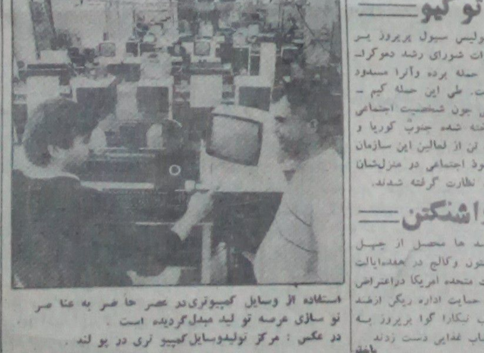
استفاده از وسایل کمپیوتری در عصر حاضر به عا صر نو سازی عرصه تولید میسازد گردیده است. دو عکس: مرکز تولید وسایل کمپیوتری در پو لنه.

سد ها محصل از جبل بوستون و کالج در عده ایالات متحده امریکا در اعتراض علیه حمایت اداره ریگر از ضد انقلاب نیکاراگوا پیروز به انحصار نمایین دست زدند.