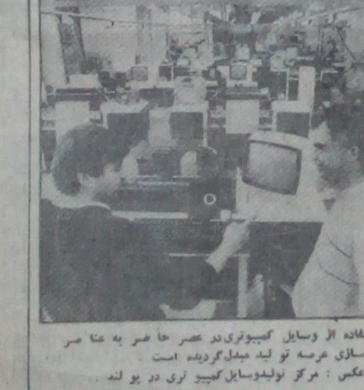
استفاده از وسایل کمپیوتری در عصر حاضر به عا صر نو سازی عرصه تولید میباید گردیده است.

متحده امریکا موسوم به عول- قب کشتار دسته جسی برای صلح بین المللی به نشر رسیده پاکستان تمام رسایل و تجهیزات لازم را جهت تولید اسلحه ذروی قلا آماده کرده است. از طرف یک سازمان ایالات