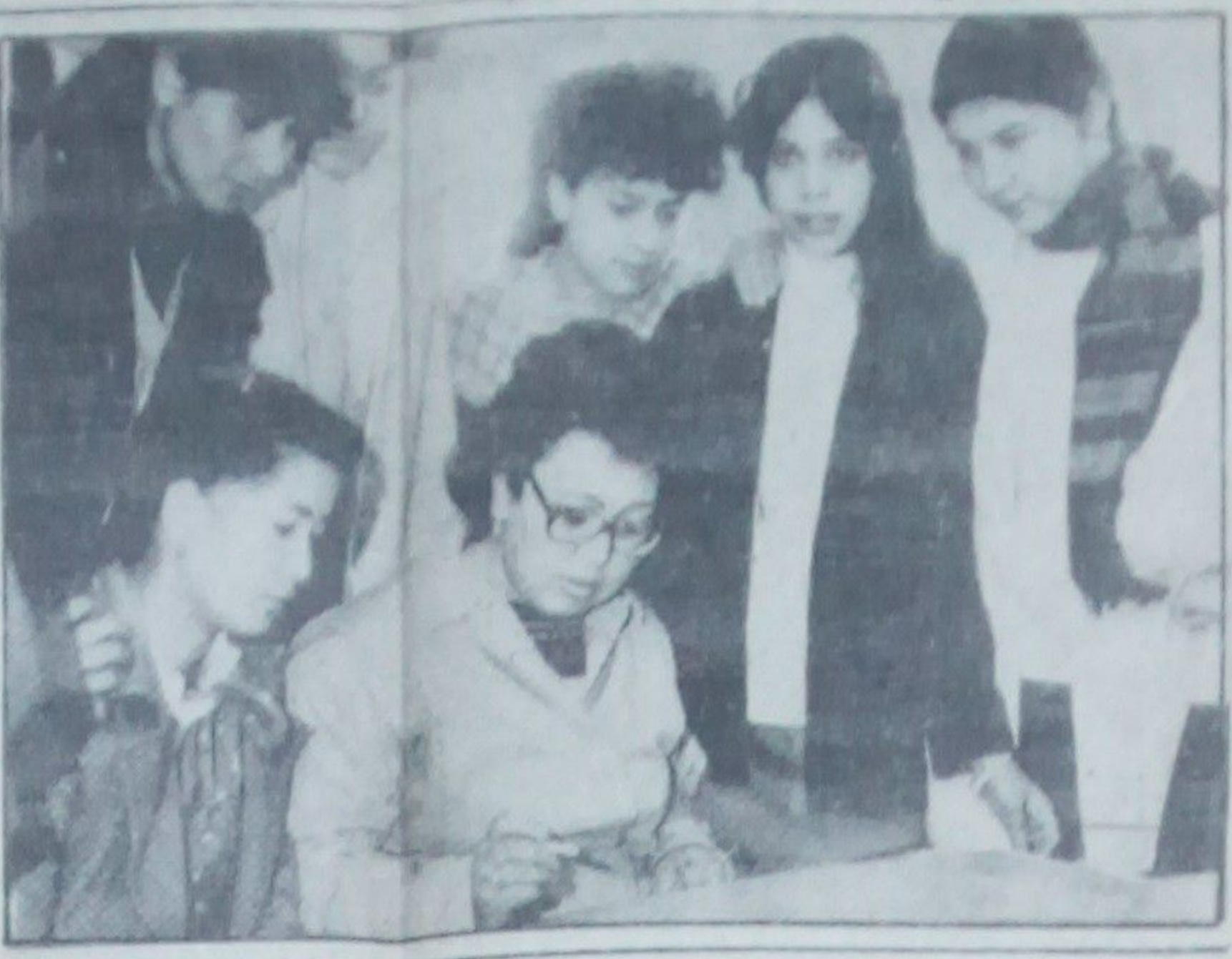
دو ډوليزه مخارتونه د ديموكراتي... ديموكراتي... ديموكراتي...