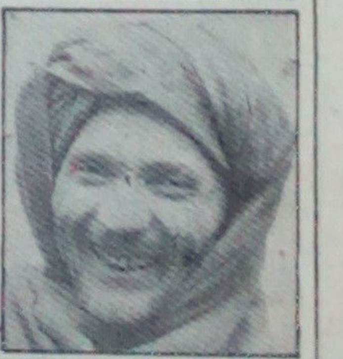
من حالا میدانم که دوری از وطن و خانه چقدر دردناک و روح آرد است. زنده گسی کردن در آفرین و وطن بهتر از زندگی کرد ندر خانک بیگانه است. این جیلان از زبان محمد علی سکرته - ولای از آن جایگه در ایران قیمت مراد اولیه خیلی بلند

مقامات ایرانی در دست بازگشت مومنانها به کشور شان مناسبت می نمایند. چنانچه خود شاهد برگشت پنجاه نفر از کابل که شامل زنان واطفال بودند. همتم که از طرف پاسداران ایرانی در راه عودت آنها به وطن شان مساعدت ایجاد گردید. و آنها را دوباره با اردوگاه ها بردند. صلح که آرزو و خواست هموطنان ما است اعلام گردید و است و دولت با کسانیکه می آیند کمک های زیادی نموده و مساعدت