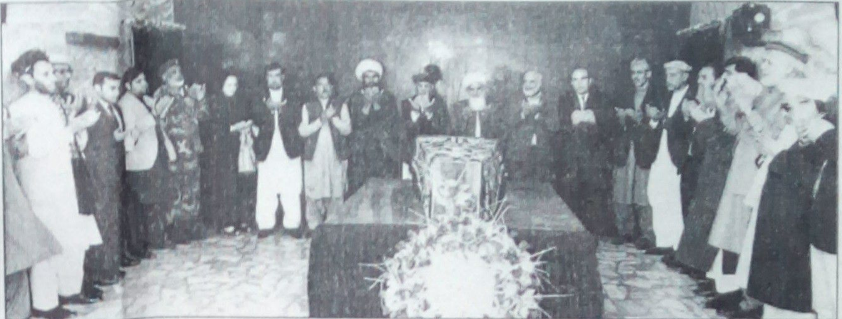
جمهوررييس غني په شهيد محمد وکیل هېواد او خلکو ته د خدمت او صداقت ژمنه لرله. هغه د اخلاقو مړينې، د خواشينۍ څرگندولو پرمهال د مرحوم ډاکټر عبدالولي

د افغانستان د اسلامي جمهوريت جمهوررييس محمد اشرف غني پرون وکیل جنازې ته درناوی وکړ. مرستيال مرحوم ډاکټر عبدالولي وکیل جنازې ته درناوی وکړ. پرمهال وویل، ډاکټر عبدالولي نمونه و او هېچا هم نونده خبره ترې واله ورېده. جمهوررييس د هغه پر خلکو له نسلت ووايه. ورپسې د مرحوم ډاکټر عبدالولي وکیل د کورنۍ په استازيتوب جنرال علي شاه احمدزي او حکم خان حبيبي د خبرو پرمهال د جمهوررييس غني له غمگينۍ او ډاکټرېښې څخه په مننې وویل، مرحوم ډاکټر عبدالولي وکیل يوازې د لوگر نه، بلکې د ټول افغانستان خدمتگار او ځوان کدر وو. وروسته جمهوررييس غني تر ټاکلي ځای پورې د مرحوم ډاکټر عبدالولي وکیل د جنازې د لېږد مراسمو کې چې د تشرېفاتو قلمبې منسوبينو په خپلو اوږو لېږدوله، ملتيا وکړه.