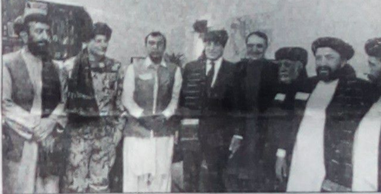
خليل وایي چې خلیلزاد د لوی کندهار له مشرانو سره نه، بلکې د

د افغان سولې لپاره د امريکا ځانگړی استازی زلمی خلیلزاد وږمه ورځ سې شنبه کندهار ته لاړ. خلیلزاد په کندهار کې د لوی کندهار کندهار، هلمند، زابل، ارزگان، له فومي مشرانو او ولسي استازو سره وليدل. ښاغلي خلیلزاد د لوی کندهار مشرانو ته د قطر په دوحه کې له طالبانو سره د خپلو خبرو او په هغو کې د شوي پرمختگ په اړه معلومات وړاندې کړل خو د چارو کټوتکي خوشال