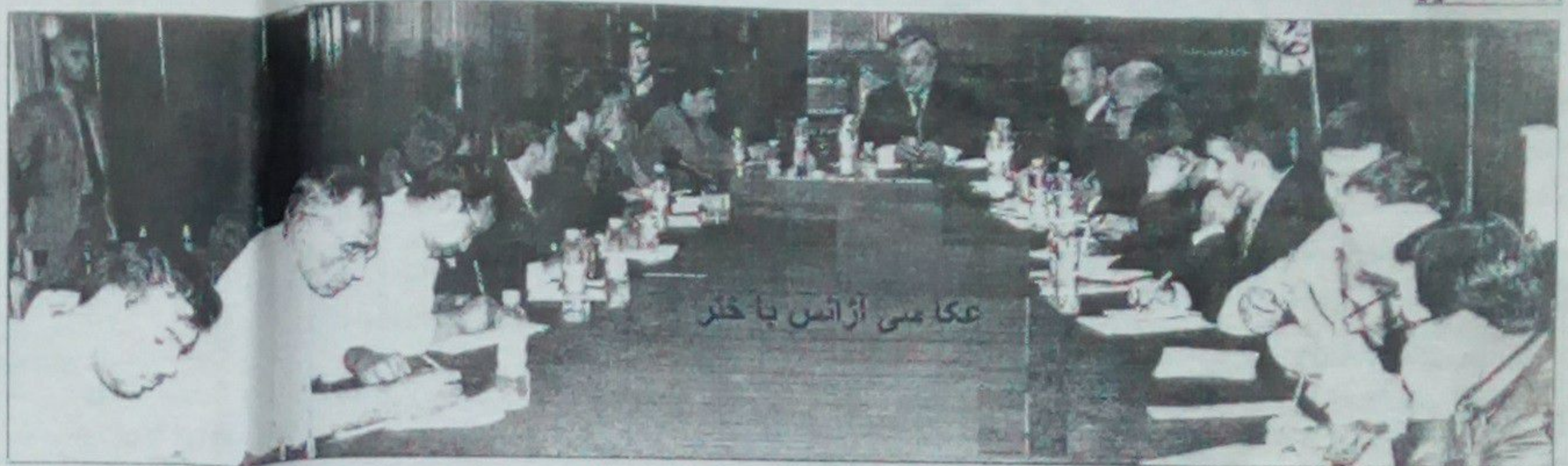
عکاسی از آشنایان با خنجر