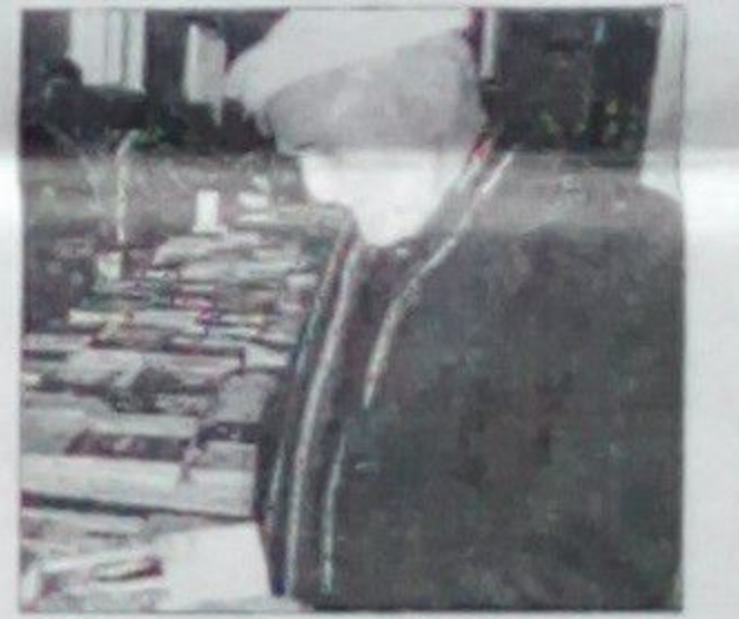
سمع الله تاره

در اين نمايشگاه تعداد زيادى از ناشران خصوصى غرقه ها را ايجاد نموده و كتابهاي را كه چاپ كرده اند در معرض نمايش گذاشته اند تا مردم از اين كتابها