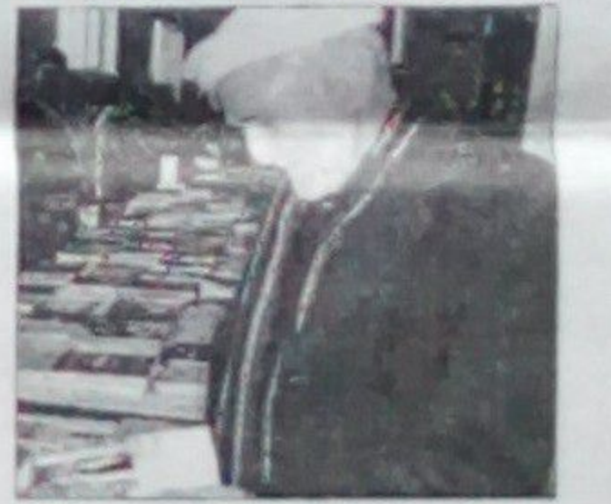
سمع الله تاره

در این نمایشگاه تعداد زیادی از ناشران خصوصی غرفه ها را ایجاد نموده و کتابهایی را که چاپ کرده اند در معرض نمایش گذاشته اند تا مردم از این کتابها