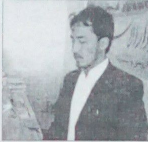
منور شاه شيراز

طرح هاي مختلف و چاپ عالي مي باشد كه حنا بعضى از اين نسخه هاي فرآكريم چاپي در كابل پيدا نمى شود، انتشارات دارالاسلام مطبوعه نيز دارد كه زياد تر در بخش