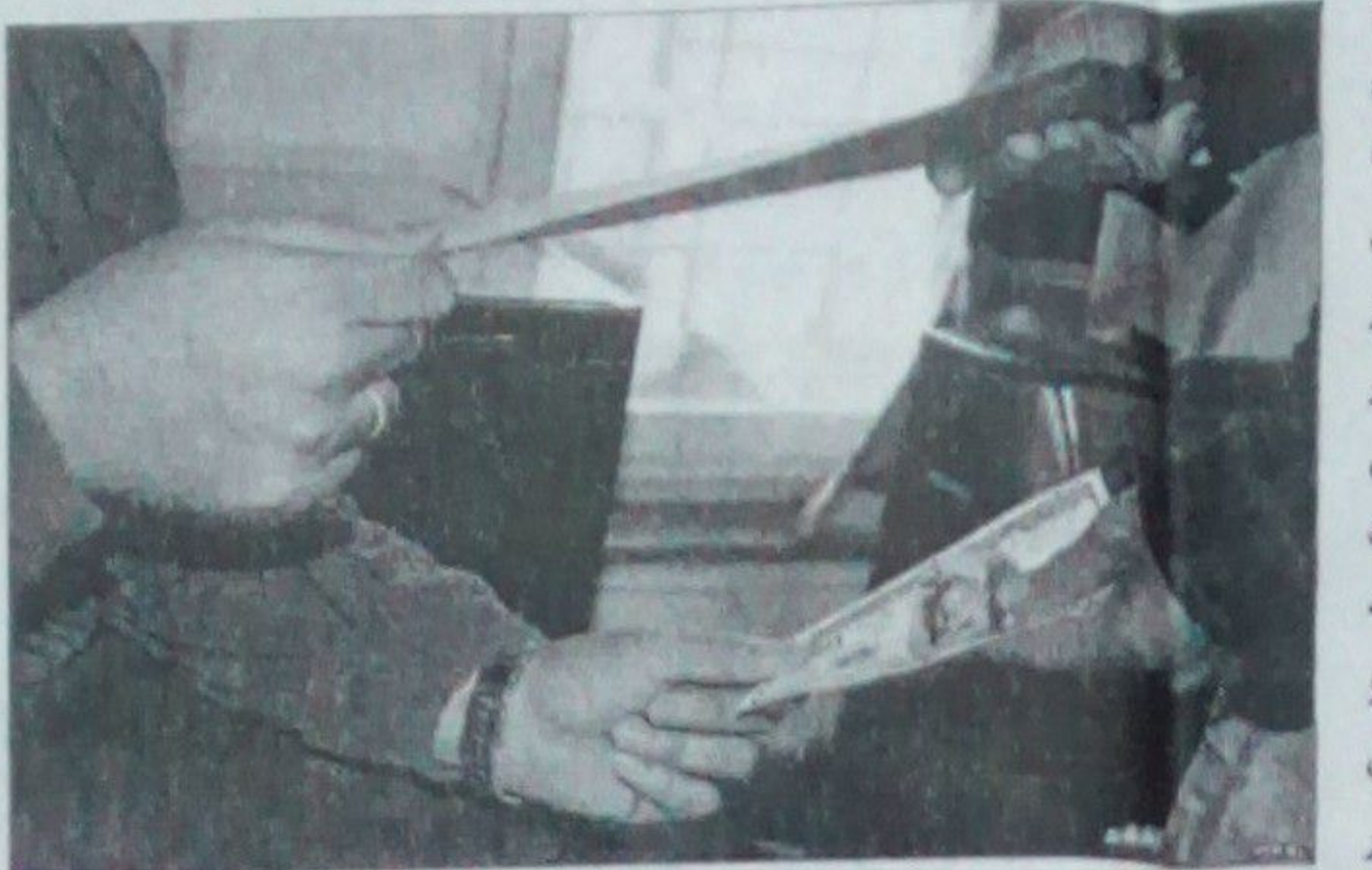
کامېون لپاره او غړي تيار دي، په هر حال د دې مبارزې په يوازې بايد، چې ستاينه وشي. بلکې د اداري فساد پر ضد د دې پراخه مبارزې څرکه هم بايد وشي. له نېکه مرغه د ولسمشر نه خوا د اداري فساد د مبارزې ستاينه په نېواکه کچه شوې او گڼو پيښوالو ادارو د دغه کام پلان او هر کلې کړې، خو اړتيا دا ده، چې د دې مبارزې څارنه هم وشي او کله

افغان ولسمشر د اداري فساد پر ضد مبارزه نه يوازې، چې خپل ستر لوبښوونکي بللي، بلکې دا مبارزه يې ډېره گرځېدې، چې هم ده، ولسمشر د کابل بانک د فضې د څارنې تر څنگ د دولتي ادارو او په تېره بيا د وړاندوونو ټول افرادادونو تر خپلې زورې څارنې لاندې نيولي او يوازې يې د ملي دفاع د وزارت د څو افرادادونو په اړونه کې نه بلکې د نورو ډالرو سپما کړې او ملي بودجې ته يې اچولي دي. دا د ولسمشر تر ټولو مهم او ستر کامونه بلل کېږي، ولسمشر د ټولو ټولنو د ارزونې چارې په خپل لاس کې اخیستې، او هر هره اوونۍ د تدارکونو په ملي کمېټون کې د ده په مشرۍ غوښه جوړېږي او د گڼو وړاندوونو او ادارو د ټولنو څرگتوالی تر ارزونې لاندې نيول کېږي، که هر تړون د ملي گټو پر خلاف وي او يا په کې فساد وي، نو فوراً يې مخنيوی کوي. څه موده وړاندې د کلي او بنا جوړولو وزارت کس ريسان د اداري فساد له امله ممنوع الخروج اعلام شول او د تېبې مخنيوی يې هم وشو. ډېر داسې استدلال کوي، چې گڼې دا کسان دي، چې په ډاگه شوي هم دي نو د گڼو په فساد کې ورېښکولو کسانو نومونه د