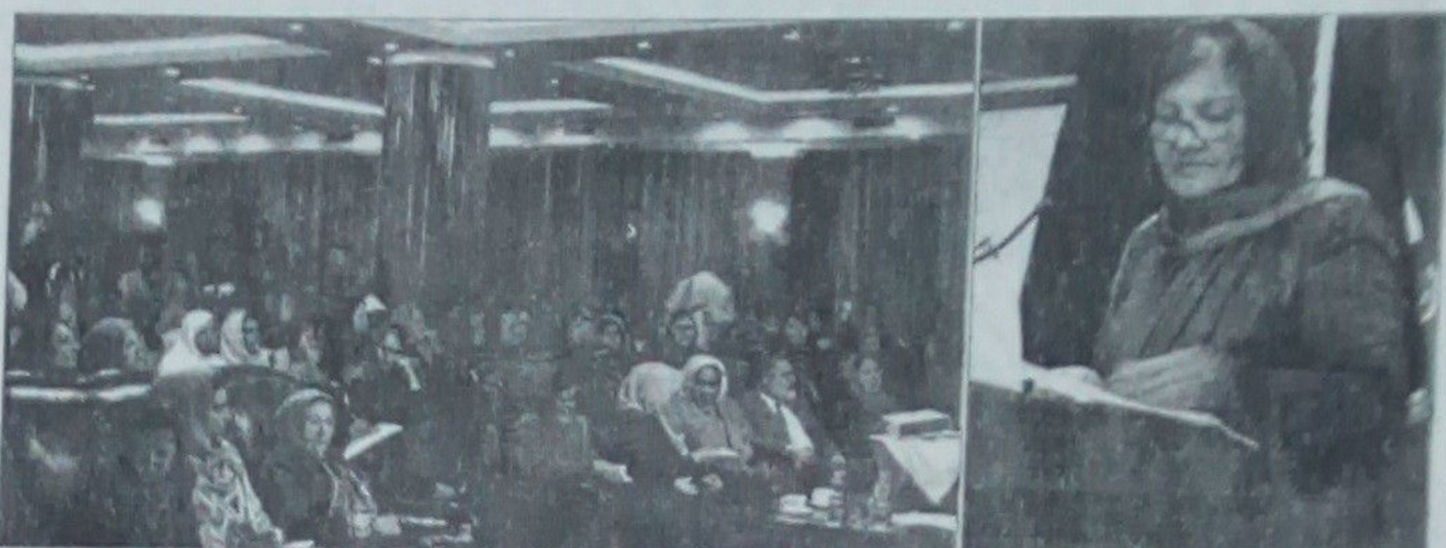
امور، کمیسیون های امور زنان، مشاوران جرگه، ولسی جرگه و مسولین عالی رتبه وزارت خانه ها و روسا و مدیران حقوق ریاست های امور زنان و ولایات کشور اشتراک ورزیده بودند.

وزارت امور زنان به افتخار روز مادر کنفرانس علمی را تحت عنوان «زنان، ایثار، صلح و اعتماد سازی» برگزار کرد. حضور سال روان در هفتاد کابل ستار تدویر نمود در این کنفرانس هیئت رهبری وزارت امور زنان، اعضای ریاست عمومی اداره امور اجتماعی و سیاسی سهم فعال داشته و اراده ما ایست که این سهم گیری افزایش یابد. به تعقیب دبیر نظری وزیر امور زنان با ابراز مراتب تبریکی و تهنیت به مناسبت روز مادر و توضیح جایگاه اساسی و قانون مدنی زنان افغان در امور اجتماعی و سیاسی سهم فعال داشته و اراده ما ایست که این سهم گیری افزایش یابد. به تعقیب دبیر نظری وزیر امور زنان با ابراز مراتب تبریکی و تهنیت به مناسبت روز مادر و توضیح جایگاه اساسی و قانون مدنی زنان افغان در امور اجتماعی و سیاسی سهم فعال داشته و اراده ما ایست که این سهم گیری افزایش یابد.