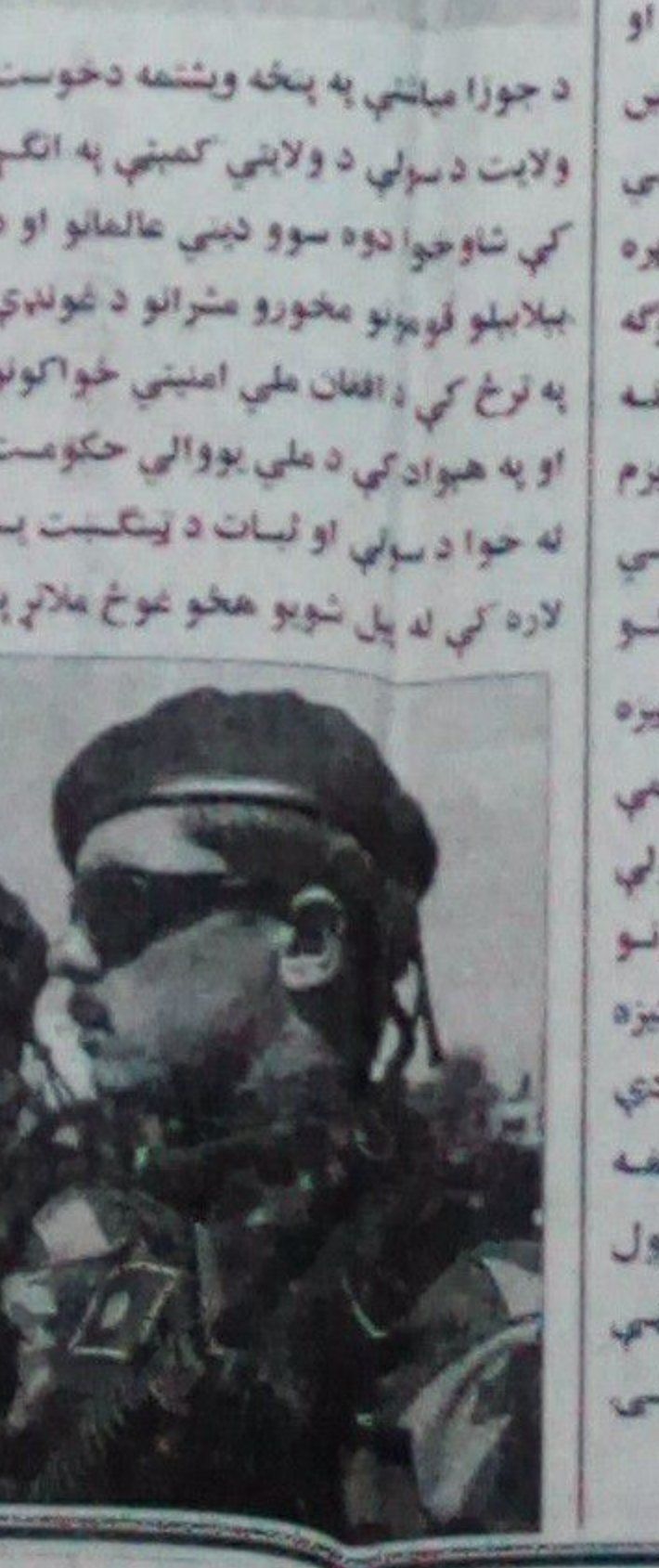
د خوست ديني عالمانو او مخورو له کورنيو ځواکونو ملاتړ اعلان کړ

د جورا مياشتې په پنځه ويشتمه دخوست ولايت د سولې د ولايتي کمېټې په انگر کې شاورچا دوه سوو ديني عالمانو او د بېلابېلو ټولنو مخورو مشرانو د غونډې په ترڅ کې د افغان ملي امنيتي ځواکونو او په هېواد کې د ملي يووالي حکومت له خوا د سولې او ليات د ټينگت په لاره کې له پل شويو هڅو ملاتړ په