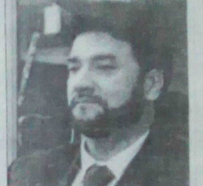
پر ښاغلي اغیر تور لگېدلی چې ګواکې نړیوالو سیالیو ته د لوبغاړو د استولو په برخه کې د مور او مېرې چلند کوي

د افغانستان د اولمپیک کمیټې مشر د یو شمېر لوبغاړو د سرټکونو او د کلني پرمختیایي بودجې د نه لگولو له کبله ولسي جرگې ته غوښتل شوی و. پر ظاهر اغیر داسې توروڼه ورپیلې و پر ښاغلي اغیر دا تور هم لگېدلی چې ګواکې نړیوالو سیالیو ته د لوبغاړو د استولو په برخه کې د مور او مېرې چلند کوي. د افغانستان د اولمپیک کمیټې مشر ظاهر اغیر په ده لگېدلي توروڼه بې بنسټه وبلل او بې بي سي ته یې وویل چې د لوبغاړو د نیولو پر اړه مخامخ نه هڅو سره غږېدلی دی د افغانستان د اولمپیک ملي بنسټ مخکې له دې هم له لوبغاړو سره په دوه مخي چلند توروڼ شوی و همدا راز د اداري درغیلو او د فدراسیونونو د مشرانو د ټاکلو په برخو کې له نیوکو سره مخامخ و او یو ځل حوډا ۳۱ سلنې پرمختیایي بودجې پر لگولو توانېدلی دی. د اولمپیک د ملي کمیټې مشر دا توروڼه رد کړې دي د ولسي جرگې د روغتیا او بدني روزنې