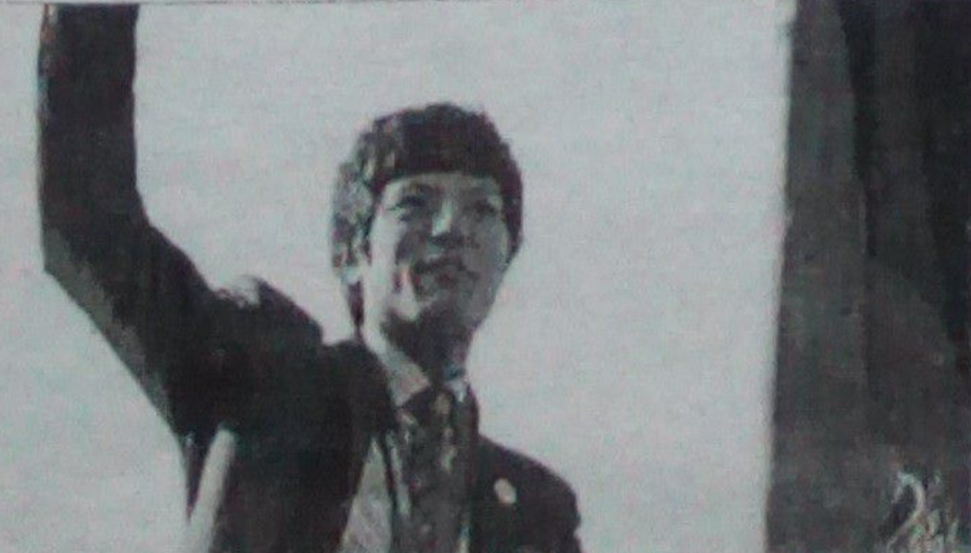
یو نر ستونزې پیدا شوي و او زما روزونکو له نهم راټولو لاس اخیستي و روح الله نیکیا

منفي اغیر کړي و، چې نهم وکړو او د سیالیو لپاره چمتووالي ونیسو. هغه هم نیم چې نه د کوم ځای یې او زده کوم ځای یې، یوې خوا ته پېرېدو او ملي فدراسیون ته ملي فکر وکړو" روح الله نیکیا خبرداری وړ کوي، که د تګونو په فدراسیون کې حالت په همنښه ډول روان وي، نو بیا به هېڅ رسمي سیالیو کې برخه و نخلي خو د افغانستان د المپیک ملي کمیټې ویاند محیب الله رحمانی په دغو فدراسیونو کې ستونزې نه مني او وايي چې روح الله نیکیا د شخصي ستونزو له امله د مکسیکو په سیالیو کې نه برخې اخیستو ډډه کړې "روح الله نیکیا په