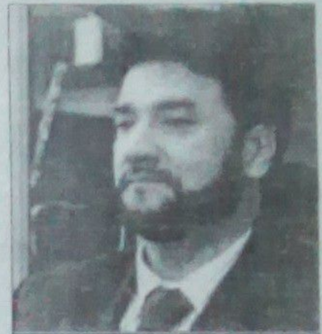
پر ښاغلي اغیر تور لگېدلی چې ګواکې نړیوالو سیالیو ته د لوبغاړو د استولو په برخه کې د مور او مېرې چلند کوي

د افغانستان د اولمپیک کمیټې مشر د یو شمېر لوبغاړو د سرټولنو او د کلني پرمختیایي بودجې نه ده لگولو له کبله ولسي جرگې ته غوښتل شوی و. پر ظاهر اغیر داسې توروته ورپللی و پر ښاغلي اغیر دا تور هم لگېدلی چې ګواکې نړیوالو سیالیو ته د لوبغاړو د استولو په برخه کې د مور او مېرې چلند کوي. د افغانستان د اولمپیک کمیټې مشر ظاهر اغیر په ده لگېدلي توروته ښې نښتې وپل او بي بي سي ته يې وویل چې د لوبغاړو د ښوونو پر اړه مخامخ نه هڅو سره غږېدلی دی د افغانستان د اولمپیک ملي بنسټ مخکې له دې هم له لوبغاړو سره په دوه مخي چلند توروته شوی و همدا راز د اداري درغیلو او د فدراسیونونو د مشرانو د ټاکلو په برخو کې له نیوکو سره مخامخ و او یو ځل حوډا فضا له لویې څارنوالۍ ته هم رسېدلې وه خو د یاد شوي بنسټ مشران دا ټول توروته جرگې د روغتیا او بدني روزنې