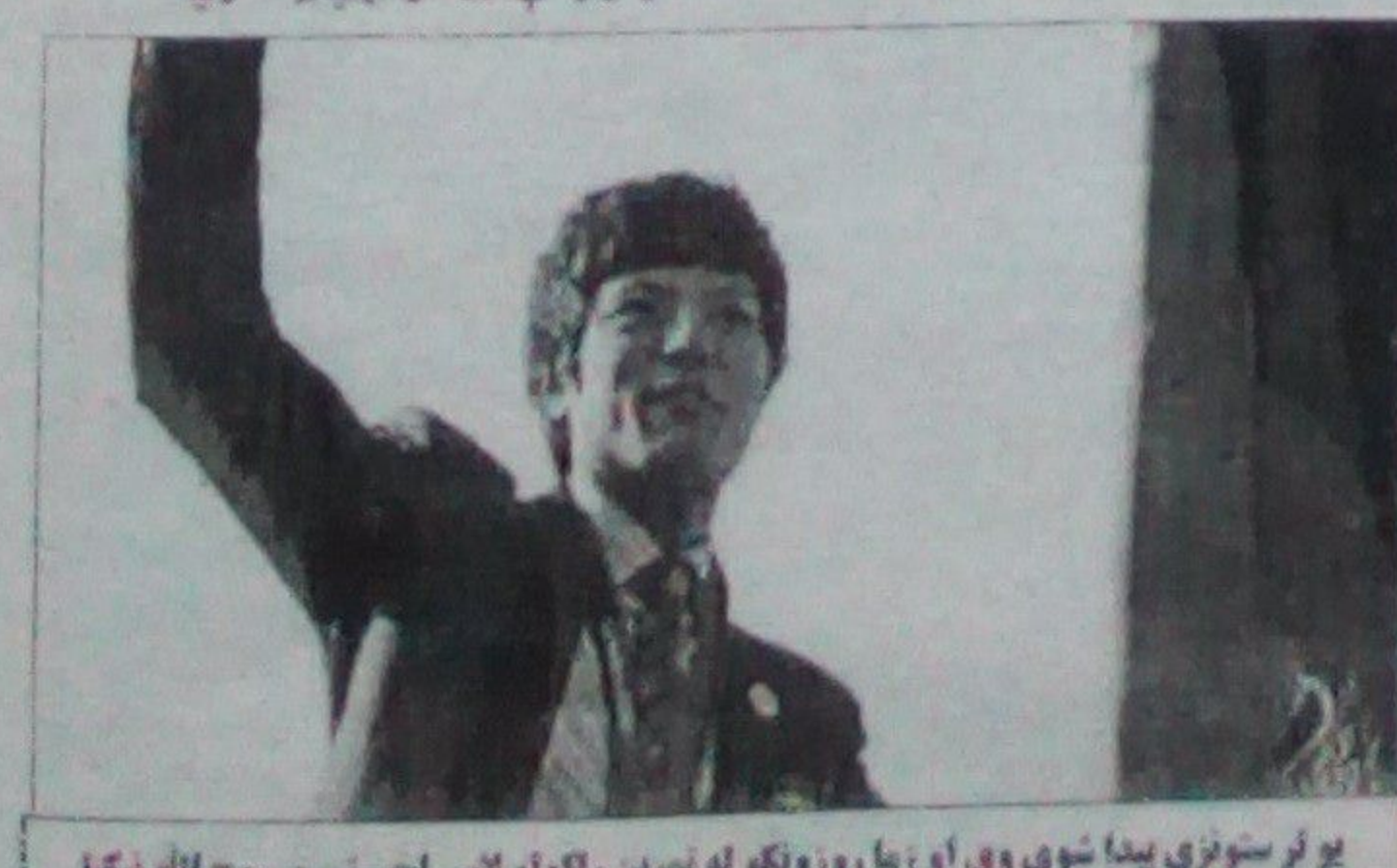
یو لږ ستوري پیدا شوي او زما روزونکو له نرین راتلونو لاس اخیني و روح الله نېکيا

د افغانستان د کرېکټ بورډ اداره د کرېکټ نړیوالې شورا د دوهمې درجې غړیتوب لرونکو هیوادونو په نوم لړ کې ګډه شوه. د افغانستان کرېکټ بورډ ادارې د ډیرې لږې مودې په ترڅ کې د کرېکټ نړیوالې شورا غړیتوب ترلاسه کړ چې دده موقف له ترلاسه کولو وروسته دغه اداره د کرېکټ نړیوالې شورا د ښخ غړیتوب څارونده شوه. د افغانستان د کرېکټ بورډ اداره پر مالي ګټو سربیره له منډې کېتو هم برخمنه شوه چې د کرېکټ نړیوالې شورا په غړیتوب او ناستو کې رسمي ونښه، د رایسې ورکولو حق او د افغانستان کرېکټ بورډ ادارې نظرونو ته د ارزښت ورکولو یې له بللو څخه دي. په هغې خبرې ناسته کې چې د افغانستان د کرېکټ بورډ ادارې د ښوونو په څونه