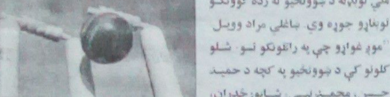
د افغانستان په اوسني ملي لوبځه کې ډېرو لوبغاړو له هېواده د باندې په خاص ډول په پاکستان کې د کډوالو پر مهال دغه لوبه زده کړې ده