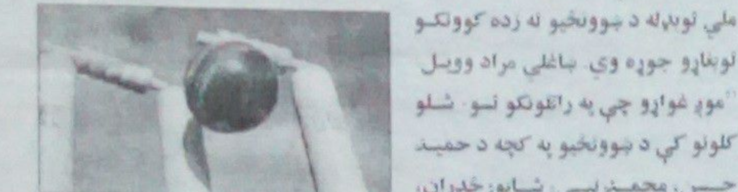
د افغانستان په اوسني ملي لوبډله کې ډیرو لوبغاړو له هېواده د باندې په خاص ډول په پاکستان کې د کډوالی پر مهال دغه لوبه زده کړې ده