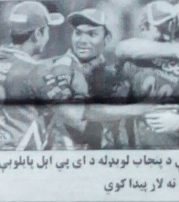
دا لومړی ځل دی چې د پنجاب لوبډله د اي پي ايل پایلوي ته لار پیدا کوي

د لوبې مخکښه د هندوستان د کرېکټ غوره لیگ سیالیو په پایلوه کې د یکنښي په مابام د مخکن فلسي ستوري شاهرخ خان لوبډله «کولکته نایټ رایډرز» د بابلوون د وتلي فلسي لوبغاړي بریښي زینا له لوبډلې «کنګز ایلیون پنجاب» سره مخامخ شوه. دغه لوبه د هند د بنگلور ښار په جیناسوامي لوبغالي کې ترسره شوه. د کرېکټ د شونکو په اند کولکته د اي پي ايل په سړيو لوبو کې په توپ اچونه کې بریالی وه او ساله لوبډله یې پنجاب بیا په توپ وهنه کې تر نورو مخته وه. د بریښي زینا لوبډلې «کنګز ایلیون پنجاب» په لومړي ځل د اي پي ايل سیالیو پایلوي په لار پیدا کړه. د شاهرخ خان لوبډلې «کولکته نایټ رایډرز» بیا تر