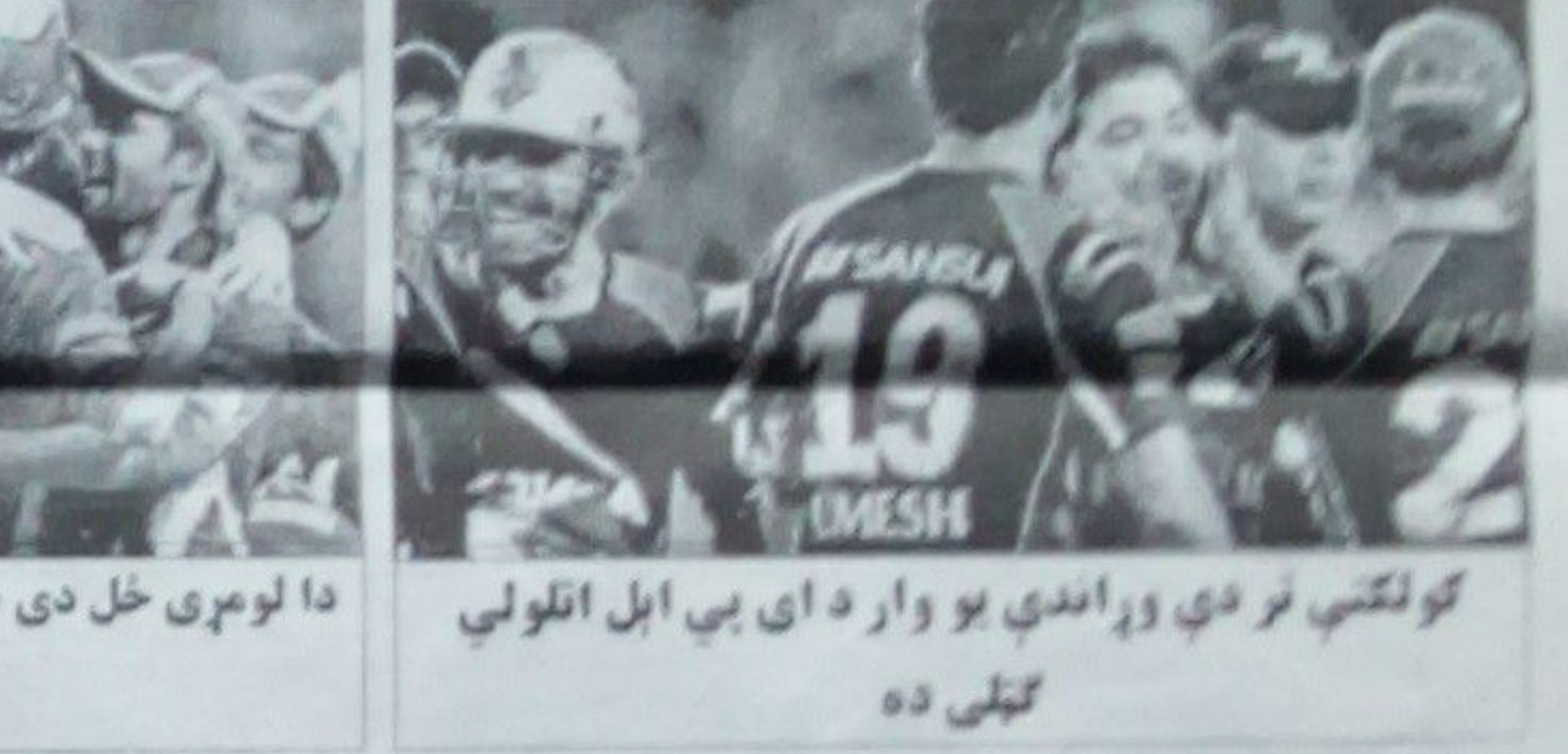
ګولکټي تر دې وړاندې یو وار د اي پي ايل اتلولي گټلې ده

پریکړه وکړه. پنجاب په ټاکلو ٢٠ اوږنو کې ١٩٩ منډي وکړې او کولکتي نه