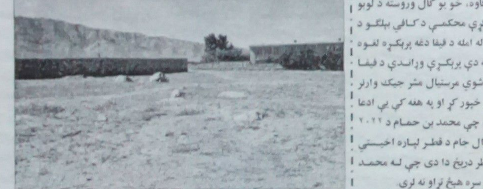
په ٢٠١١ کال کې محمد بن حمام دا ډول ټورونه په کلکه رد کړي وو

د افغانستان د کرېکټ بورډ له پرله پسې کوششونو وروسته په پروان کې د لوبډله د نظام له لوري د دغه ولایت په مرکز د چاریکنار په ښار کې د فوټبال