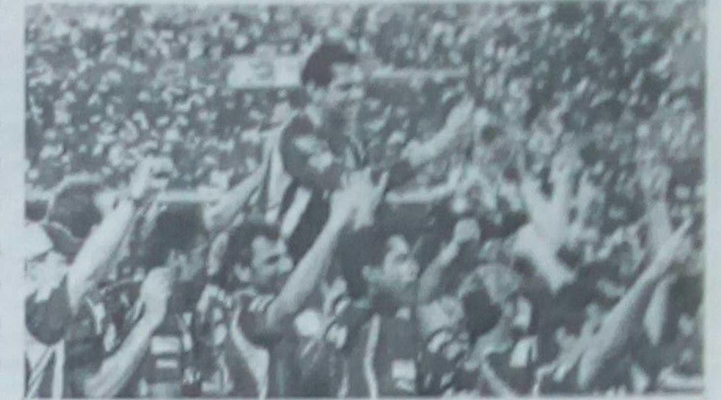
دا دويم وار دی چې کولکته د اي پي ايل لوبو اتلولي گټي

د هندوستان د کرېکټ سټوډنټس لېگکې د سينما ستورو د هندي سينما والي ستوري او پاچا شاهرخ خان اولدولي کولکټي، لوبه کې او په وروستۍ پيلو کې يې د هندي سينما د ملي والي لوبغاړي بريښي.