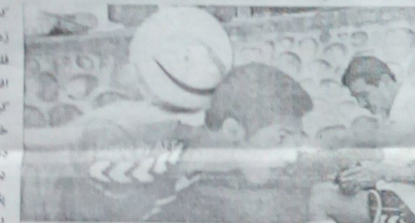
افغان لوبډلې د چلنج کپ سالیو لپاره له لېرو پنځو مياشتو راهيسې تمرين کاوه.