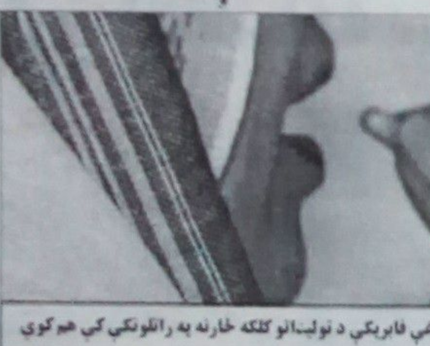
چارواکي وايي دوی به د دغې فابريکې د توليداتو کلکه څارنه به راتلونکې کې هم کوي

په ما هم د دغې فابريکې د توليداتو کلکه څارنه کوي. په افغانستان په ځانگړي ډول په ننگرهار کې د صنعت او توليد پر وړاندې برينتا يوه لويه کونکه ده، چې د درملو د دې فابريکې پر وړاندې تر ټولو بولو لوی خنډ دی. د فابريکې د توليداتو په وينا دسټرکي به دوی له ډيرلي برينتا نه کار اخلي. دا رنگه يې خام مواد هم له بهر نه