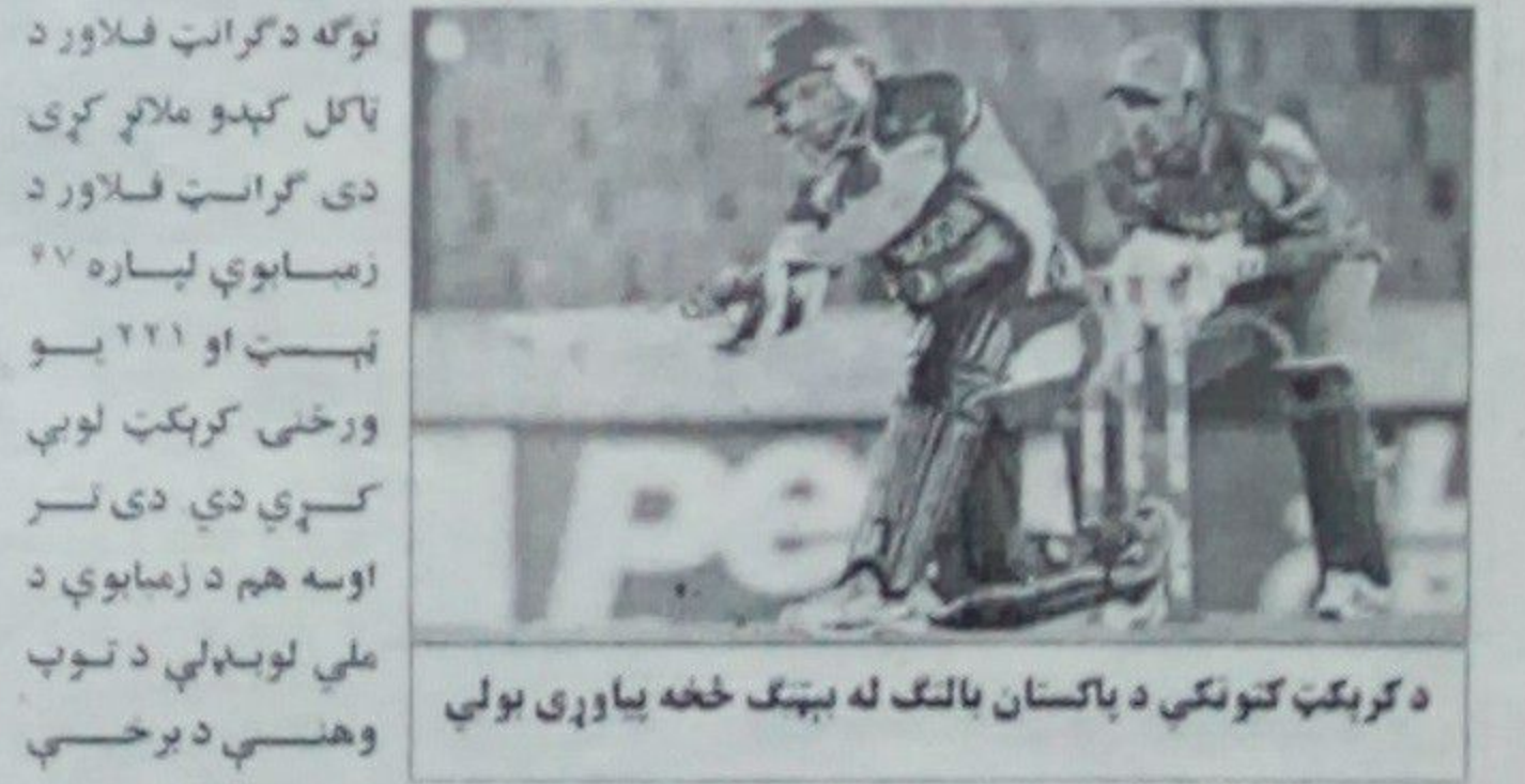
د کرېکټ کټونکي د پاکستان بالنگ له بېټنگ څخه پياوړی بولي

د پاکستان کرېکټ بورډ د ملي لوبډلې لپاره د سپين ورو بالنگ لپاره د روزونکي نه گومارلو وروسته اوس د نوپ وهونکو لپاره هم روزونکي گومارلي دي. د دغې دندې لپاره د زمبابوي تجربنه لرونکی روزونکی گرانټ فلاور غوره شوی دی. د پاکستان کرېکټ بورډ مشر نجم سيني د گرانټ فلاور د گومارنې پرېکړه له معين خان، انتخاب لپاره د زمبابوي تجربنه لرونکی روزونکی گرانټ فلاور غوره شوی دی. د پاکستان کرېکټ بورډ مشر نجم سيني د گرانټ فلاور د گومارنې پرېکړه له معين خان، انتخاب لپاره د زمبابوي تجربنه لرونکی روزونکی گرانټ فلاور غوره شوی دی.