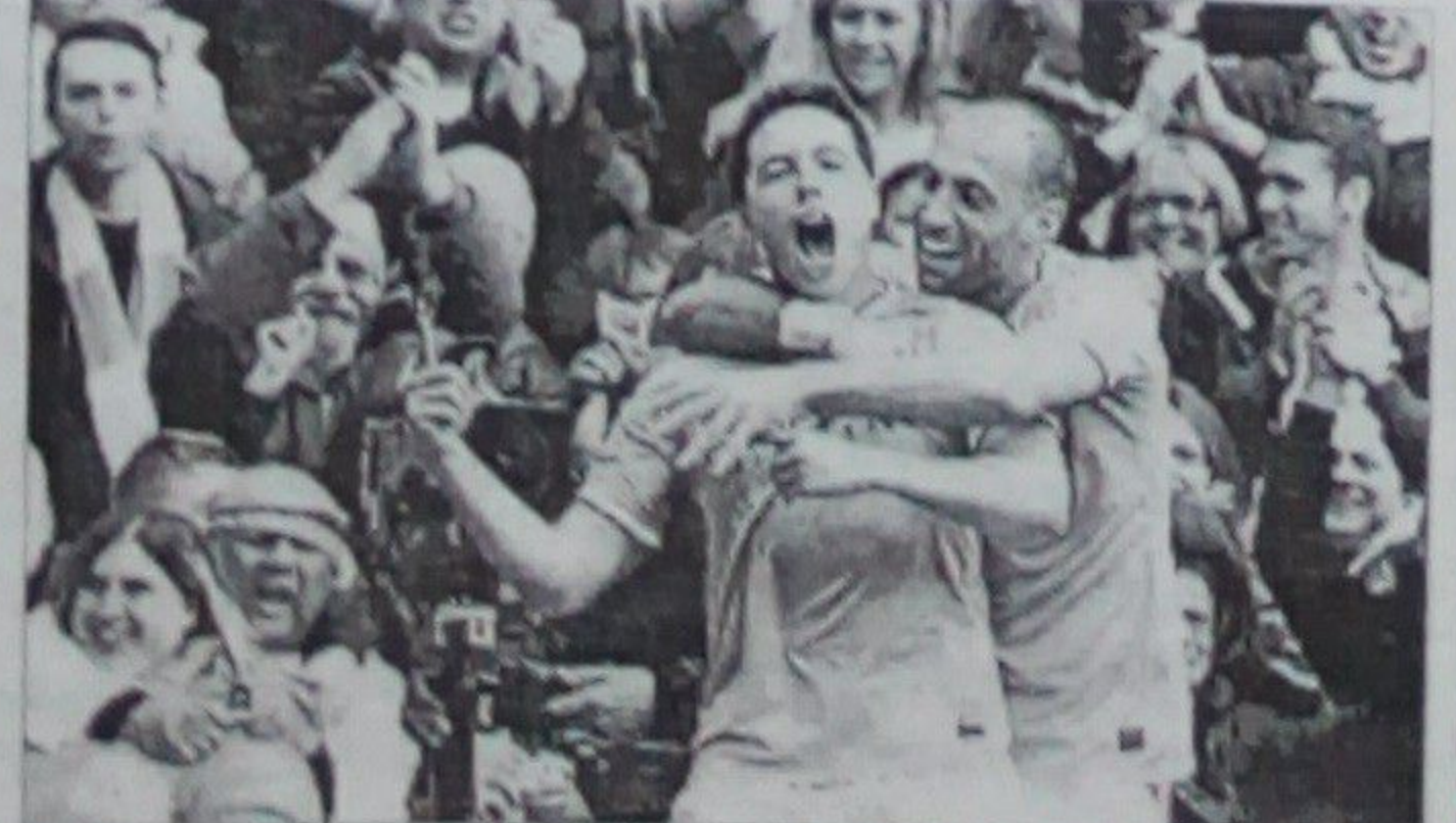
د لويې د دويم نيمایي په لومړيو کې کوميني دويم گول وواژه.

د مانچسټر سټي د ۲۰۱۳-۱۲ فصل په وروستی لوبه کې وېسټ هم له ماني ورکړه او په دريو کلونو کې يې د دويم ځل لپاره د پريمير ليگ جام وگټه. د اټل کېدو لپاره مانچسټر سټي له يوازې د لويې بريا پر لاسونو سره، خو دوی په خپل لوبغالي کې مخالفې لوبډلې ته دوه خطره ساتي ورکړه. د لويې د دويم ځل لپاره د اټل کېدو لپاره مانچسټر سټي له يوازې د لويې بريا پر لاسونو سره، خو دوی په خپل لوبغالي کې مخالفې لوبډلې ته دوه خطره ساتي ورکړه.