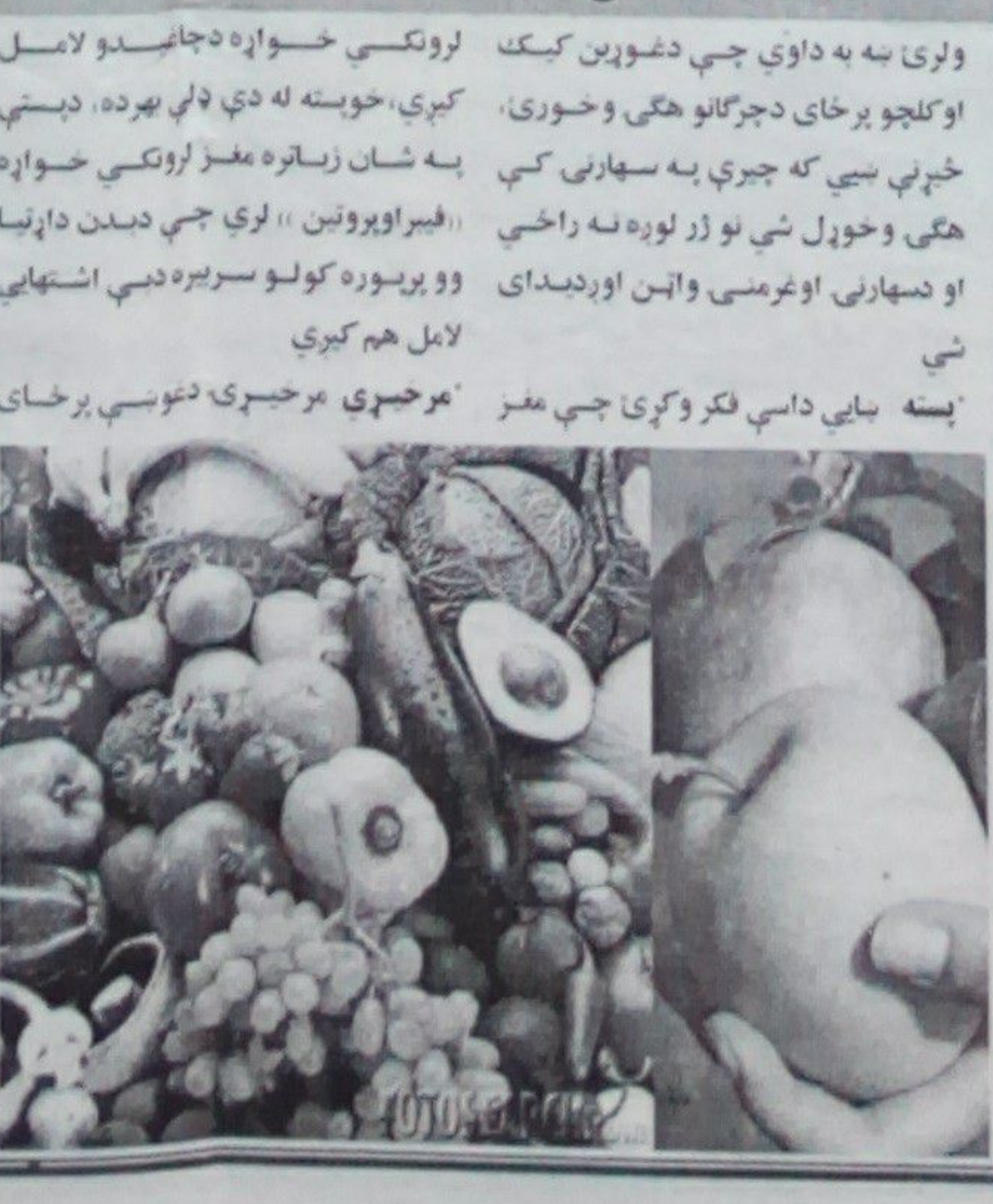
دچرگانو هگی که غواړئ په خپلې سهارني کې سبک اوخوندور خواړه

ولری نه به داوی چې دغوږين کيک او کلچو پرځای دچرگانو هگی وخورئ، ځيرني سبي که چيرې به سهارني کې هگی وخورئ شي نو زړ لوره نه راځي او دسهارني اوغرمی وائڼ اورديدای شي. ښايې داسې فکر وکړئ چې مغز لرونکی خواړه دچاغيدو لامل کېږي، خوښه له دې ډلې بېرته، دسټي په شان زياتره مغز لرونکی خواړه (ايفير اوپروټين) لري چې دبدن داټريا وو پړسوره کولو سربيره دسې اشتهايي لامل هم کېږي. مرغږي مرغږي دغوسې پرځای دزتون غوړي دخپلو خوړو او سلاډ په ټيارولو کې دزتونو له غوړيو څخه ګټه اخيسته دوجود دوزن په کمولو کې ډيرې اغيزې لري، زنتون په خپل جوړښت کې داسې اسيد لري او دخوړلو پرمهال يې مغزونو ته داسې اغيزه رسوي چې ګواکې تاسو ماره شوي باسټ. کارزي باسيوس لرونکی غلې که غواړئ چې وزن موزرکم شي نو عادي او معمولي غلې خوړل کم کړئ او پرځای يې دکازرو باسيوس لرونکو غلې