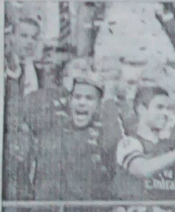
دا په تېرو نېمو کلونو کې لومړی ځل دی چې ارسنل د فوټبال اتلولي گټي.

د انگلستان د فوټبال اېف اي کپ په بايلوبه کې ارسنل هل سټي ته ۲-۲ ماته ورکړه. دا لوبه دلسدن په وېلمې لوبغالي کې ترسره شوه. ارسنل د لويې پيل نه نه و او په څلورمه دقيقه کې د هل برينگر لوبغاړي چېتر لومړي گول وکړ او خپله لوبډله يې مخته کړه. يوازې څلور دقيقې وروسته د لويې په اتمه دقيقه کې کرېس ډيوس دويم گول وکړ او خپله لوبډله يې ۲-۱ مخته کړه. ارسنل چې د پيل په څو دقيقو کې دوو گوله شاته ورسو ځه واخلې، بنکارېده د لويې په ۱۷مه دقيقه کې د ارسنل ساتي کېروزلا لومړي گول وکړ. په لومړي نيمایي کې هل سټي ۱-۲