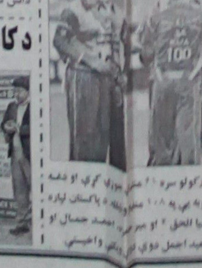
د کابل د کرېکټ اتلولي د نایمینیو لوبډلې وگټله.