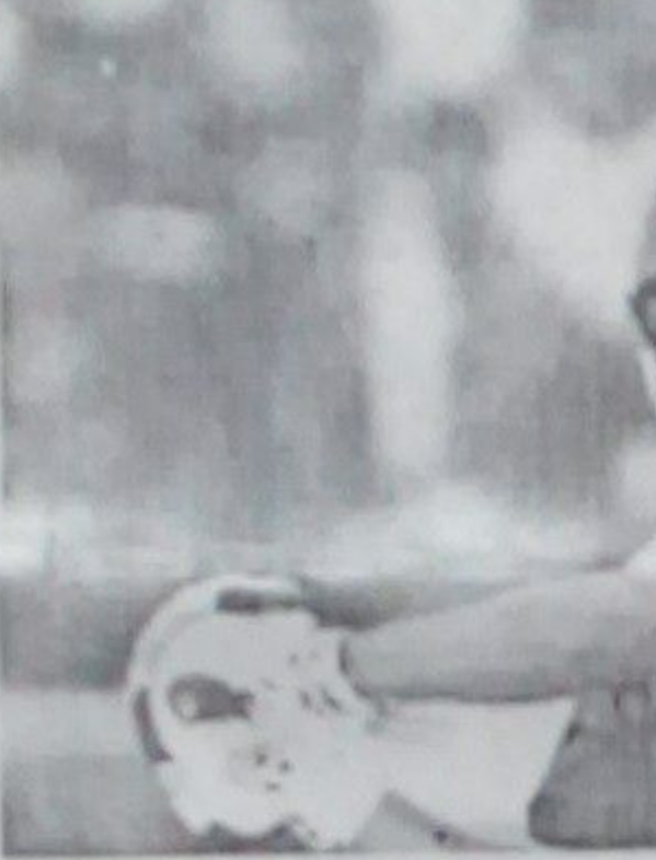
شاهد اپریدی د کرېکټ لوبډلې لوبډل مشر وټاکل چې د کرېکټ بورډ له لاسه راغلی.

شاهد اپریدی د پاکستان لپاره ۲۸۱ نړیوالې لوبې کړې، ۱۱۱۰ شکاریې یې کړې او ۱۱۱۰ مخالف لوبغاړي یې هم سوځولي دي. د پاکستان د کرېکټ د ملي لوبډلې ولسي لوبغاړي شاهد اپریدی وایي د کرېکټ د ۱۱۱۰ کال د را روان نړیوال جام څخه وروسته، یو ورځنی نړیوال کرېکټ پرېږدي. د پاکستان دغه پخوانی لوبغاړی شاهد اپریدی د خپلې لوبډلې لوبډل مشر وټاکل چې د کرېکټ بورډ له لاسه راغلی. ددې لوبډلې لوبډل مشر وټاکل چې د کرېکټ بورډ له لاسه راغلی.