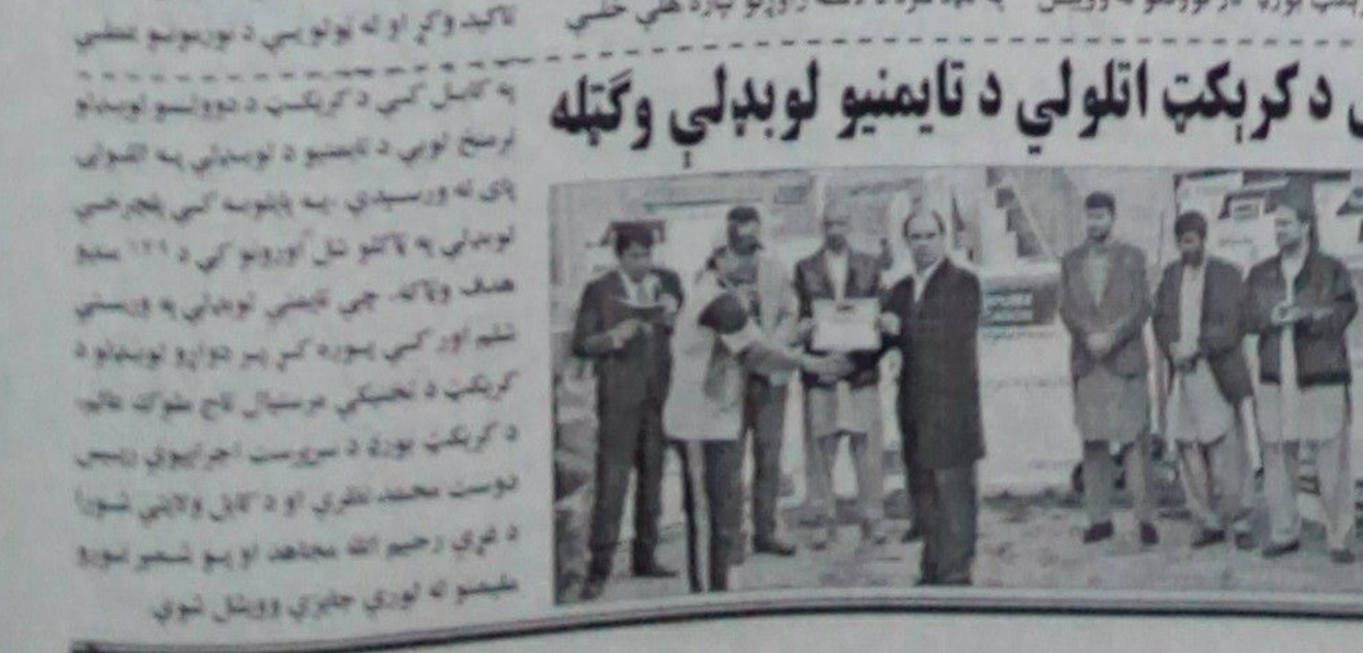
د کابل د کرېکټ اتلولي د نایمینیو لوبډلې وگټله.

د کابل د کرېکټ اتلولي د نایمینیو لوبډلې وگټله. ددې لوبډلې لوبډل مشر وټاکل چې د کرېکټ بورډ له لاسه راغلی. ددې لوبډلې لوبډل مشر وټاکل چې د کرېکټ بورډ له لاسه راغلی.