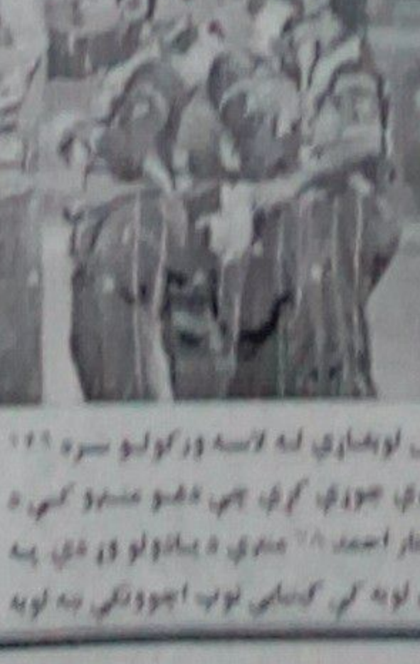
د کابل د کرېکټ اتلولي د نایمینیو لوبډلې وگټله.