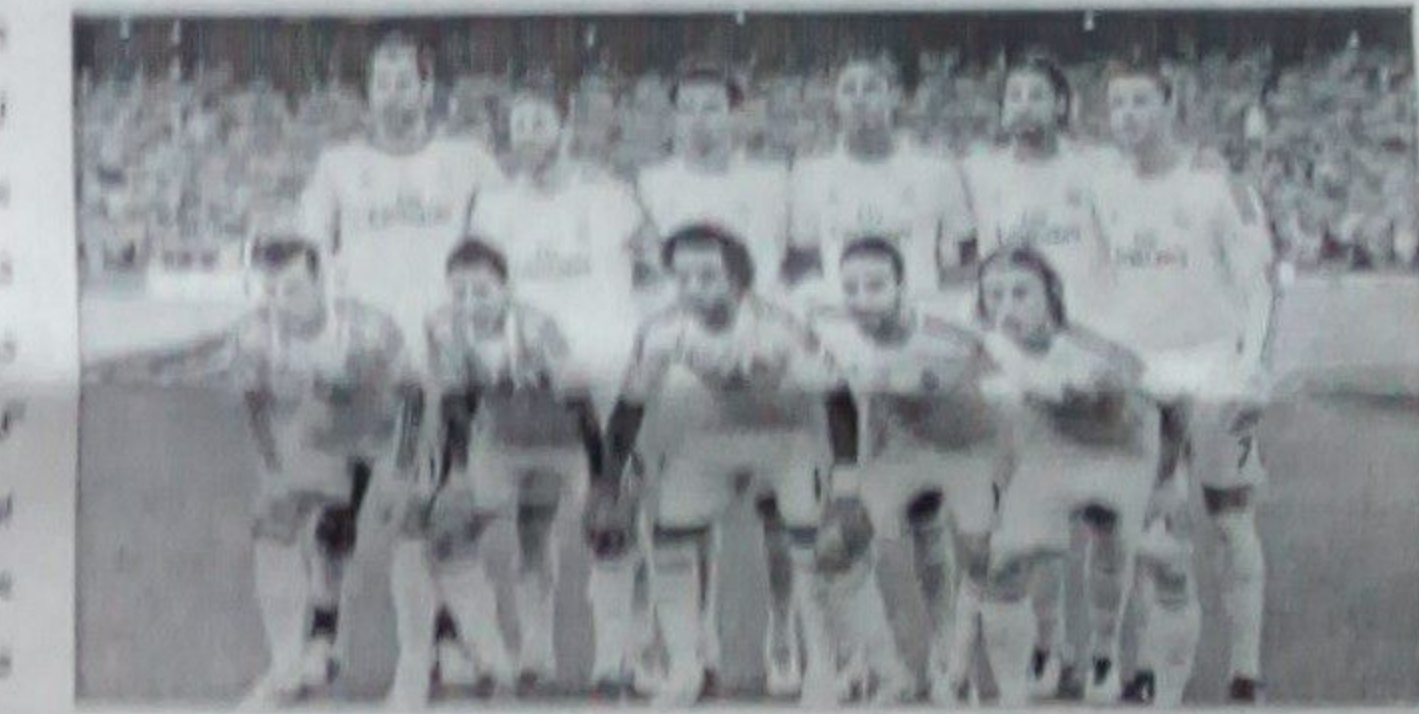
ریال مادرېډ د شخصي لوبډلو نړیوال جام یې وگاټه.

د هسپانیې پېژندل شوي شخصي لوبډلې ریال مادرېډ د ارجنټاین شخصي لوبډلې سن لورنزو له د ۲۰۱۰ سره ماتې ورکړه او د شخصي لوبډلو نړیوال جام یې وگاټه. ددې لوبډلې لوبډل مشر وټاکل چې د کرېکټ بورډ له لاسه راغلی. ددې لوبډلې لوبډل مشر وټاکل چې د کرېکټ بورډ له لاسه راغلی.