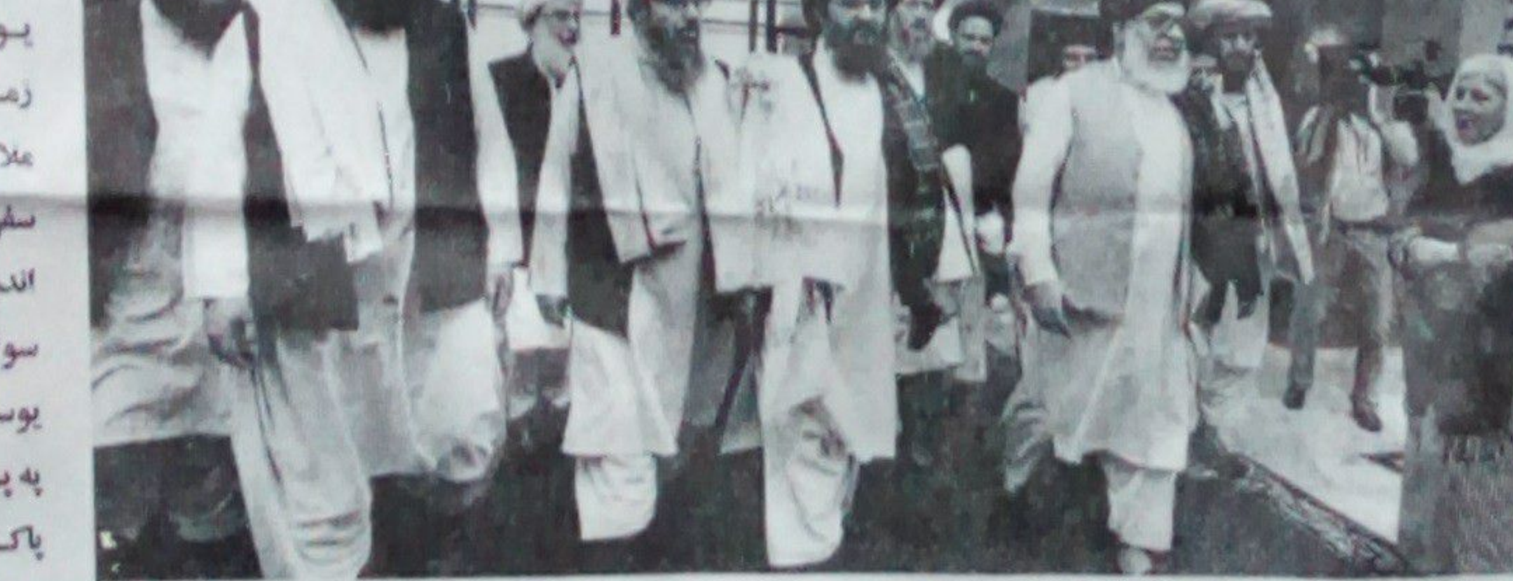
يو شمېر رښتو خبرو ورکړ، چې د زمري په ۳ مه طالب پلوي د ملا عبدالغني برادر په مشرۍ اندونيزيا ته سرور کړ، په دغه سفر کې طالب پلوي د اندونيزيا له دولتي چارواکو سره د افغان سولې په اړه خبرې وکړې. اندونيزيا سولې په اړه خبرې وکړې. اندونيزيا سولې په اړه خبرې وکړې. اندونيزيا سولې په اړه خبرې وکړې. اندونيزيا سولې په اړه خبرې وکړې. اندونيزيا سولې په اړه خبرې وکړې.

احمد فرهاد يو شمېر رښتو خبرو ورکړ، چې د زمري په ۳ مه طالب پلوي د ملا عبدالغني برادر په مشرۍ اندونيزيا ته سرور کړ، په دغه سفر کې طالب پلوي د اندونيزيا له دولتي چارواکو سره د افغان سولې په اړه خبرې وکړې. اندونيزيا سولې په اړه خبرې وکړې. اندونيزيا سولې په اړه خبرې وکړې. اندونيزيا سولې په اړه خبرې وکړې. اندونيزيا سولې په اړه خبرې وکړې.