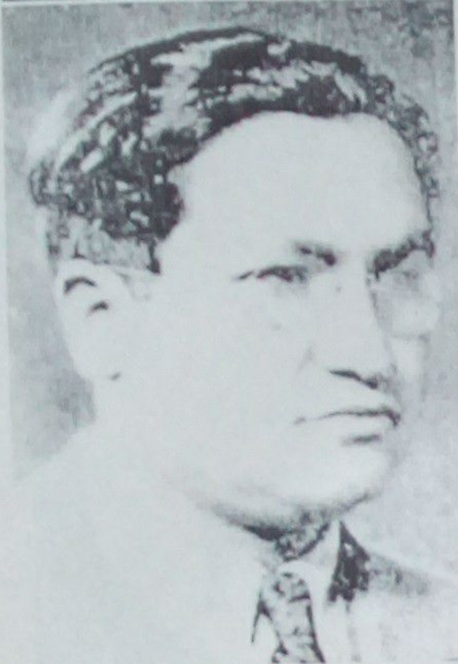
۱۲- تاریخ مختصر افغانستان (جلد های اول و دوم ۱۳۵۶ دری).

وی در سال ۱۳۰۶ شمسی بحیث معاون جریده طلوع افغان و از سال ۱۳۱۰ تا ۱۳۱۹ ش منحب مدیر مسؤل همان جریده ایفای وظیفه نموده که این پست را با موفقیت و به گونه ابتکاری تداوم بخشید.