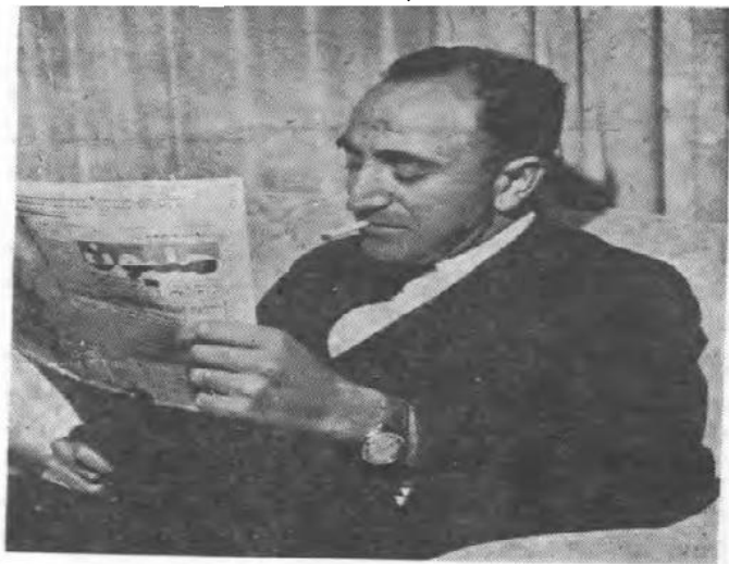
علم-د طلا د نندارې اصلي طراح

علم چې وليدل چې د دې نجلۍ قيافه او چال چلند کټ مټ همغسې دي، کوم چې شاه يې په ښځو کې خوښوي، نو د کامبيز اتاباى په مرسته هڅه کوي، تر څو د هغې له کورني وضعيت نه ځان خبر کړي، روسته بيا له کوم خنډ پرته دغه احوال هم ترلاسه کوي او بيا يې شاه سره د اشنايۍ لپاره لاره برابروي.