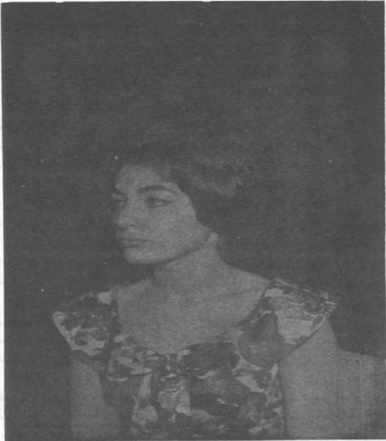
آیا دا د محمد رضا شاه پهلوي لور ده که د سویسي ارنست پرون؟

زیاتېدو سره لکه د پلار یې (ارنست پرون) خرمایې شول. په عمومي توګه شهناز ارنست پرون ته دومره ورته وه، چې که په یو مجلس کې دواړه څنګ په څنګ ناست وای، نو شباهت به یې رښتیا هم ناست خلک حیران کړي ول.