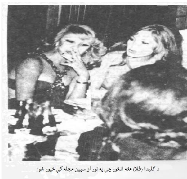
د گلېدا (طلا) هغه انځور چې په تور او سپين مجله کې خپور شو.

طرحو او پروگرامونو څخه وه چې بهرنيو مطبوعاتو خصوصاً جرمنيانو ته د غير مستقيم ځواب په ورکولو کې د دربار او عاملانو ( ) لخوا پلان او تدوين شوه او د شايعې په توگه نشر ته وسپارل شوه؛ د دې لپاره چې دغه تبليغاتي طرحه خپره شي، د وخت د ير په دستور د طلا او يو بل تن تصوير د تور او سپين مجلې په يو مخ کې خپور شو او هغه څوک چې تبليغاتي پروگرامونو سره بلد دي، ښه پوهيږي چې دغه ماهرانه مانور نه يوازې د شايعې د له منځه وړلو لامل نشو، بلکې شايعې ته يې لاسپې نور اړخونه ورکړل او ټول يې وپوهول چې شا ښخ