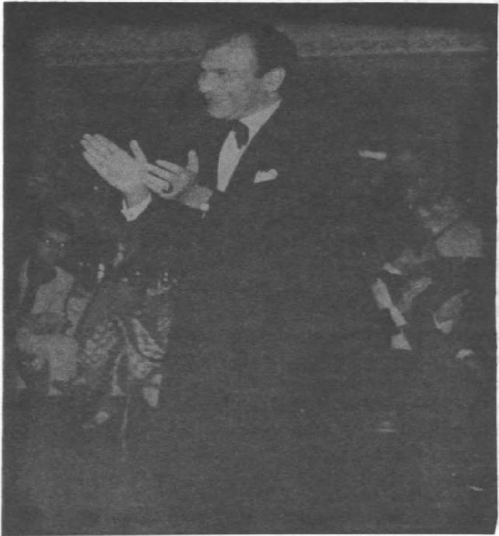
دوشیزا هدی دوشیزا هدی

یوه میاشت وتلې، څنگه ژر یې فکر ته ورلوېږي، چې ځان ته یو مخصوص دفتر ایجاد کړي او خپل پخوانی کوژدن د دغه پوست مشرۍ لپاره وټاکي؟! فرح د ۱۳۳۸ ل کال د سلواغې په لومړیو کې کریم پاشاه بهادري (خپل پخوانی کوژدن) چې اوس د مخصوص دفتر رییس دی، دربار ته بیایي او همغه وه، چې پوره نهه میاشتې او نهه ورځې روسته د ۱۳۳۹ ل کال د لړم په نهمه ولیعهد دنیا ته راوړي او د ایران ملت ته زیری ورکوي.