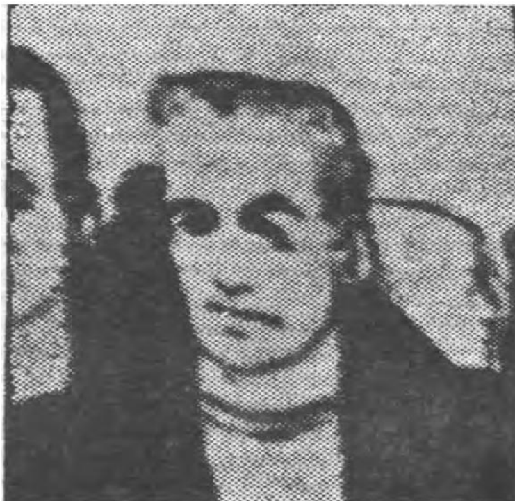
په نیویارک کې د همجنسپالو کلب د دروازې پر سرد ایرانی شاه انځور!

دغه وړاندیز شوې موضوع څو ځله د مختلفو مذهبونو لخوا تر نیوکې لاندې راغله، د کواکرانو ډلې (کواکران د دوستانو د ټولنې غړي دي، دا ټولنه چې په اولسمه پېړۍ کې رامنځته شوه، هدف یې دا و، چې باید په پوښاک او سلوک کې سادګي دود شي او لقبونه حذف شي) په بریتانیا کې خلکو ته همجنسبازي یو ذلیل کار معرفي کړ.