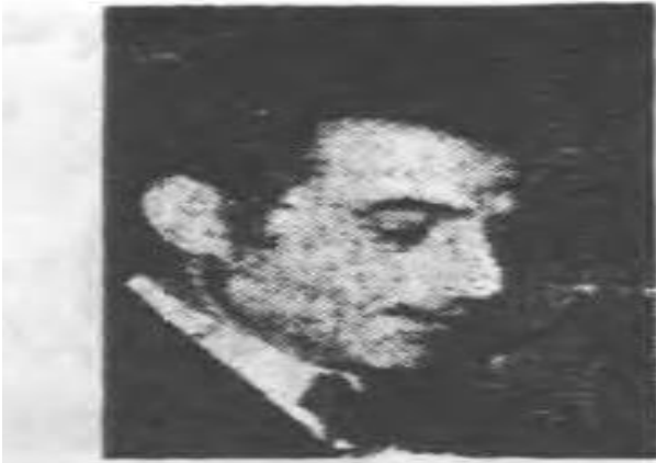
کریم یاسنا بهادری وزیر اطلاعات و جهانگردی