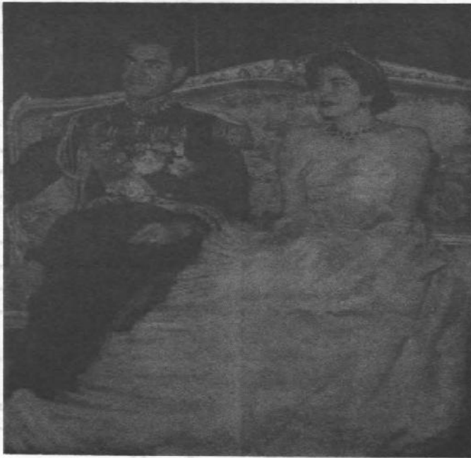
تصویری از عروسی شاه و ثریا

د یوې شبې لپاره لکه فلج چې شم، هیڅ حرکت مې نشوای کولی، سترگو ته مې د اور شغلې تاوېدلې، داسې مې احساس کړه لکه توده او سره غوندې چې شم. نور نو څه پاتې نه ول، هر څه توفان تالا والا کړل، بېرته خپلې کوټې ته راغلم شاوخوا مې وکتل، داسې مې انگیرله، لکه د یو څو شیبو لپاره چې لیونی شوې یم، بیخي بل ډول حالت و.