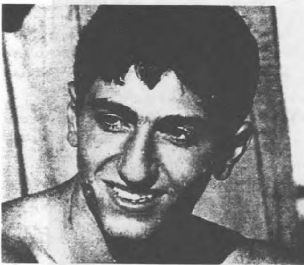
رضا شاه پهلوي