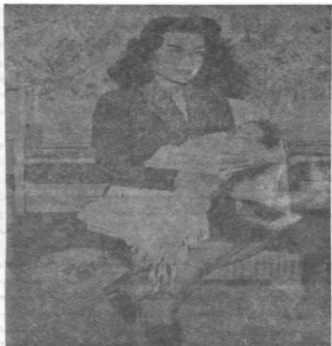
د ایران اصلي شاه او خیالي ولیعهد!

فوزیې سره د شاه په واده کې اشرف هیڅ ډول لاس نلري، بلکې دا هغه کوله (مړی) وه چې رضا شاه د خپل زوی لپاره تیاره خولې ته پورته کړې وه او دا چې اشرف او د شاه نور اولادونه له هغه داسې وپېرېدل لکه سپي، نو اشرف د خپل غبرګوني ورور د جنسي کمزورۍ په اړه خپل پلار ته هیڅ ونه ویل؛ ځکه هغې داسې فکر کاوه چې که رضاخان له دغه راز نه خبر شي، نو د نیکبختۍ او اقبال مارغه، چې اوس یې پر سر ناست دی، هغه به والوزي، ځکه چې رضاخان خامخا یا محمد رضا له ولیعهدۍ څخه ګوښه کاوه او یا یې هم واژه