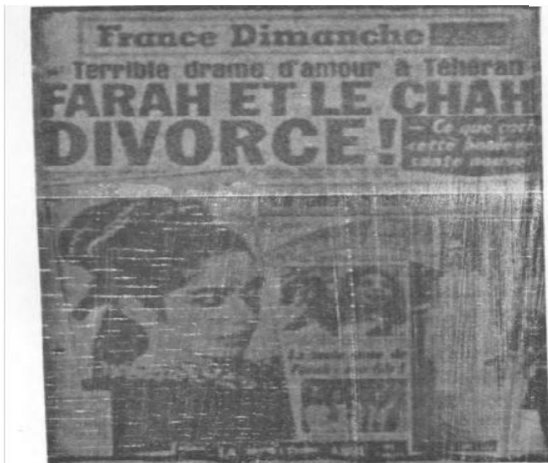
د یوې تل یاتې ماهرانه شیبې لوبې څیمه!

له دغه ځایه روسته د مقالې لیکوال خیالي خبرو ته ځي او دا چې له دې هیسته پوره خبر نه دی او هلته غواړي خپله مقاله وغځوي، نو په داستاني توګه