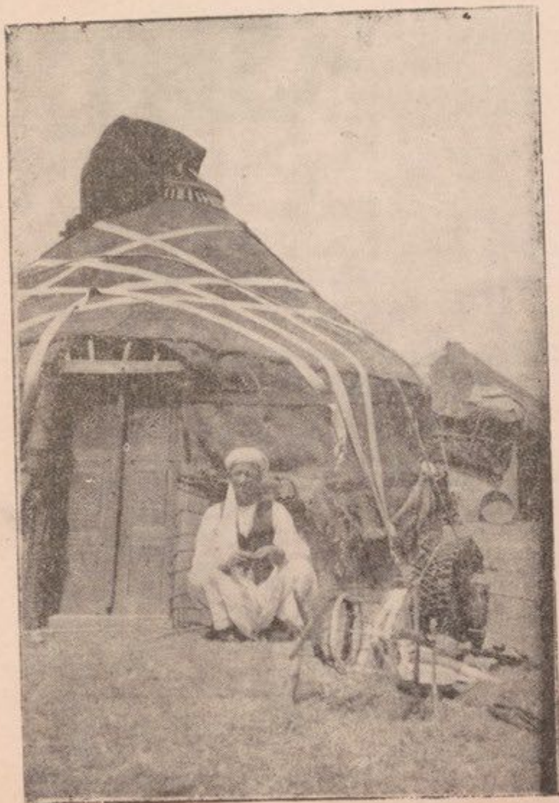
سنجتنك ميمنه چادر نشين هاي قوم قه قه مربوط بمقاله ( در تجسس مغل )