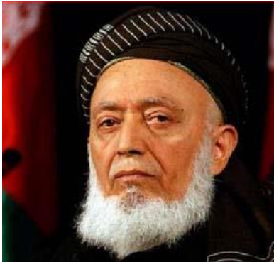
(برهان الدين رباني)

دا لیکنه پر (۱۳۹۵ ل کال) د یو شمېر هغو کړیو په ځواب کې لیکل شوې، چې په انتقاد کې له افراط څخه کار اخلي او په یو اړخیز ډول قضاوت کوي.