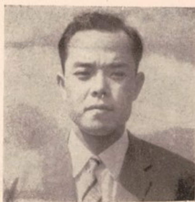
بناغلی تا کشی کتسو فوجی