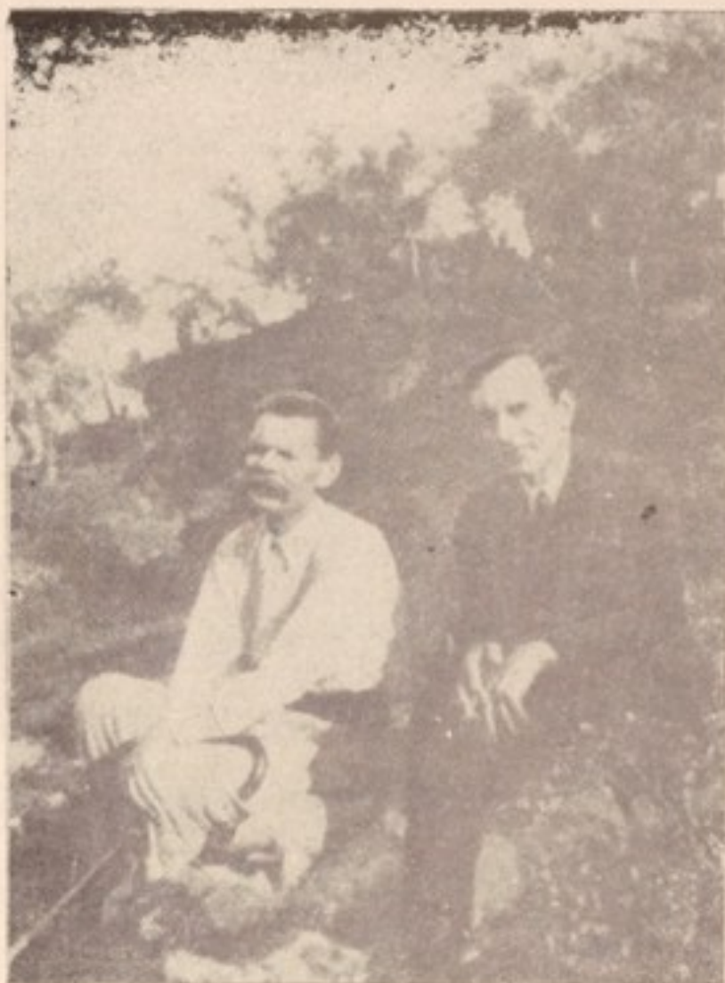
گورکی و فرانز هانتز نویسنده‌ی بلژیکی در سورنتو (۱۹۲۷)