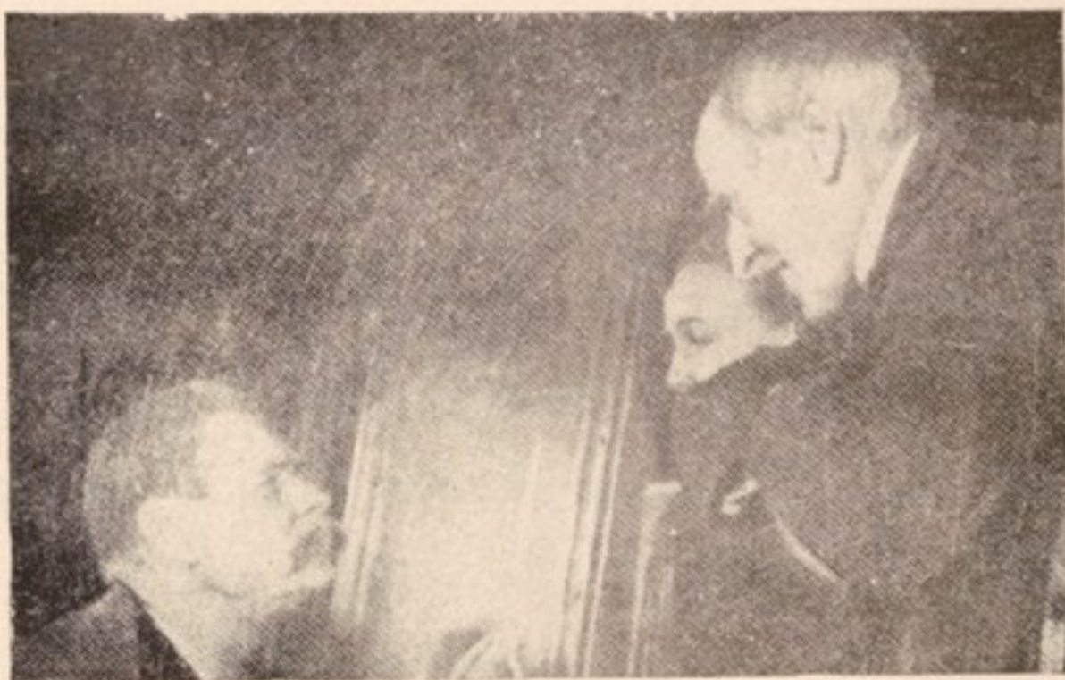
گورکی ، رومن رولان و خانمش در ایستگاه قطار آهن مسکو (۱۹۳۵)