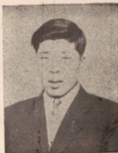
بناغلی به دن