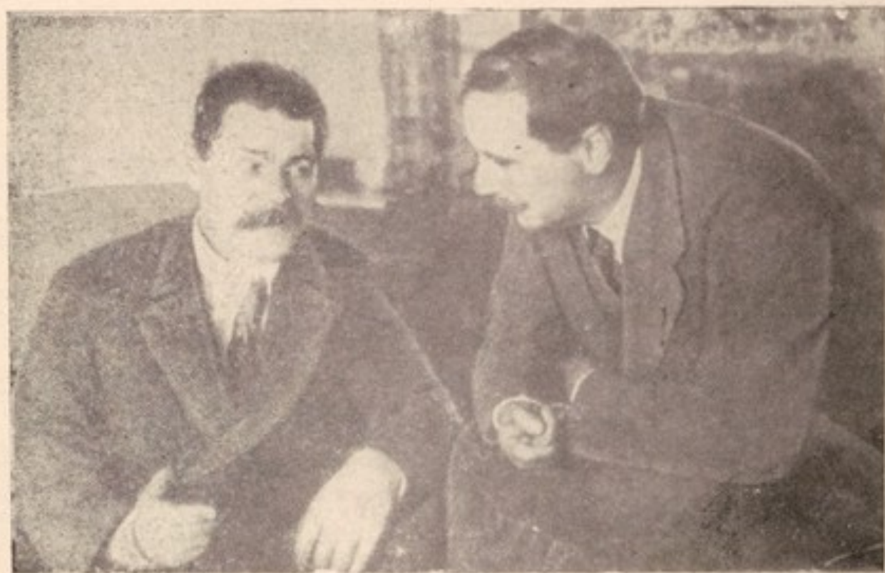
گورکی و اچ . جی . ولز - پتروگراد (۱۹۲۰)