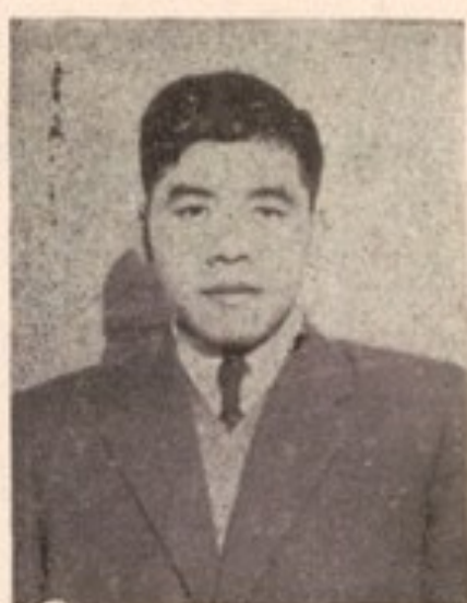
بناغلی بوتی - کن