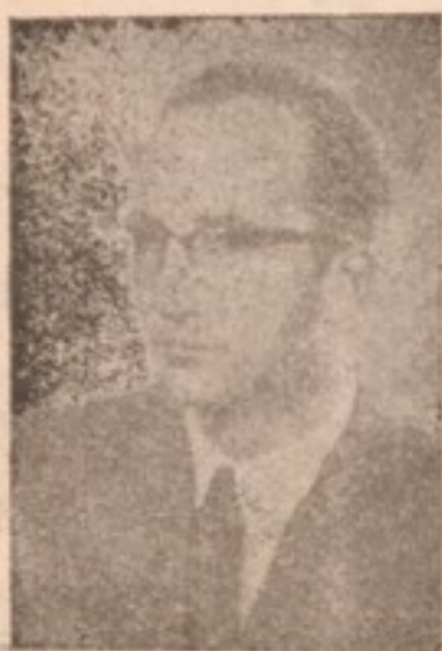
بناغلی دا کتر فیشرد

تحت پروگرام سکالرشپی (۱۹۵۲-۱۹۵۴) به مالک سیلون ، هندوستان ، نیپال ، پاکستان ، افغانستان ، ایران ، عراق و ترکیه برای مطالعه آرت دوره هند و اسلامیک مالک فوق مسافرت کرده اند .