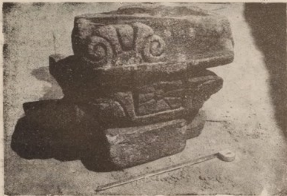
اسلامپور: سنگهای کنده کاری شده از یک عبادتگاه باستانی

بالای آن خرابه های دیوارها و باستیر نهایی مستطیل و نیم مدور از سنگ سلیت، که غالباً قواره خشن دارند، محافظه گردیده اند. در اینجا استحکاماتی بنظر میرسد که به دره نور و دره کفر هر دو حاکیست داشته یابیه ساکنین دره بحیث دژ فرار خدمت میکرده یایک پایگاه نظامی جهت صیانت سرک ها و نقاط تلاقی دریاها بوده است. دیوارهای استحکامات از هر دو دره در یک دامنهء نشیب داری بالا رفته و در یک کناره کوه با هم وصل میشوند. در یک فرورفتگی میان این کوه ها بطرف کفر پلانهای افتاده، خانه ها دیده میشود که بوجود معموره ای در پناه حصن کوه اشاره میکند. قسمت مرکزی آن چنان بنظر میرسد که یک بنگاه بزرگ جهت اجرای مراسم مذهبی بوده است از بنگاه مذکور در همان محل هنوز آخرین بقایای یک دیوار از سنگهای سلیت و هه چنان بعضی لوحه سنگها که در محل سابقهء یک دروازه با صفائی تمام کار شده، شناخته میشود. در نزدیکی همان قلعهء فریق العاده بزرگ یسکی از خرابه این کفر بنام سید عبد الله پاچا واقع میباشد. در آستانه های دروازه، چوکات، کلسکین ها و احاطهء کردهای گل، سنگهای همان عبادتگاه قدیم استعمال شده است. در جلومدخل قلعه اوچه سنگهایی را که جسامت وسطی آنها