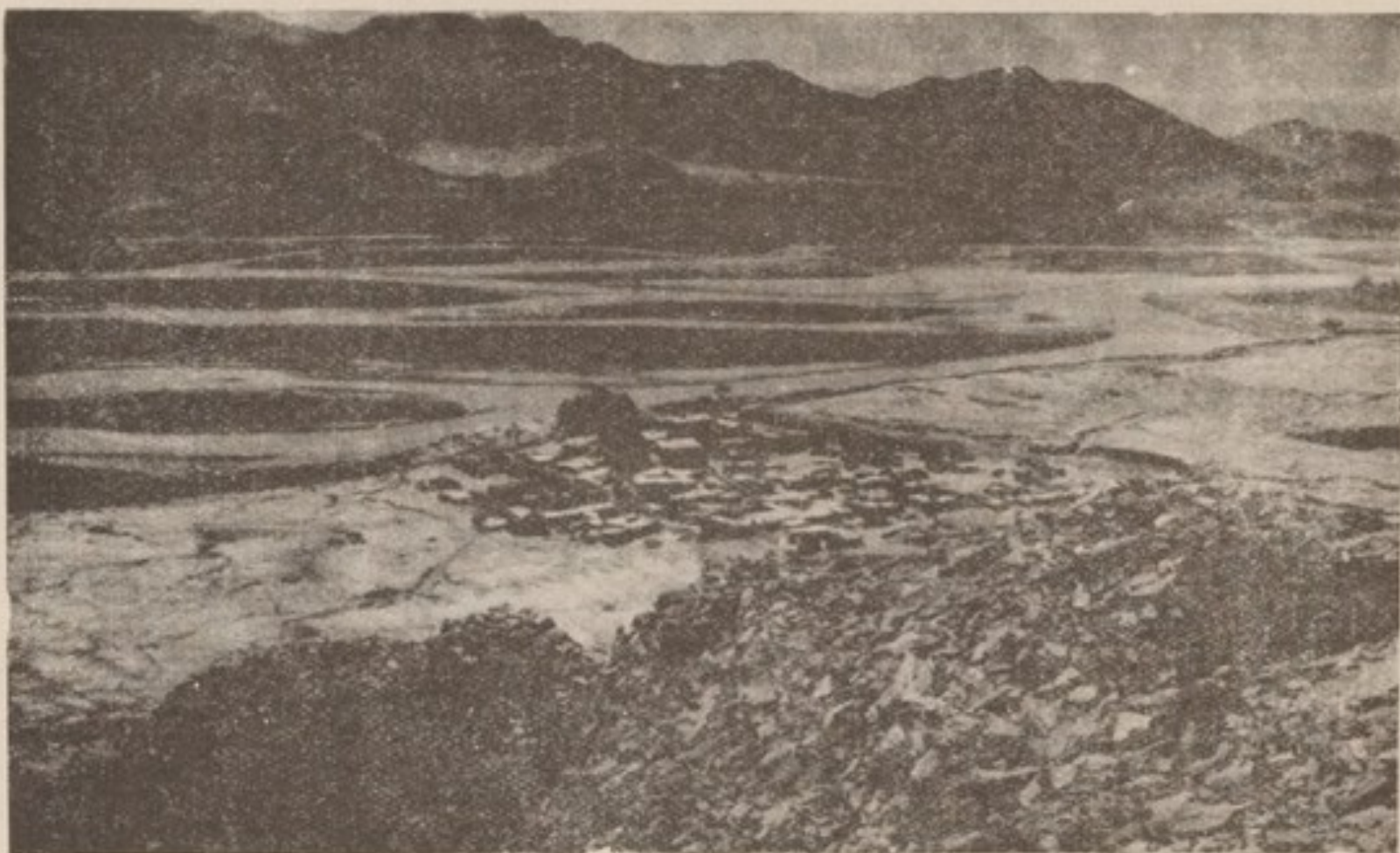
اسلامپور: دره کتر، دهکده و استحکامات در دامنه کوه

به یک معماری دفاعی اشاره میکند، چنانچه استنباط میگردد از اسلام پور از میان دره و از بالای کوتل راه باستانی ای که در اینجا بذریعه استحکامات حفاظت می شد، موجود بوده است. واضحاً این راه که با امتداد پیکر کوه کشیده شده در زمان سابق از راه کنار دریا که با امتداد یک ساحل نشیب دار یا از میان با طاقی می گذشت، ترجیح داده شده بود. مشاهده این راه ارتباطی به نظریه ترینکلر (۱) که اسکندر بسوی گنوهمراره دریا را مستقیماً تعقیب نکرد بلکه در بعضی حصص راه میان کوه هاراپیش گرفته بود، دست آویزی می بخشید. سلسله استحکامات کوهی درهء نور در حصهء اسلام پور و پیشتر جانب گنوه قرون بعد از لشکر کشی اسکندر تعلق دارد، اما احتمال دارد که بنیاد آن در زمان اسکندر گذاشته شده باشد.