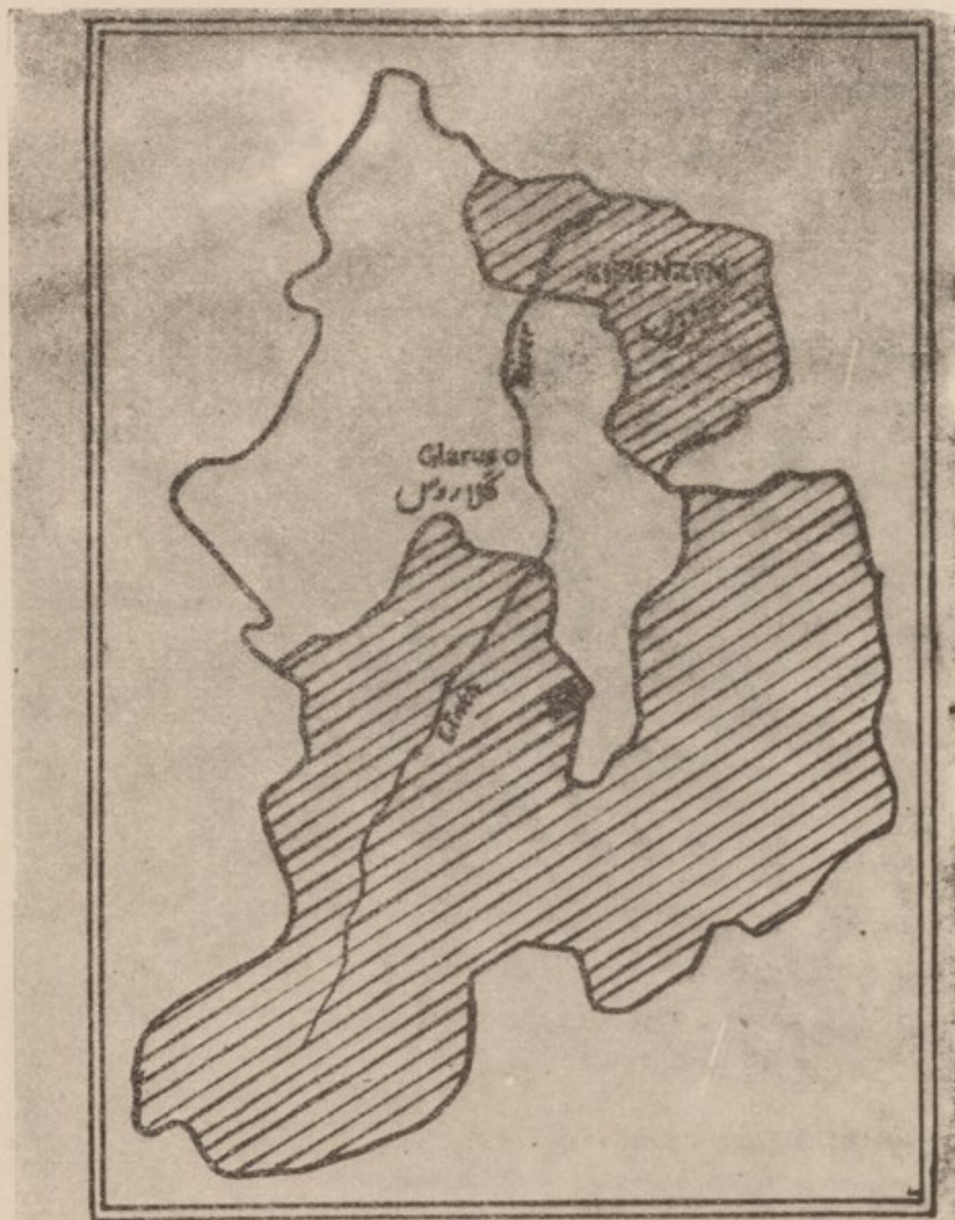
(شکل ۷) رسمی: (مؤسسه جغرافیة پوهنشی ادبیات)

واضح است که باید نقشه یا اطلس لهجی با چنان تفصیلاتی مزین باشد که حقایق یا تفصیل مبدأ اشکال لسانی را مانند نقشه‌های مرتبه Fischer و Hagg و Klocke ایضاح کند. انلسهای