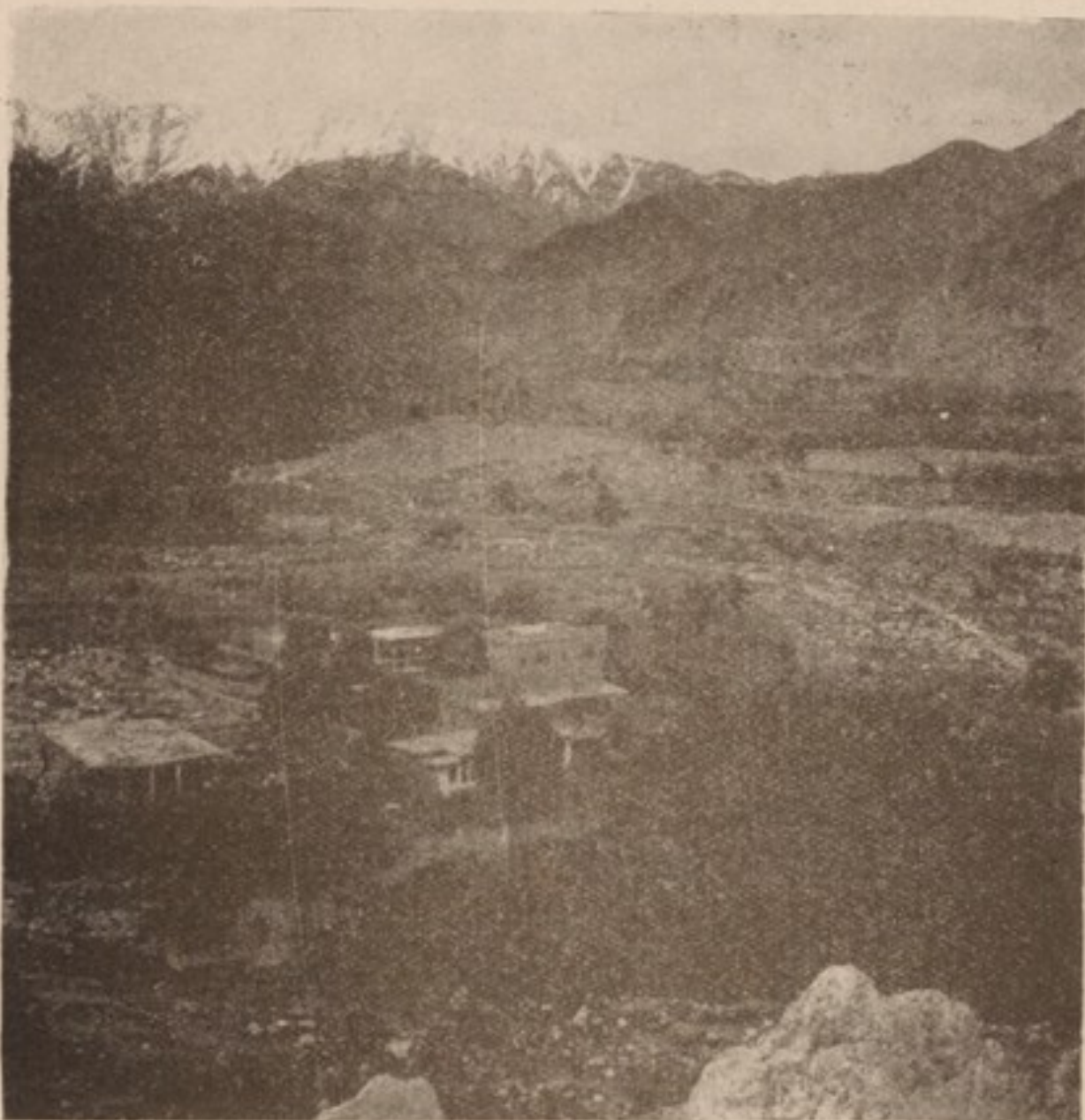
دره نور :

میشوند) سیستمی از دره‌های بسیار منشعب بسوی کنور می‌رود. از فراز بمبهه کوت در قلب کوه هامنطقهء برزخی جانب نورستان امتداد یافته است. هر قدر که انسان طرف قسمت‌های علیای دره هابسری شمال بلند رود، بهمان اندازه با مردمان موخر مایسی و کبودچشم، که لباس و عادات مخصوصی دارند، برمی‌خورد. ایشان گروه پهای متفرق و پاشانی اند که در اینجا از قشونکشی‌های بزرگت باقیمانده در مناطقی که رجعت کرده‌اند زندگی میکنند. باید کلمهء درهء نور را توضیح نمود. معنی آن بزبان فارسی معلوم است (مانند نورستان = سرزمین نور)، و بزبان پښتو طوری که می‌گویند «درهء میان صخره‌ها» میباشد. احتمال می‌رود که این نام با خواجه نوره که یکی از فاتحین اسلامی بوده است، رابطه داشته باشد. و بالاخره بقرار روایتی نوح با کشتی خویش بالای یکی ازین کوه‌های بلند پیا ده شده است. در حصهء شیوه از سرک درهء کنور راهی جدا شده که از طریق قریهء بزرگت املا