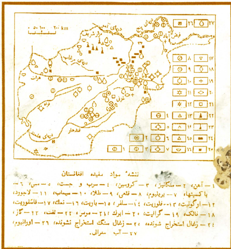
نشه مواد معدنی افغانستان