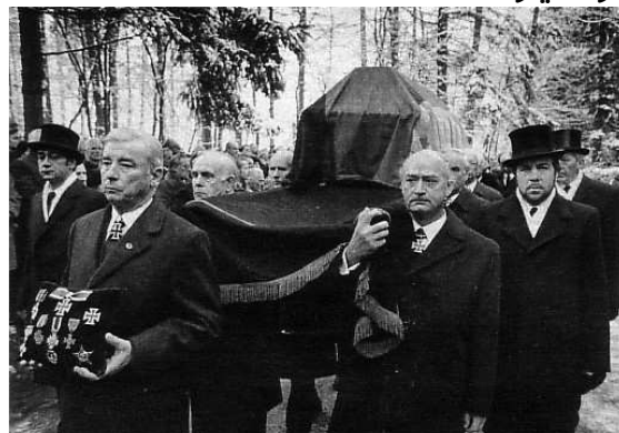
تشیع پیکر کارل دونیتز

سرانجام این دریا سالار بزرگ در ۲۴ دسامبر ۱۹۸۰ و در سن ۸۹ سالگی دیده از جهان فرو بست. وی را در کنار آرامگاه همسرش به خاک سپردند. برخی از مردم و منجمله طرفداران نازیسم در آلمان، دونیتز را پس از خودکشی پیشوا آدولف هیتلر او را به عنوان رئیس جمهور آلمان و بعضی‌ها همچون حزب رایش سوسیالیست بعدها او را پیشوای قانونی آلمان می‌دانستند.