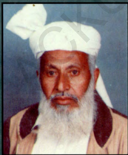
پروفیسر ڈاکٹر قاضی حفیظ اللہ بناد جبار خیل