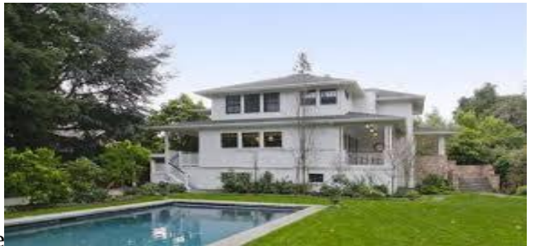
Mark Zuckerberg home

فروفایلونه جوړوې. په افغانستان دننه زما په شمول د فیسبوک کاروونکو شمیر (۴۰۰۰۹۲۴) خلورمیلیونه و نهسوه خلرویشته ده چې دا شمیر ورځ تر بلې زیاتېږي... د فیسبوک مشر مارک زکبرگ د امریکا، کالیفورنیا ایالت په پالوالتو سیمه کې په ۵۰۰۰ مربع فوټه ځای (کور) کې ژوند کوي او مارک په ۲۰۱۱ کې د کریسنټ پارک تر څنګ د خپل ګاونډي کور په ۷ میلیونه ډالرو کې پیږود کړ.