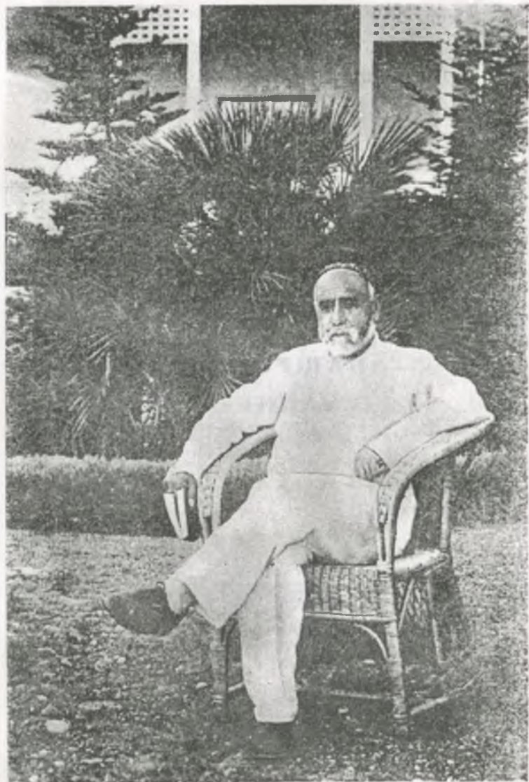
С. Айни дар соли 1937