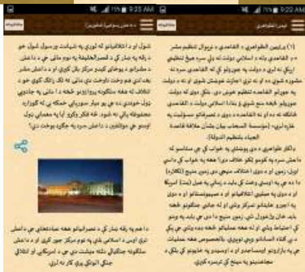
د کتاب د نشر و لوحق له ټولو مسلمانانو سره خوندي ده