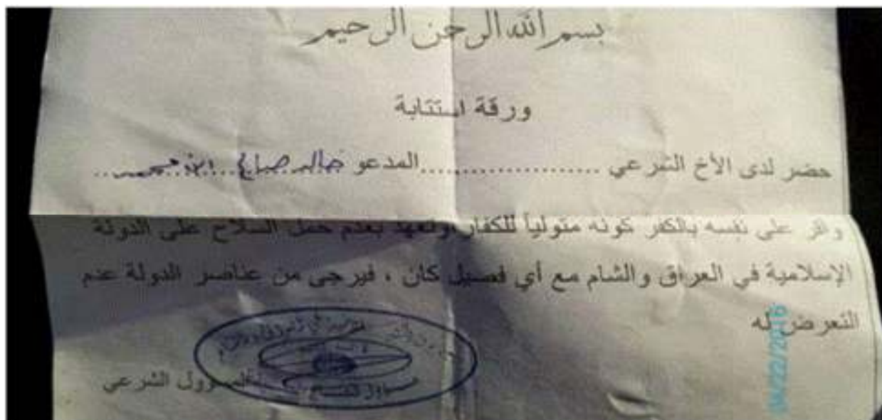
د پورتنی مضمون ژباړه:

د داعش په دين کې يواځې هغه وخت يو مسلمان د دوی له وحشت او ظلم څخه نجات موندلی شي چې د دوی په وړاندې په خپل کفر اعتراف وکړي. د صکوک الغفران په نوم هغه پاڼې اوکورې چې داعش يې په هغه خلکو تقسيموي چې د دوی ته تسليمیږي او يا په خپل کور اوسيدل غواړي.