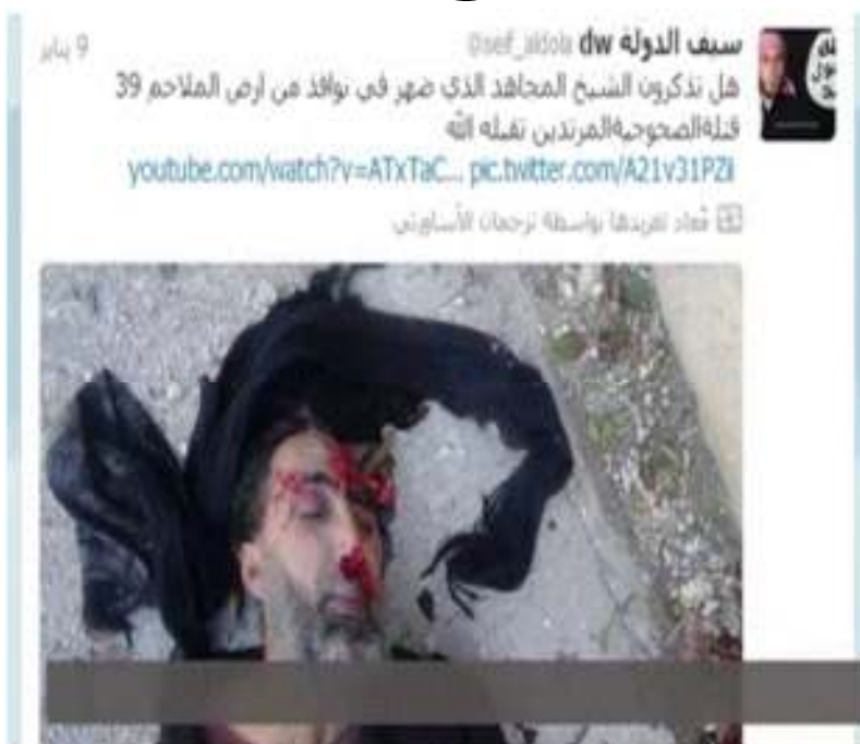
نوموري دا کس مهاجر بللی او د ده وژونکي پي مرتدين بللي.