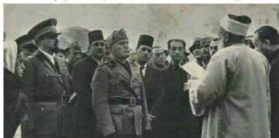
المفتي يستقبل موسوليني ويصف المجاهدين بالخوارج