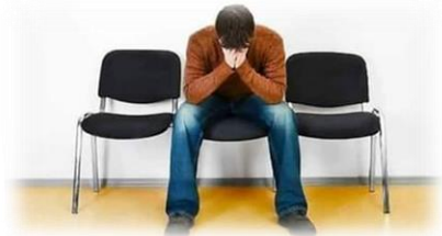
منع: اسلام او دین