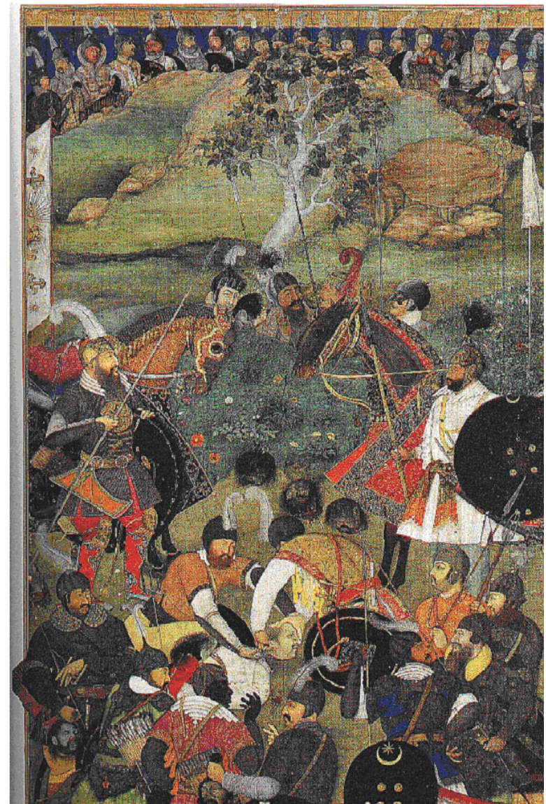
د خان جهان قتل په شاهجهان نامه کې