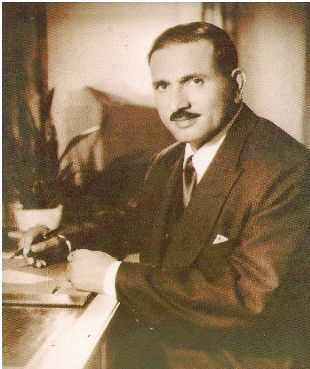
جریان وظیفه در وزارت مالیه دولت جمهوری افغانستان زمان سردار محمد داود خان .