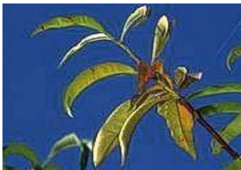
د شفتالو په پاڼو کې د نایتروجن د کمښت نښه