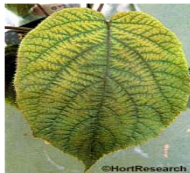
په کی وی فروټ کې د جښتو د کمښت نښه