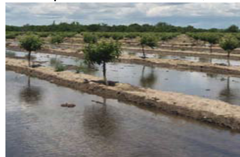
ځوان باغ د يو مخيز اوبه خور لاندي