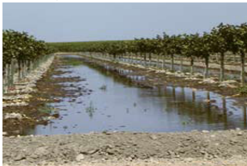
پولي لرونکې يو مخيز اوبه خور

د خاوري پر بنياد د مهال ویش مېتودونه (څنگه پوه شو چې څه وخت اوبه ولگوو): اوبه لگول بايد هغه وخت ترسره شي چې 50% اوبه له خاوري څخه جذب شوي وي. په خاوره کې د اوبو د محتوا تود معلومولو لپاره يورمبي، بيلچه او ياد خاوري نل را واخلي اود 20 څخه 40 ساتي پورې وکني. هغه خاوره چې تقريباً 50 فيصده اوبه ولري په لاندي ډول احساسېږي: