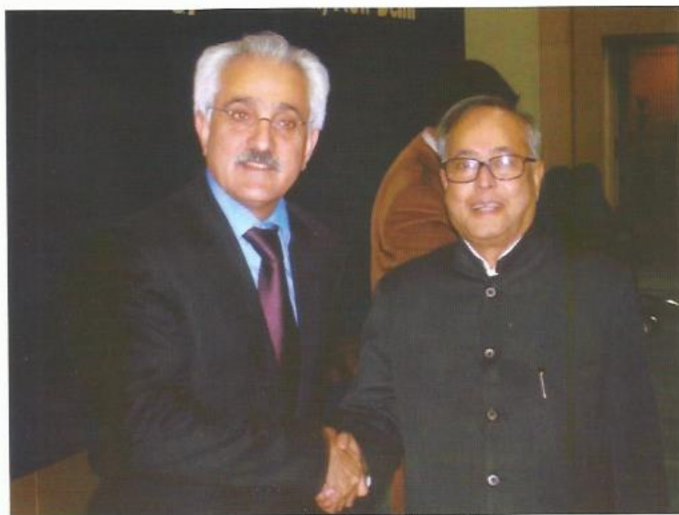
دیدار با پراناب مکر جی، رئیس جمهور هند.