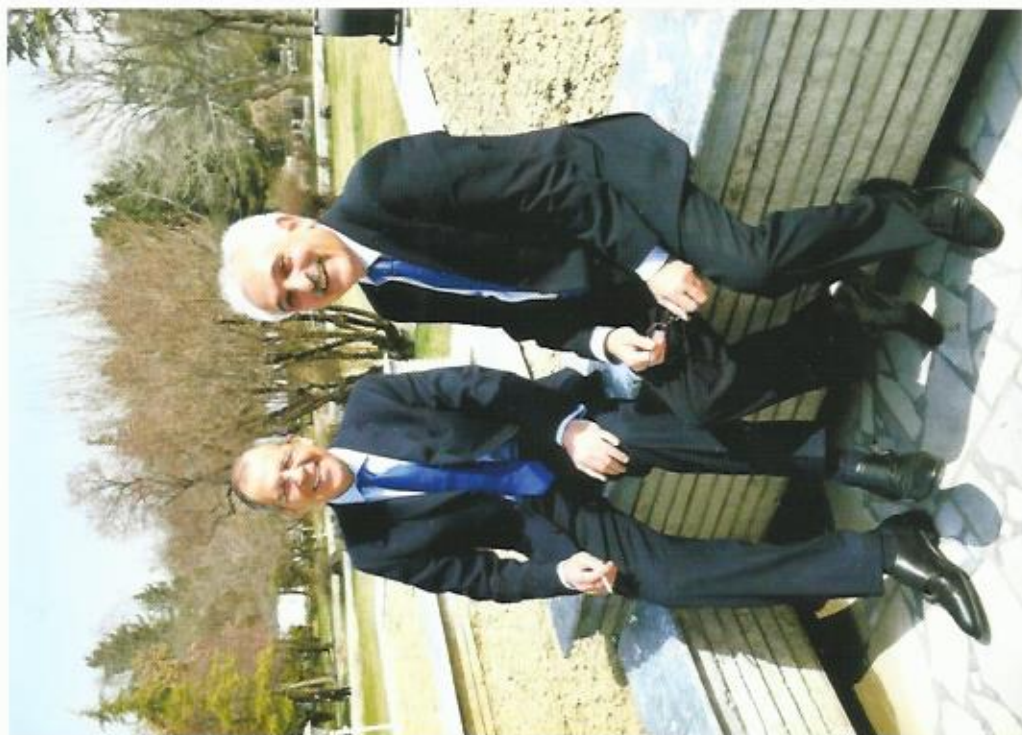
با سرگی لاوروف وزیر خارجه‌ی فدراتیف روسیه، وزارت خارجه افغانستان، ۲۰۰۸.