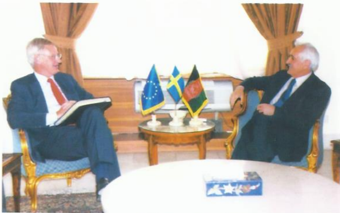
دیدار با کارل بریل، وزیر خارجه‌ی کشور شاهی سویدن، کابل.