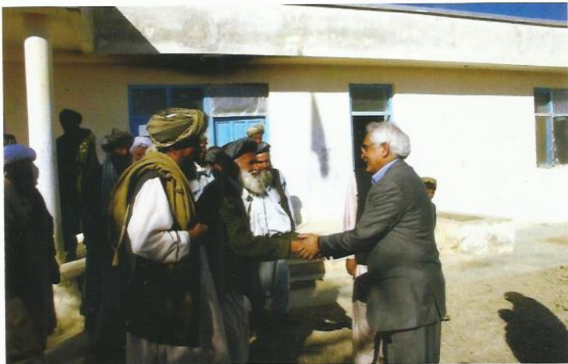
مصافحه با مردم، ولسوالی گرمسیر، ولایت هلمند، ۲۰۰۷.