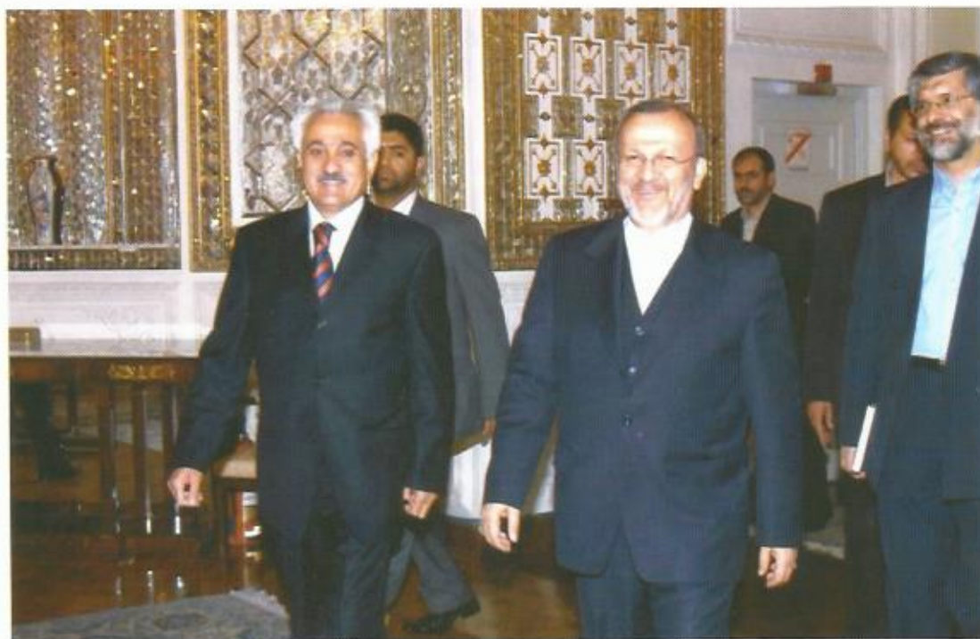
دیدار با منوچهر متکی، وزیر خارجه‌ی جمهوری اسلامی ایران،