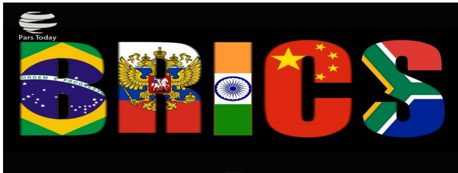
(۱) د غړو هېوادونو ده نومونو دسر حروف او پکې د اړونده هېواد بیرغ

بیلانخیره ۲۰۰۹ جون ۱۶ م کال اوله رسمي جلسه د روسي یکاترینبورگ ښار کې ترسره شوه. ۲۰۱۱ م کال کې ورسره جنوبي افریقا هم یوځای شوه چې له دې سره یې نوم له بریک څخه بریکس ته تغیر شو. ۲