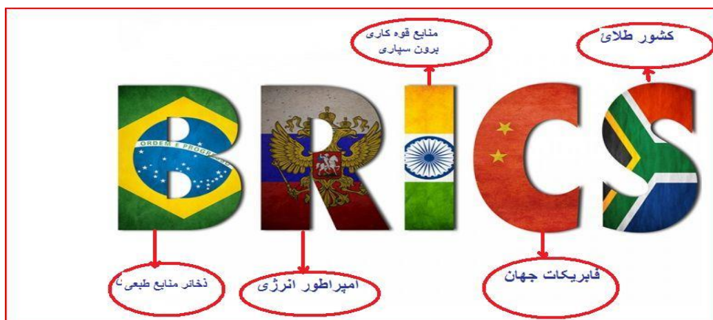
(۵) په عکس کې د عضوه هیوادونو یوه یوه مهمه ځانگړنه په سره خط کې تاو شوي