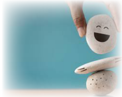
دا هم ولولئ: