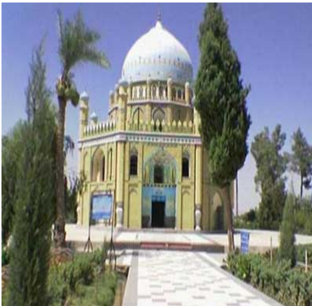
په کندهار کې د میرویس نیکه مقبره

کال کې د اخکزیو په سپمې کې د توبې غرونو ته چې دوی پې تر کندهاره سوړ دی، لار. ټپونه پې د هر ورځې په تېرېدلو بد تړېدل، او د ۱۷۷۳ ز کال د جون د مېاشتي په لومړیو کې پې د یو پېنځوس کالو په عمر له دې نړۍ څخه سترگې پټې کړې. جسد پې کندهار ته راوړل شو او د خانگري درنښت او منښت او د ناورین په ځپو کې خاورو ته وسپارل شو. د کندهار د پرگنو د وگړو په منځ کې د دراني احمد شاه آرامځای له زښت ډېر درنښته برخمن دی. تر دې چې که څوک د دښمن د غچ د وېرې له کبله هلته پناه یوسي او کښېنې نو ان دولت هم دغسې مجرم ته لاس نه وروړي. که کوم بوډا او زور سړی له ورځنیو چارو راضي نه وي هغه ته پوه خانگري دعا ده چې وایي: غواړم پاتې ژوند د احمد شاه په آرامځای کې په دعا او عبادت تېر کړم.