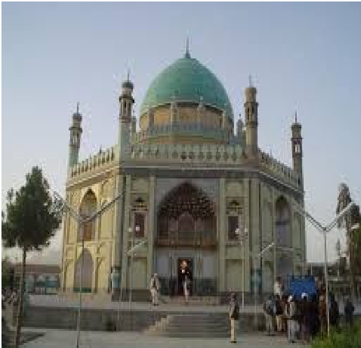
په کندهار کې د دراني احمد شاه مقبره

د دراني احمد شاه پر پوزي باندي له ۱۷۶۴ ز کال وروسته د سرطان دانه څرگنده شوې وه، بابا، د د سرطان د داني د وخامت له کبله په ۱۷۷۳ ز