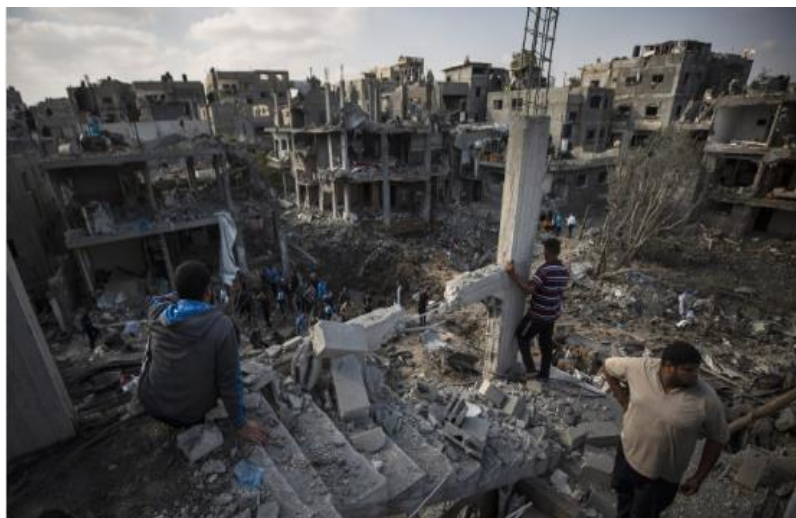
د غزې ترانگې انځور د جگړې ليکي نه