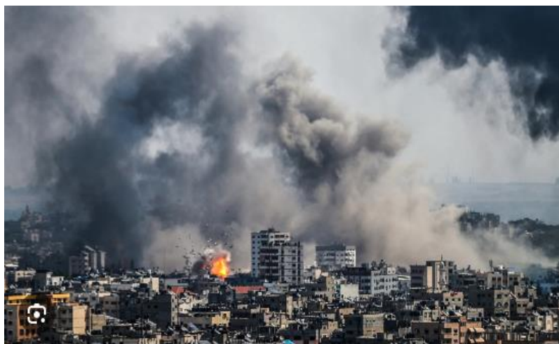
د غزې ترانگې انځور د جگړې ليکي نه