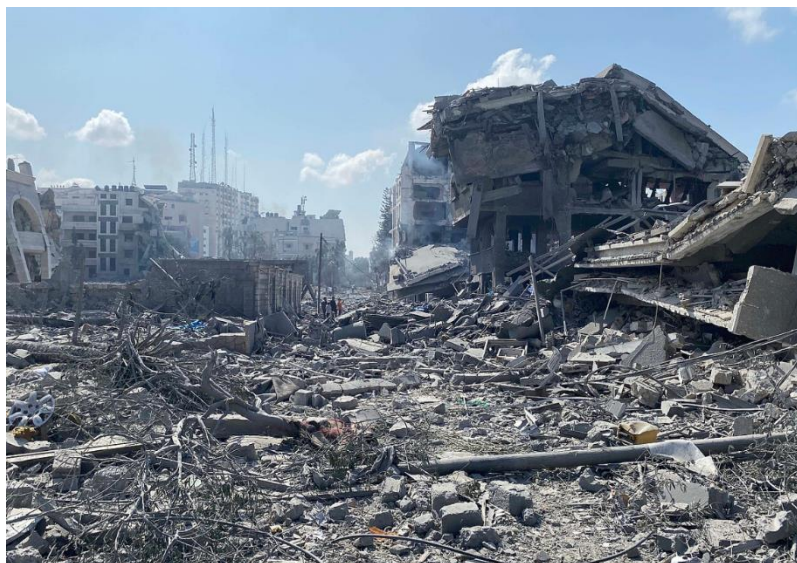
د غزې ترانگې انځور د جگړې ليکي نه