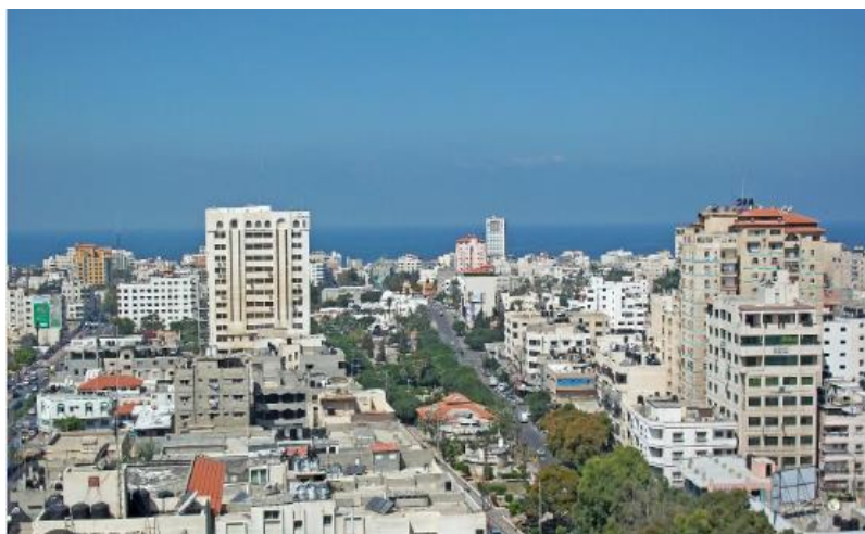
د غزي ترانگي انځور، مخکي د اکتوبر / ۷ / کال ۲۰۲۳ څخه