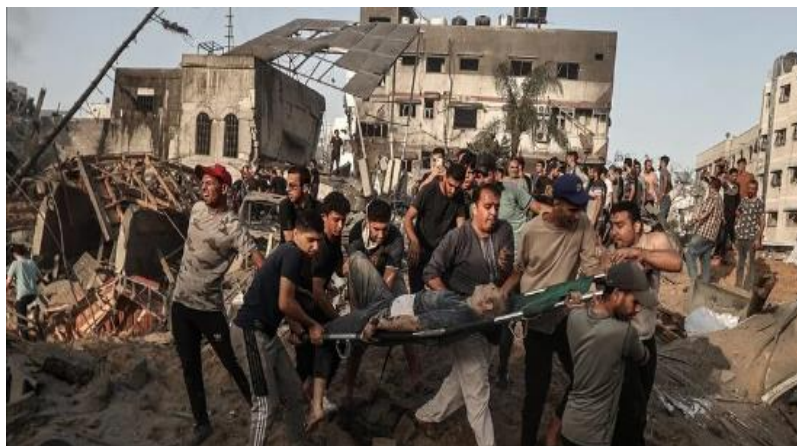
د غزي ترانگي انځور د جگړې ليکي نه