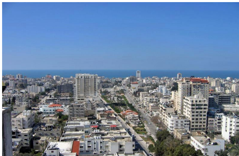
د غزي ترانگي انځور، مخکي د اکتوبر / ۷ / کال ۲۰۲۳ څخه