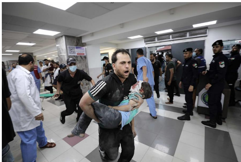
د غزې ترانگې انځور د جگړې ليکي نه