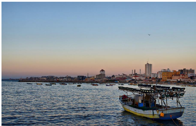
د غزي ترانگي انځور، مخکي د اکتوبر / ۷ / کال ۲۰۲۳ څخه