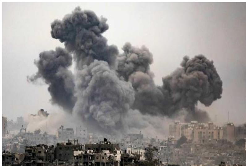
د غزې ترانگې انځور د جگړې ليکي نه