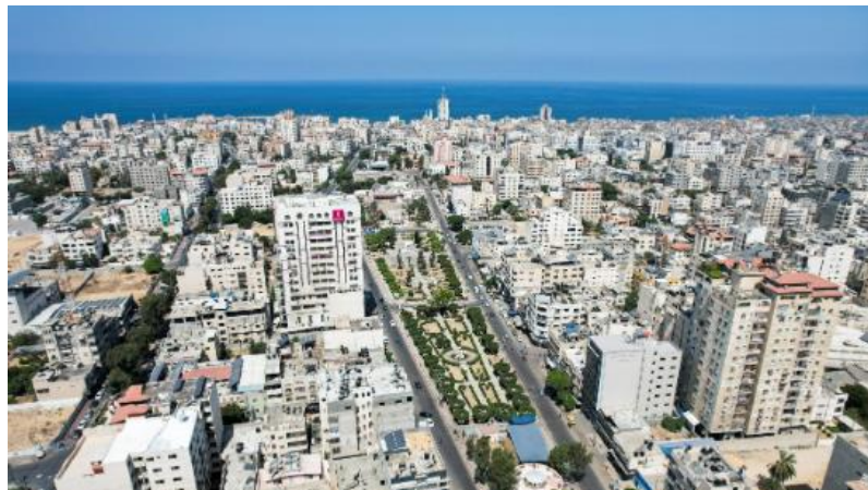
د غزې ترانگې انځور، مخکې د اکتوبر / ۷ / کال ۲۰۲۳ څخه

د غزې ترانگې انځورونه، مخکې د اکتوبر / ۷ / کال ۲۰۲۳ څخه