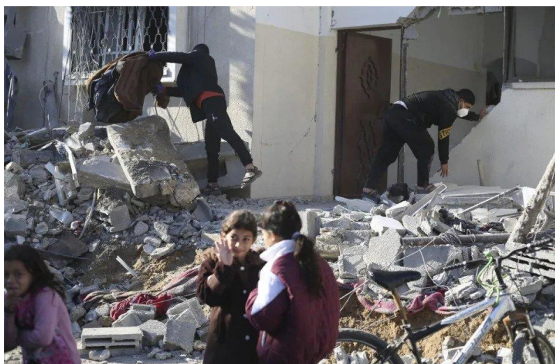
د غزې ترانگې انځور د جگړې ليکي نه