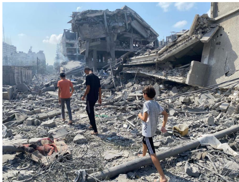
د غزي ترانگي انځور د جگړې ليکي نه