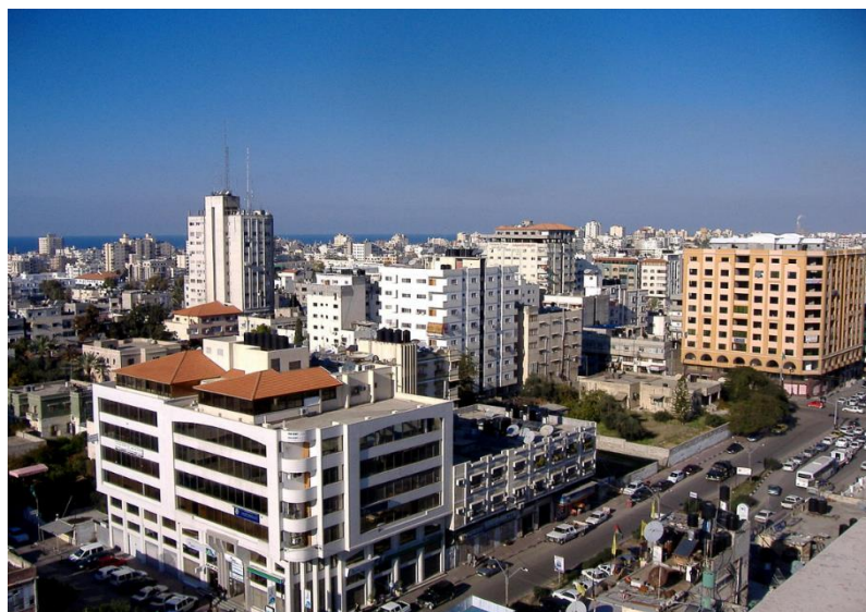
د غزي ترانگي انځور، مخکي د اکتوبر / ۷ / کال ۲۰۲۳ څخه