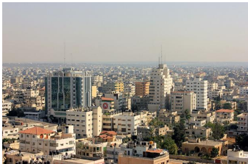
د غزې ترانگې انځور، مخکې د اکتوبر / ۷ / کال ۲۰۲۳ څخه