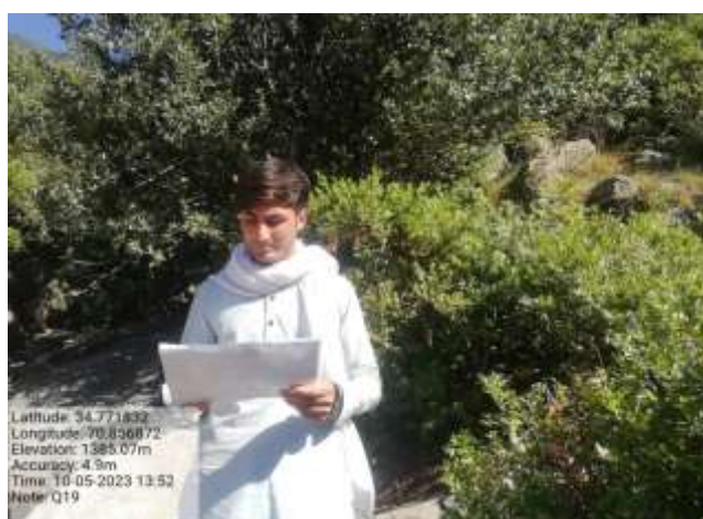
شکل (۲۴): د د ډیتا راټولولو بنودنه کوي