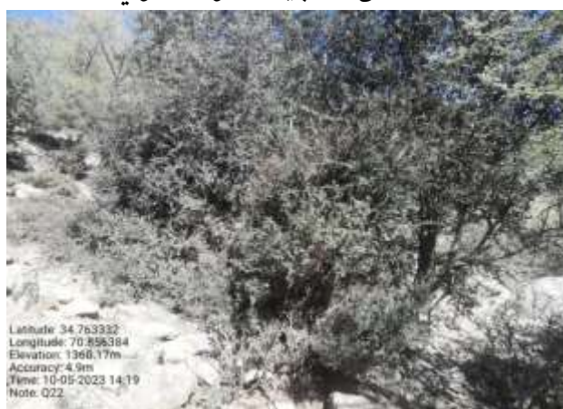
شکل (۲۲): د بیرې بنودنه کوي