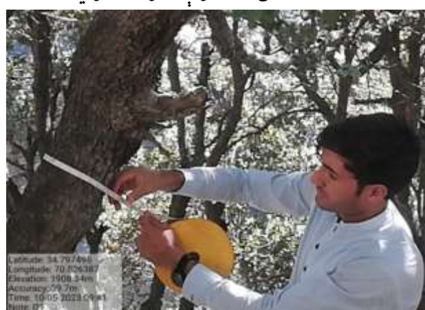
شکل (۲۱): د قطر اندازه کولو بنودنه کوي