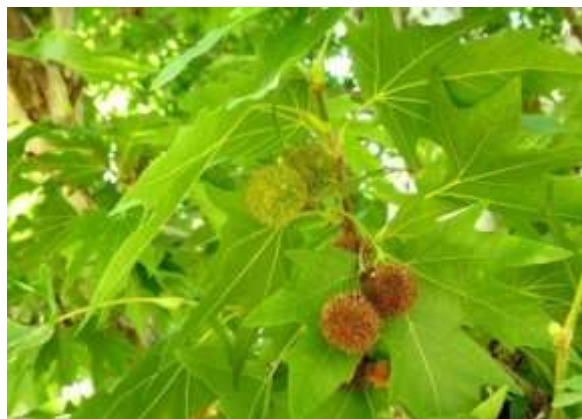
شکل (۲۰): د چینار بنودنه کوي