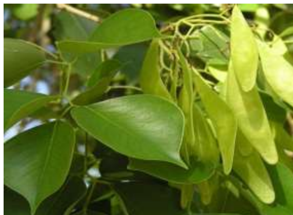
شکل (۱۹): د شوې بنودنه کوي