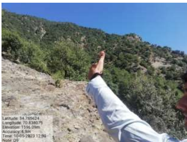
شکل (۲۳): د ونې د ارتفاع د اندازه کولو بنودنه